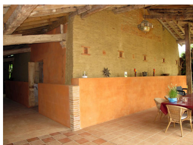
Vue de l'arrière du four.