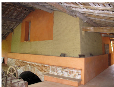
Vue générale du four après transformation.