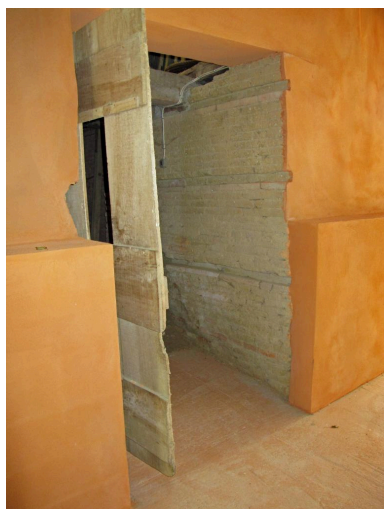
Entrée de la chambre de cuisson.