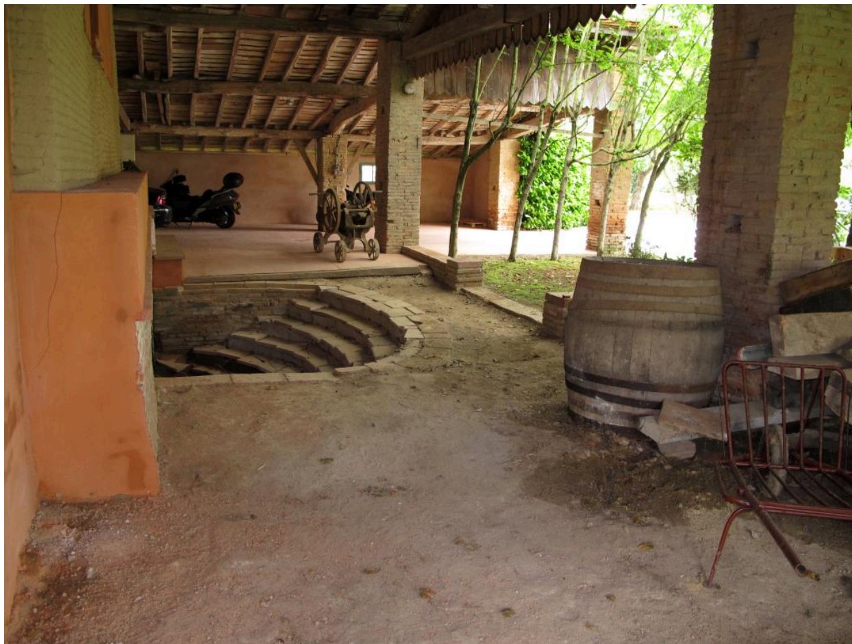
Vue d'ensemble de l'appentis devant le four.