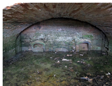
Vue de l'intérieur du four. IVR76_20213100132NUCA