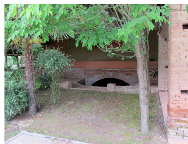
Entrée de l'accès au foyer. IVR76_20213100137NUCA