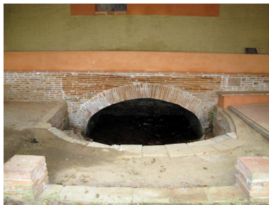
Entrée du foyer.