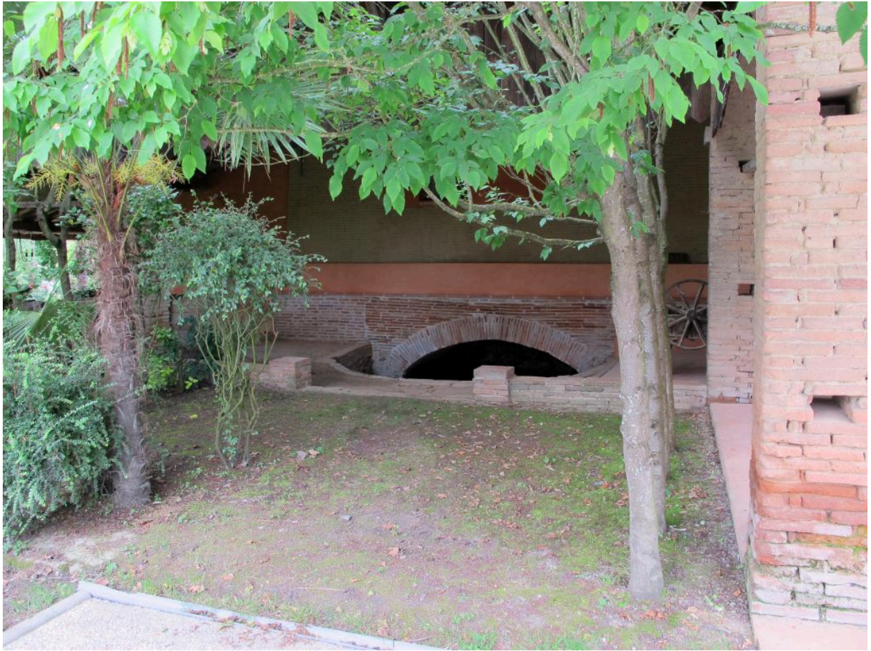
Entrée de l'accès au foyer.