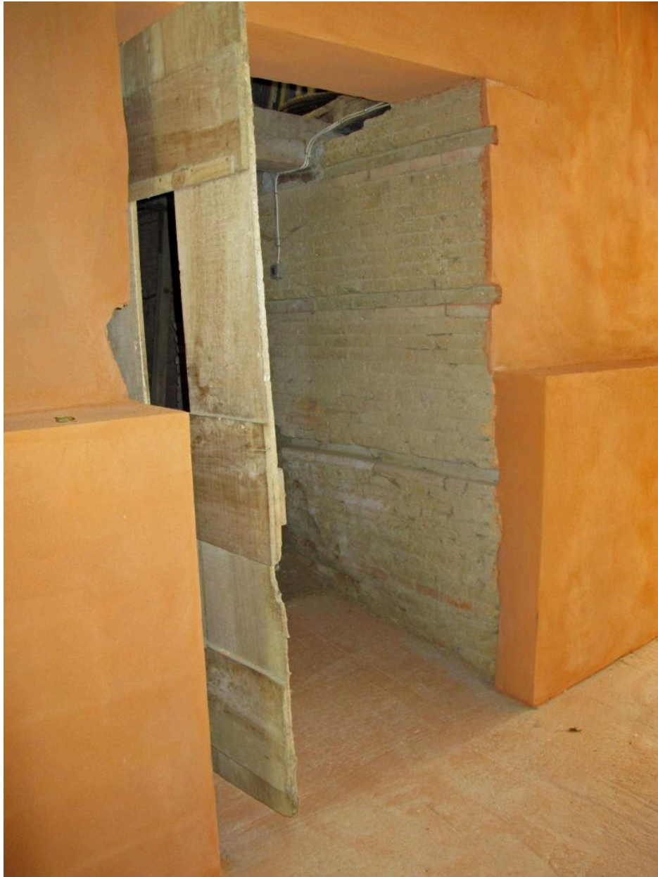
Entrée de la chambre de cuisson.