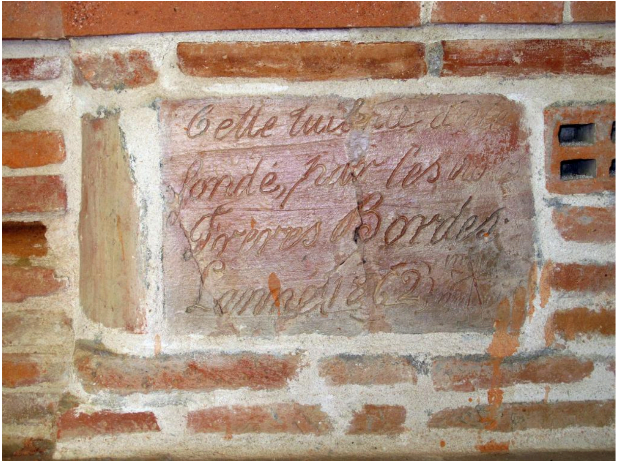
Tuile scellée dans un mur, portant une inscription rappelant l'année de fondation de la tuilerie : 1862