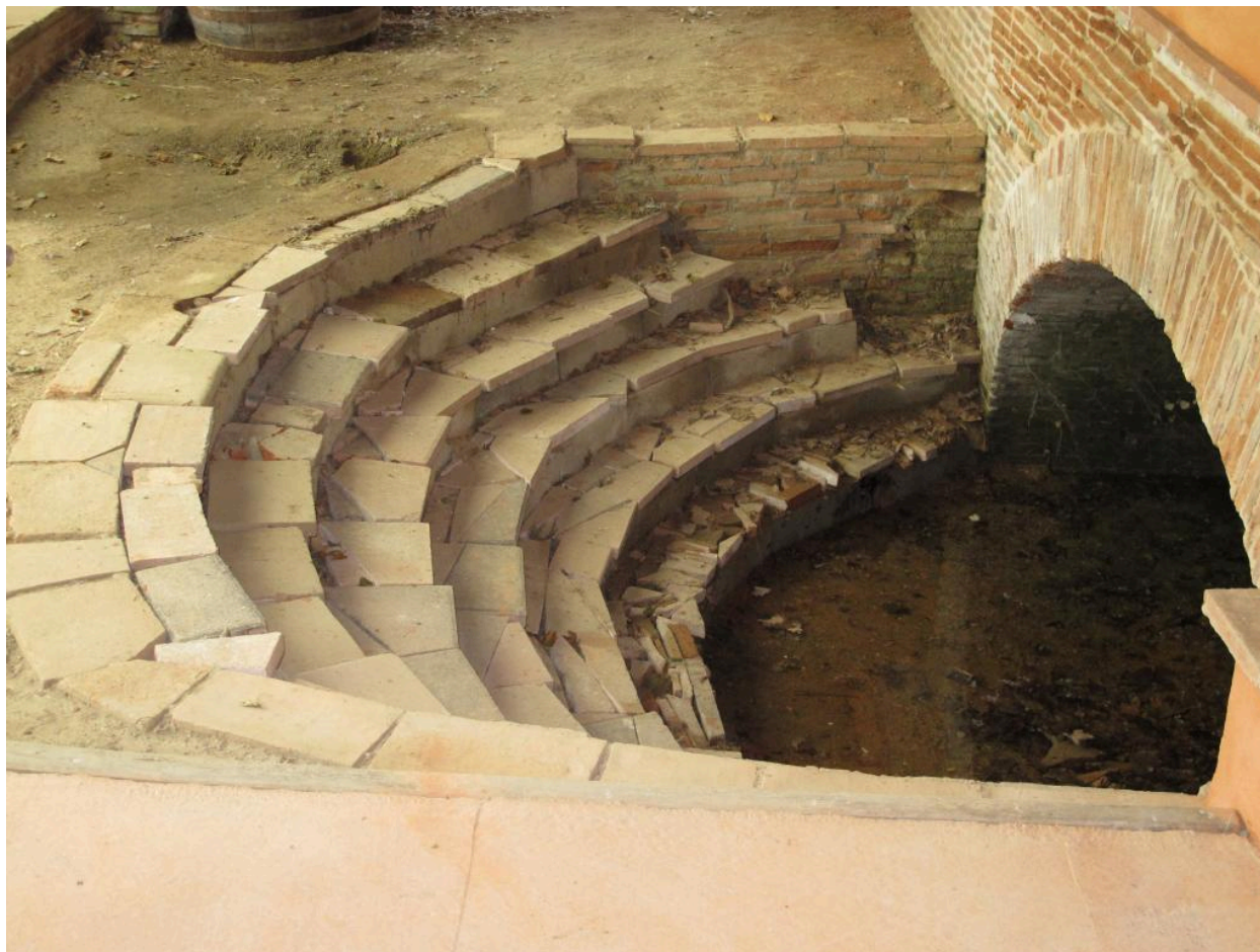
Entrée du foyer.