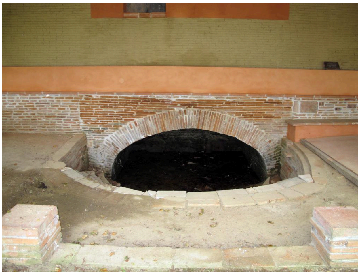
Entrée du foyer.