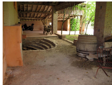
Vue d'ensemble de l'appentis devant le four.