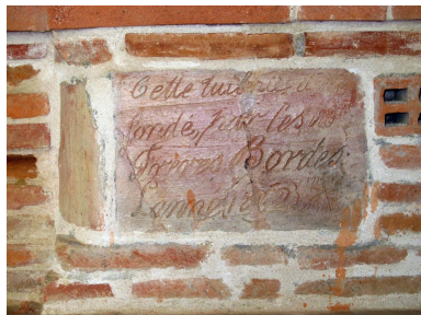
Tuile scellée dans un mur, portant une inscription rappelant l'année de fondation de la tuilerie : 1862 IVR76_20213100139NUCA