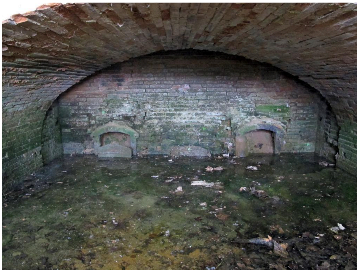
Vue de l'intérieur du four.