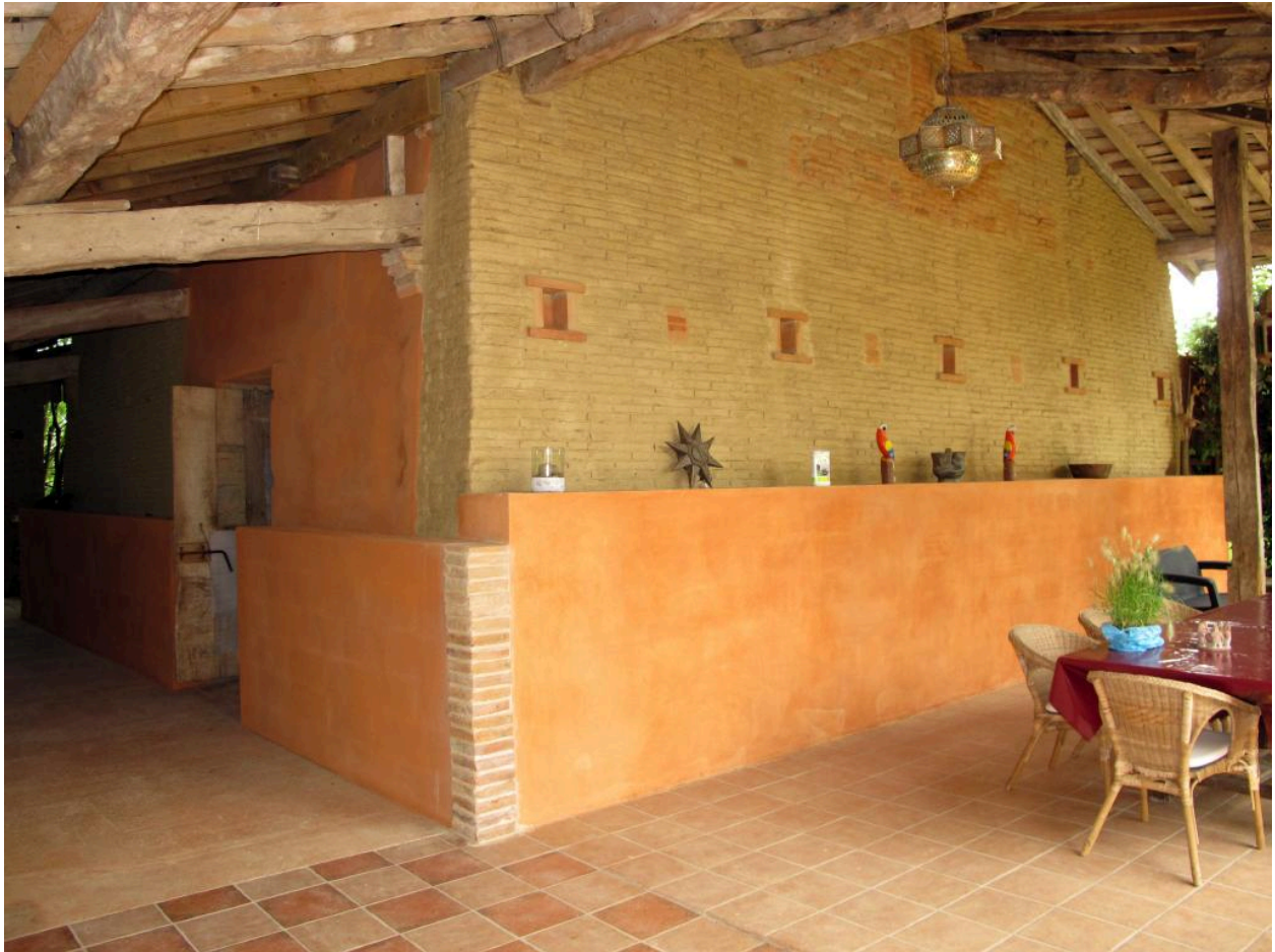
Vue de l'arrière du four.