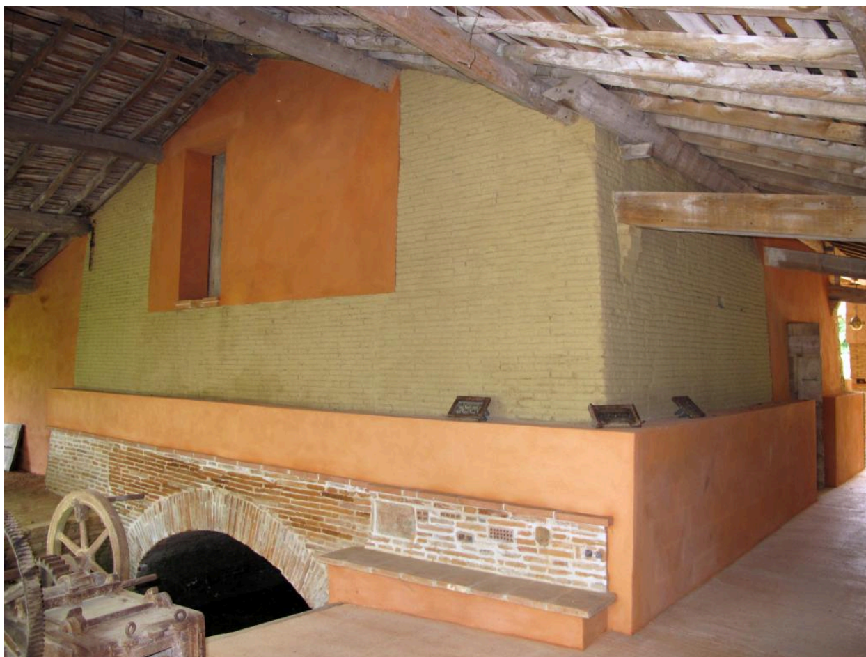
Vue générale du four après transformation.