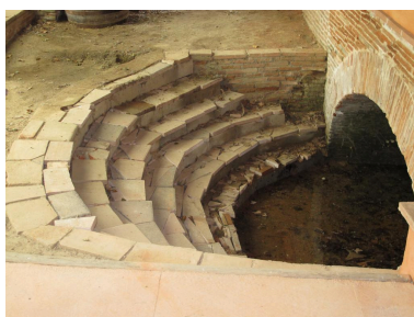
Entrée du foyer. IVR76_20213100140NUCA