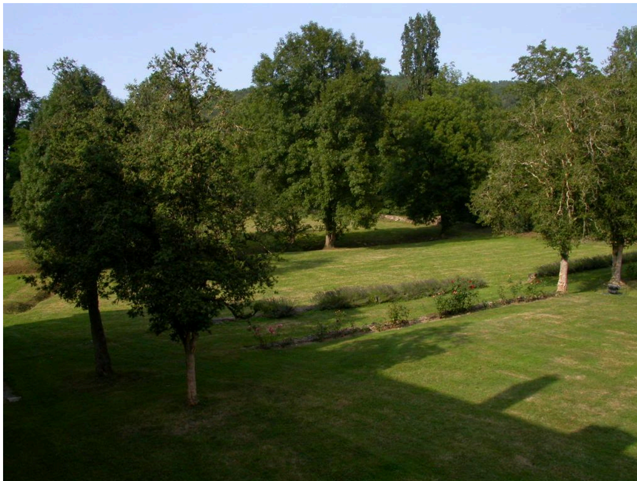
Vue sur les jardins (secteur nord-est) et le vivier de l'abbaye.