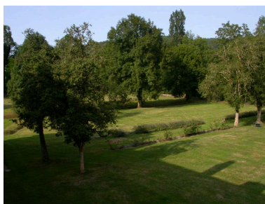
Vue sur les jardins (secteur nord- est) et le vivier de l'abbaye. IVD65_20116500035NUCA