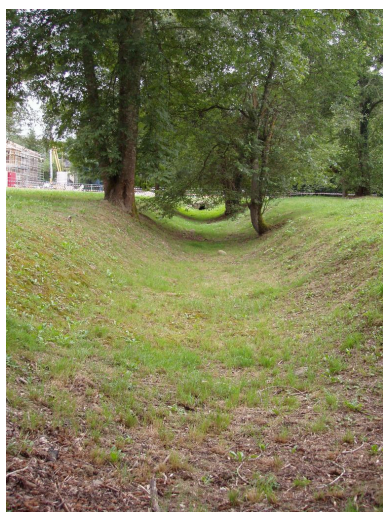
Vue d'ensemble du vivier. IVD65_20116500019NUCA