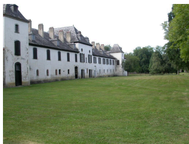
Vue sur les jardins et la façade est de l'abbaye.