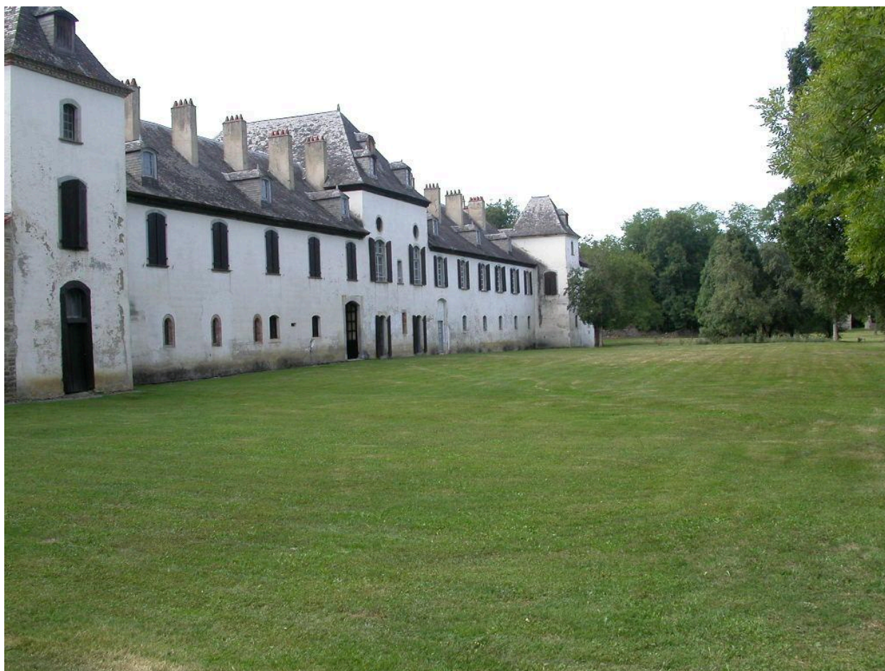
Vue sur les jardins et la façade est de l'abbaye.