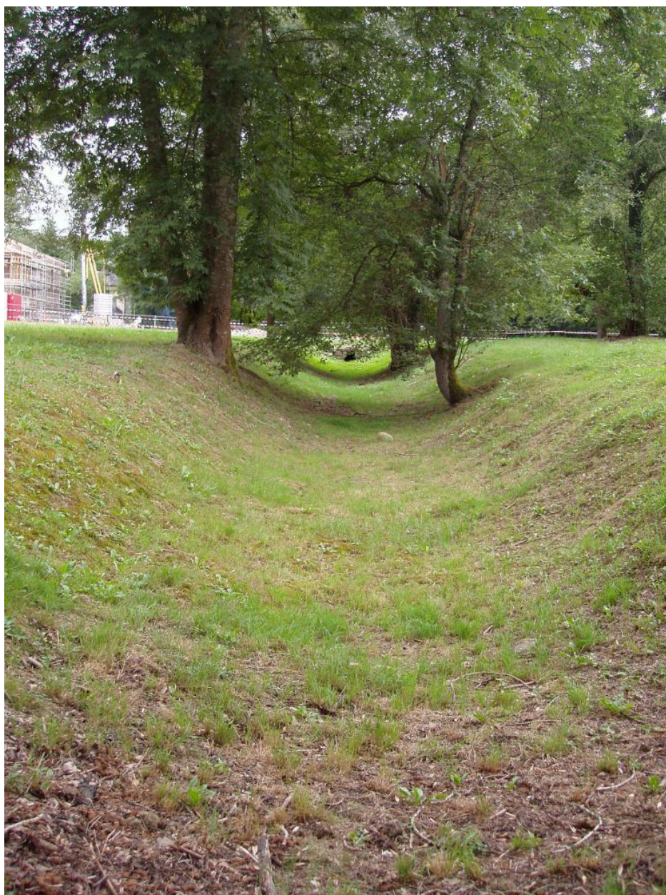
Vue d'ensemble du vivier.