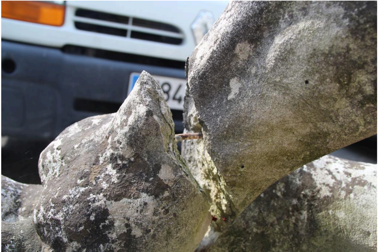
détail de l'oeuvre : la patte arrière du taureau est cassée