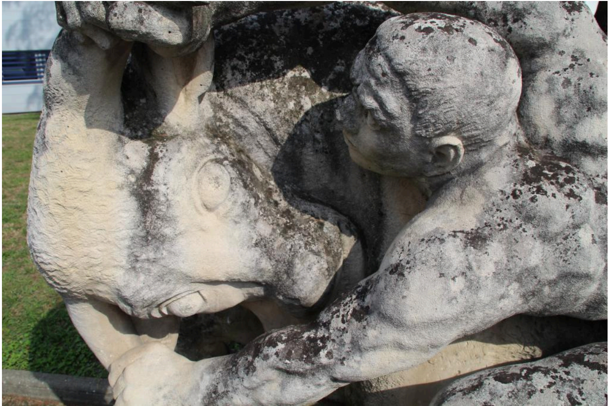
détail de l'oeuvre