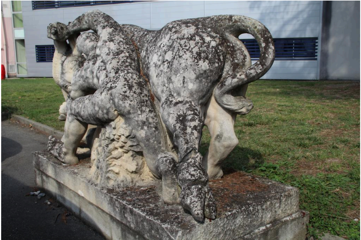
vue générale de la sculpture