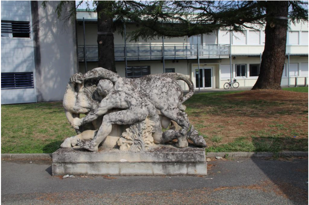
vue générale de la sculpture