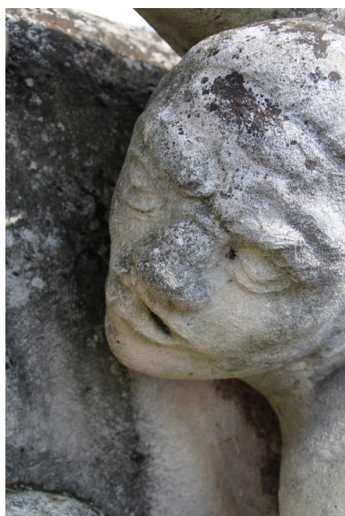
détail de l'oeuvre : visage