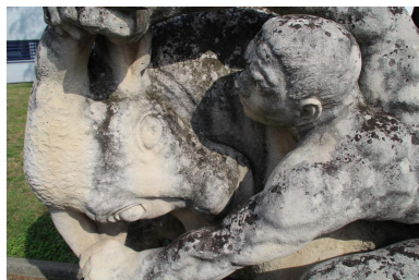
détail de l'oeuvre IVR76_20166501024NUCA