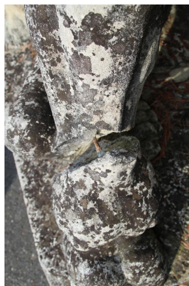
détail de l'oeuvre : patte arrière du taureau est cassée