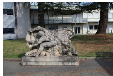
vue générale de la sculpture IVR76_20166501026NUCA

IVR76_20166501021NUCA