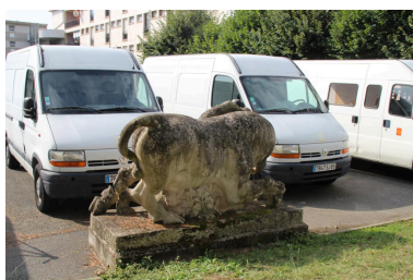
vue de dos de la sculpture IVR76_20166501025NUCA