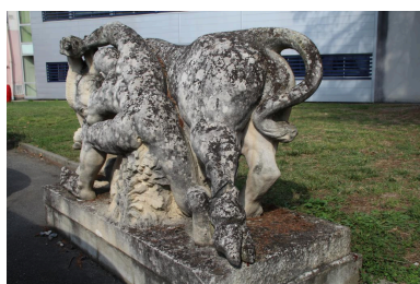
vue générale de la sculpture IVR76_20166501020NUCA