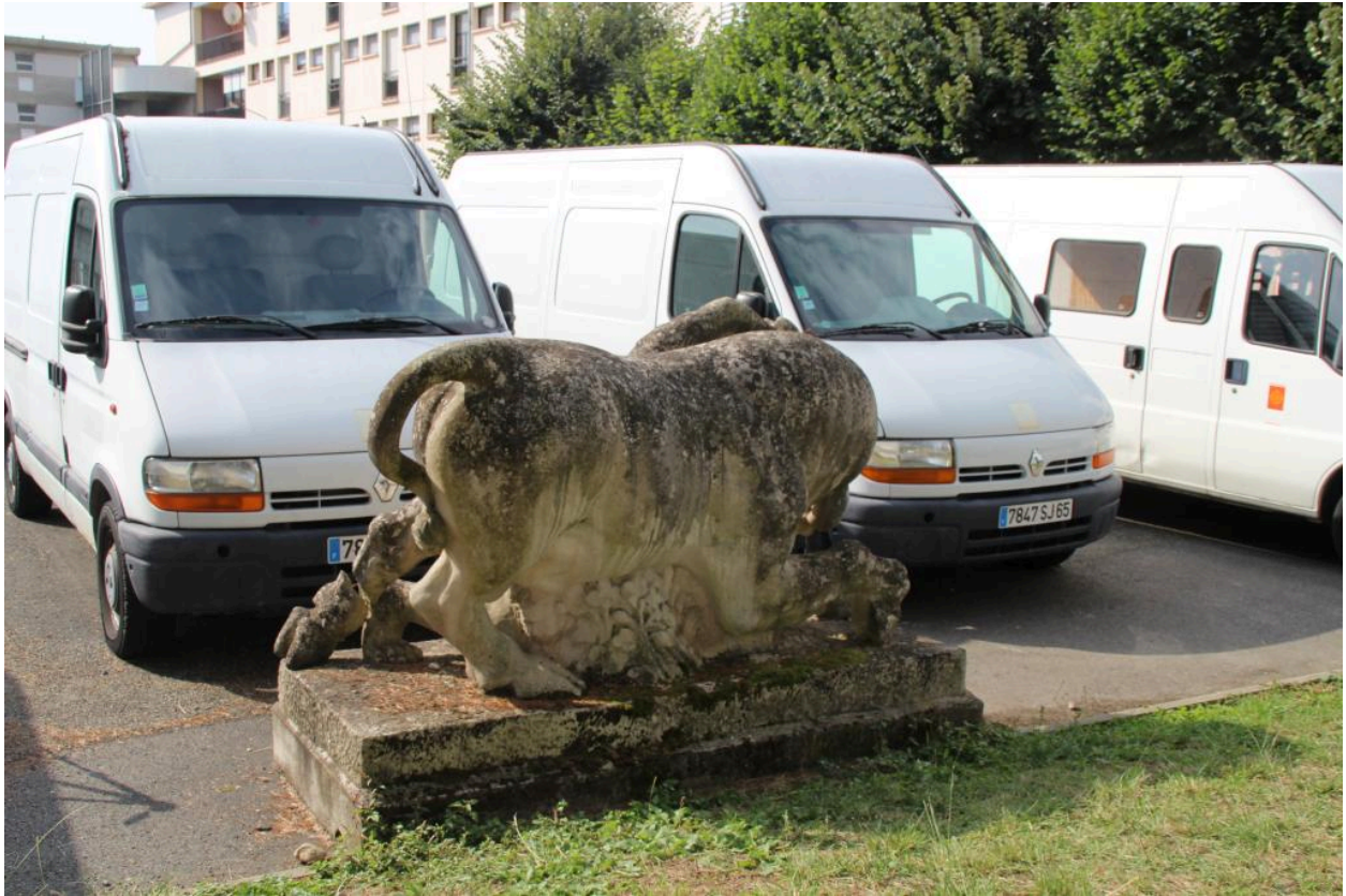
vue de dos de la sculpture