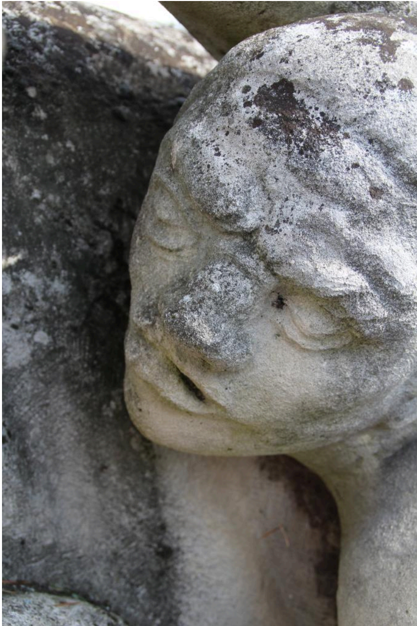
détail de l'oeuvre : visage