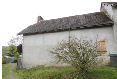
Vue de l'élévation nord de la maison.

Phot. Marion Fourcayran IVD65_20136500273NUCA