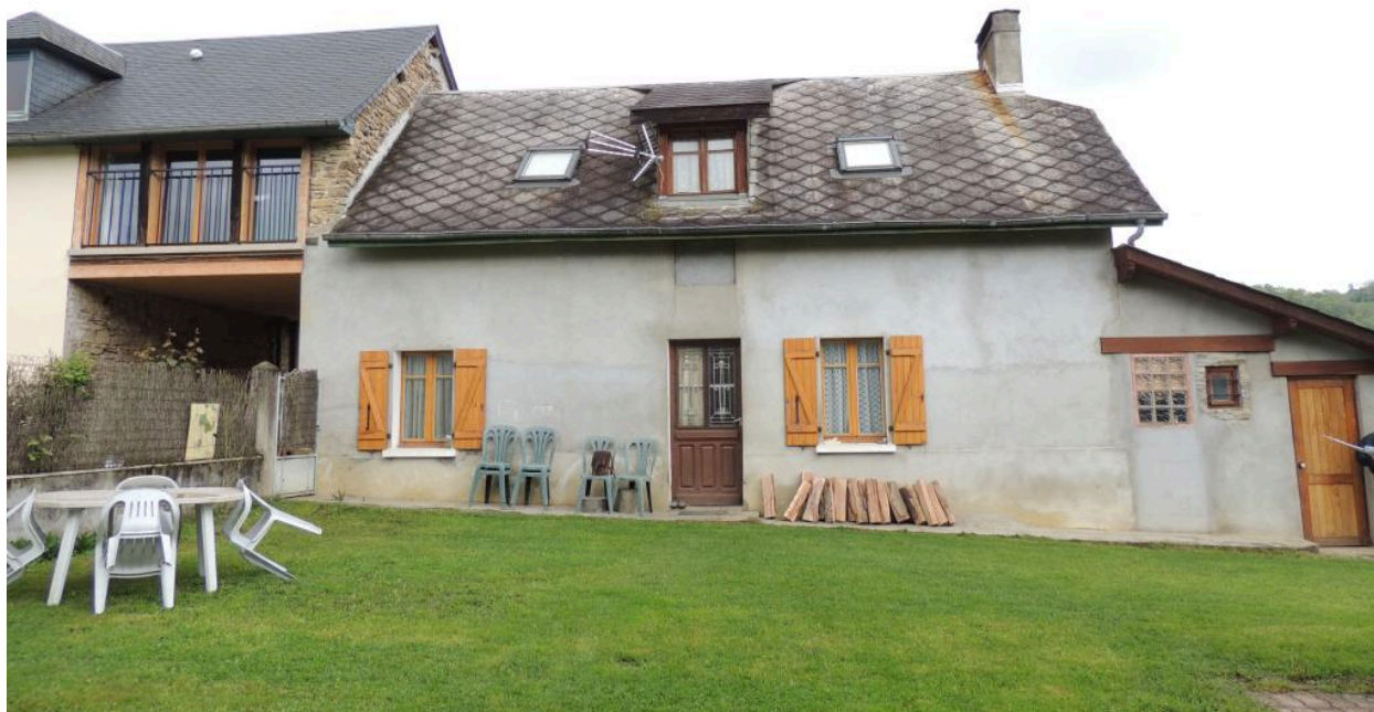
Vue de l'élévation principale depuis le sud.