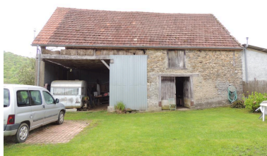
Vue des dépendances depuis le nord.

Phot. Marion Fourcayran IVD65_20136500273NUCA