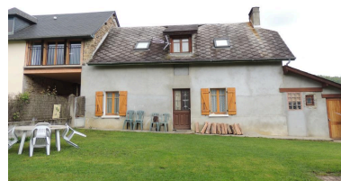
Vue de l'élévation principale depuis le sud. IVD65_20136500272NUCA

IVD65_20136500274NUCA