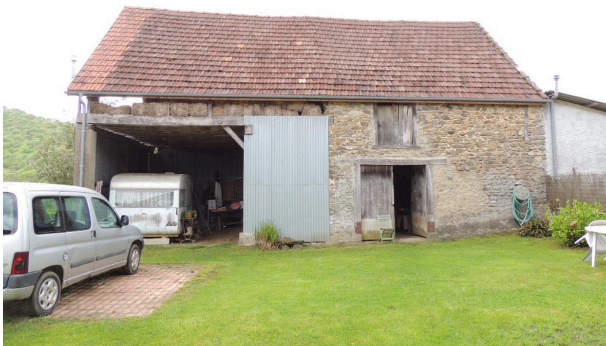
Vue des dépendances depuis le nord.