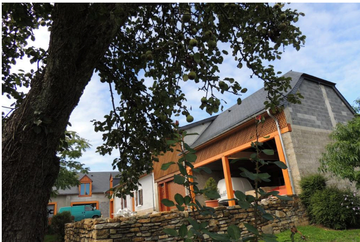
Vue générale depuis le sud-est.