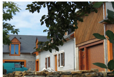
Détail de la partie ancienne du logis. IVD65_20146500634NUCA