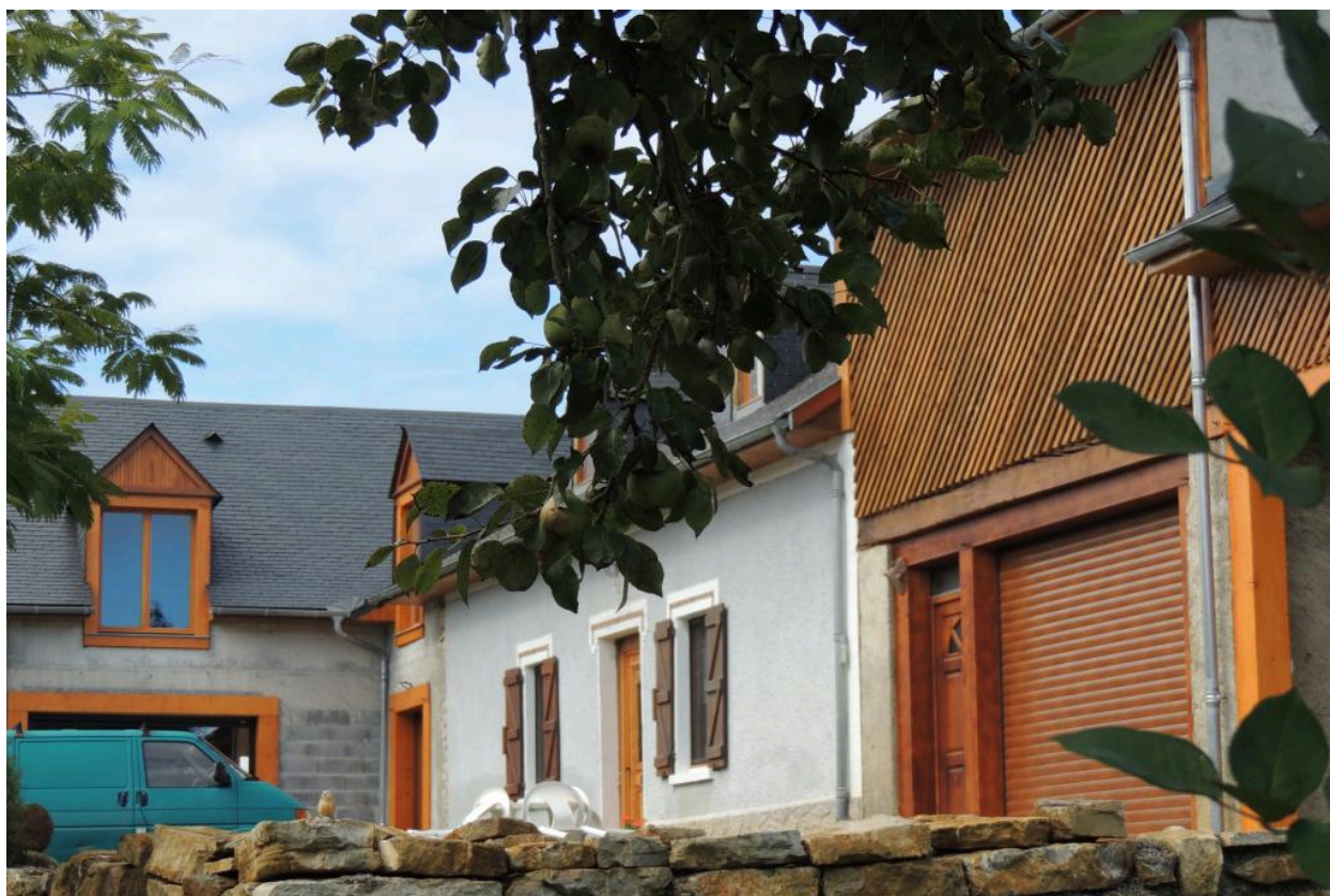
Détail de la partie ancienne du logis.