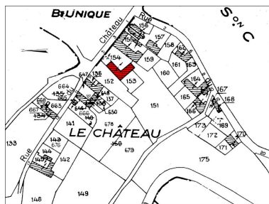
Plan de situation (cadastre 2012). IVD65_20146500680NUCA