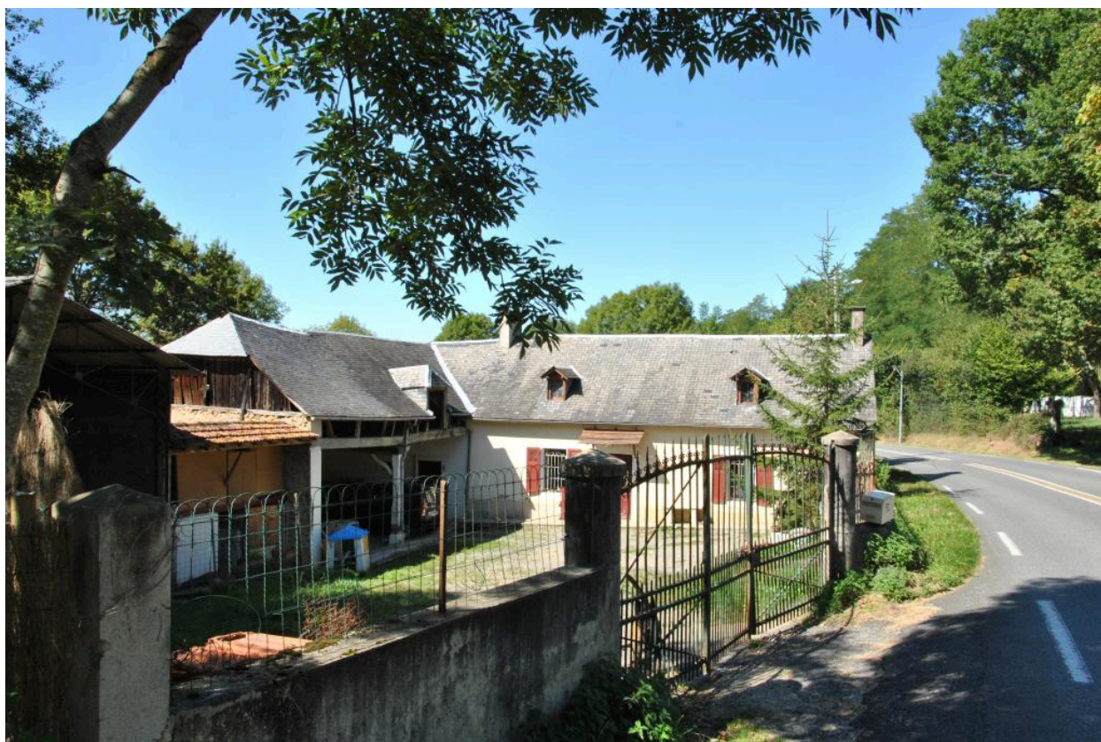
Vue de la ferme depuis l'est.