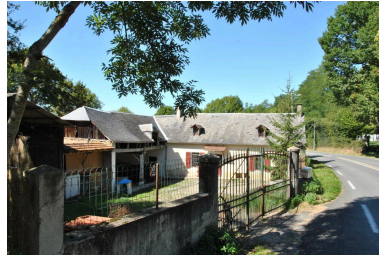
Vue de la ferme depuis l'est. IVD65_20146500584NUCA