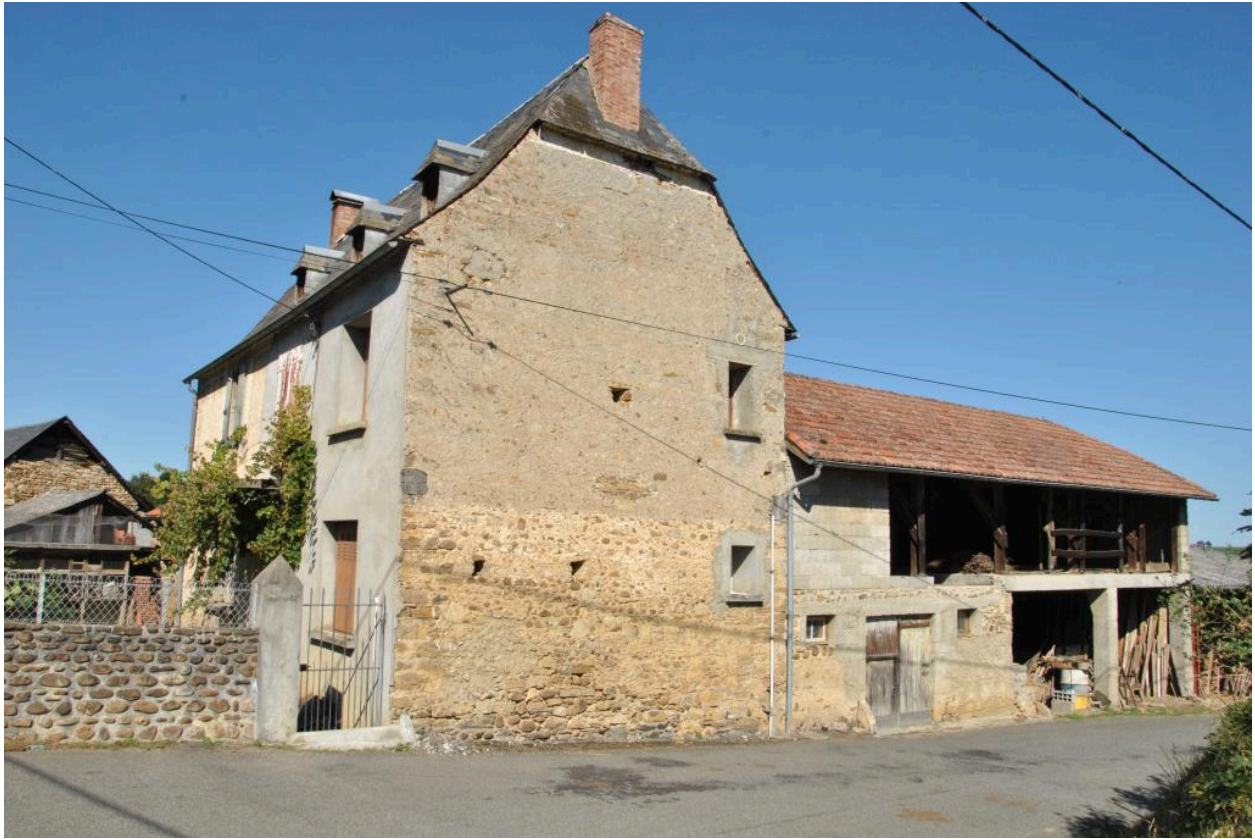
Vue depuis l'est.