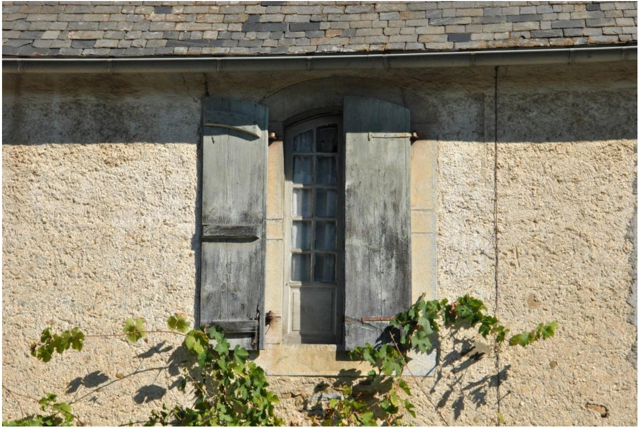
Détail d'une fenêtre de l'élévation principale.