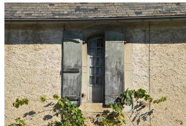
Détail d'une fenêtre de l'élévation principale. IVD65_20146500396NUCA