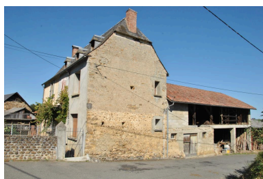
Vue depuis l'est. IVD65_20146500397NUCA