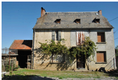
Vue de l'élévation principale depuis le sud.