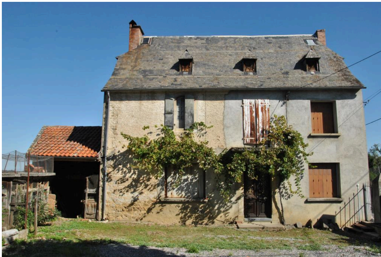
Vue de l'élévation principale depuis le sud.