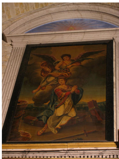
Tableau : sainte Catherine d'Alexandrie. IVR73_20103201044NUCA