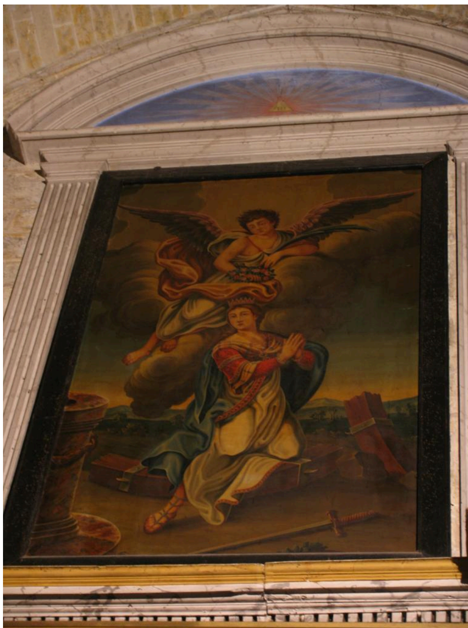
Tableau : sainte Catherine d'Alexandrie.