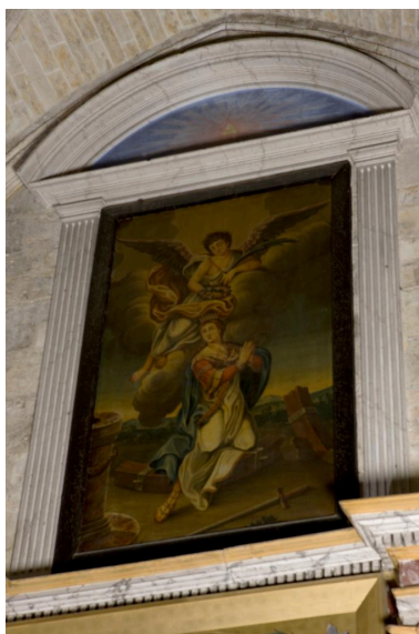
Vue d'ensemble du tableau.