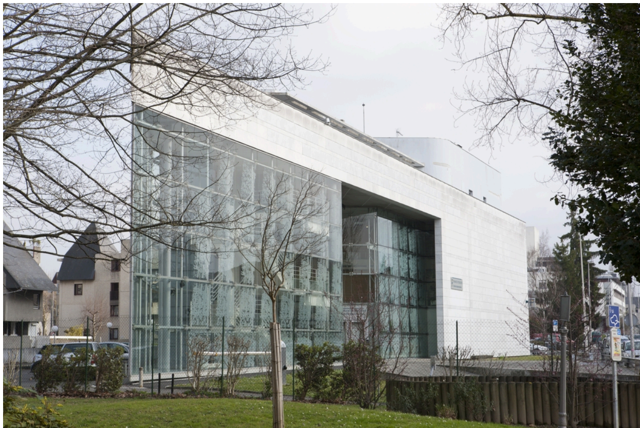
Vue d'ensemble depuis le parc Chastelain.