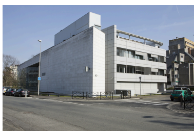
Elévation sud.