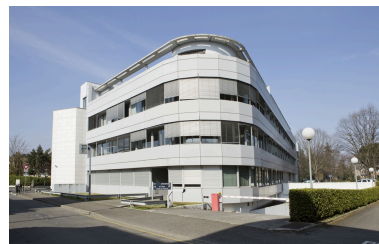
Angle sud-est.