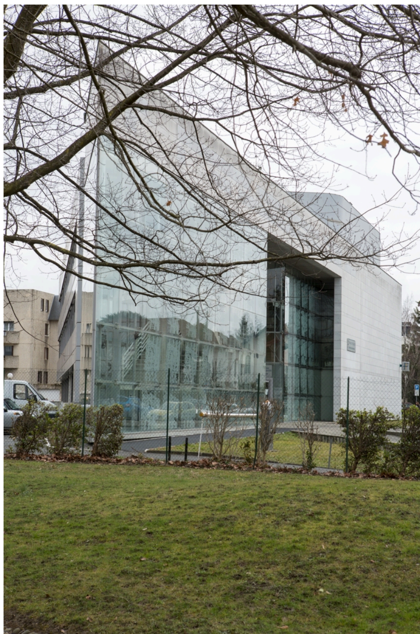
Vue de côté depuis le jardin Fould.