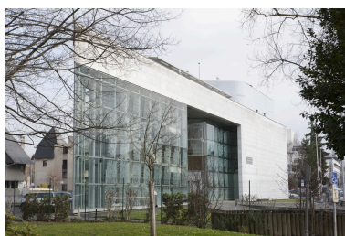
Vue d'ensemble depuis le parc Chastelain.