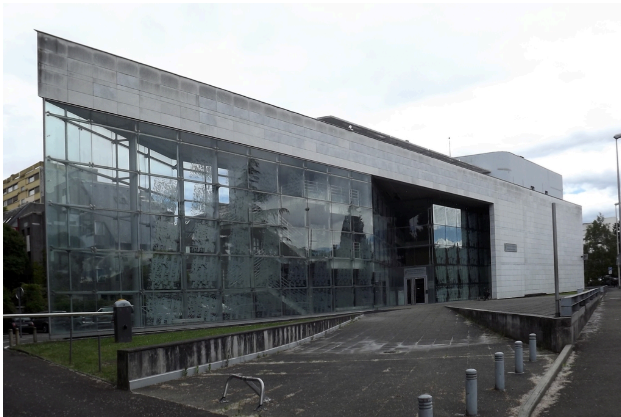
Vue d'ensemble de l'élévation ouest depuis le nord-ouest.