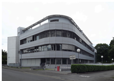
Angle sud-est. IVR73_20146501091NUCA