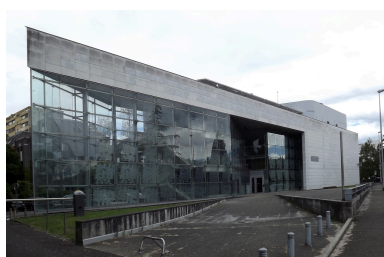
Vue d'ensemble de l'élévation ouest depuis le nord-ouest.