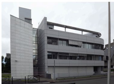
Elévation sud. IVR73_20146501090NUCA