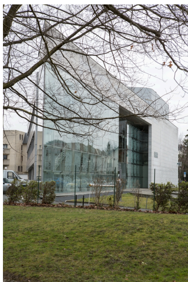
Vue de côté depuis le jardin Fould.