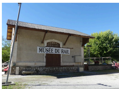
Halles à marchandises : élévation nord.