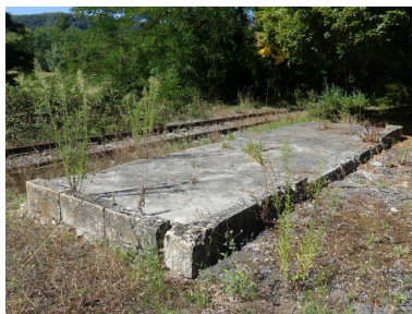
Vestiges d'un abri de voyageurs.