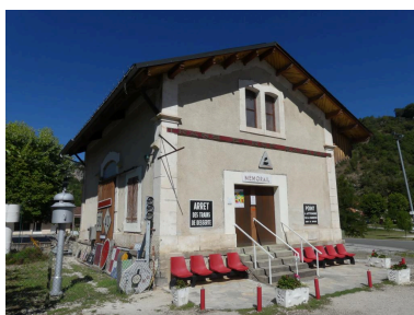
Halles à marchandises : mur-pignon est. IVD46_20204602061NUCA