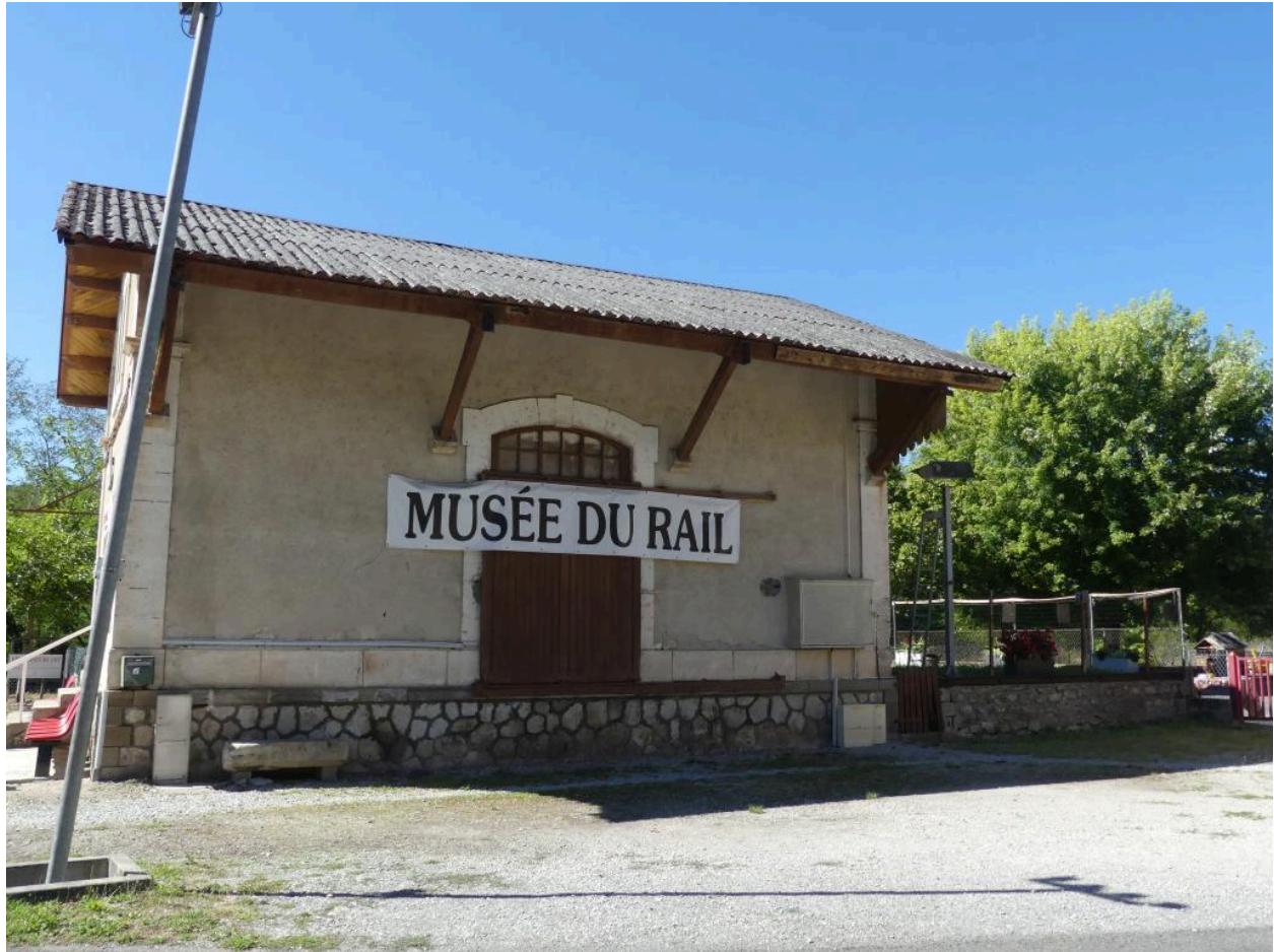
Halles à marchandises : élévation nord.