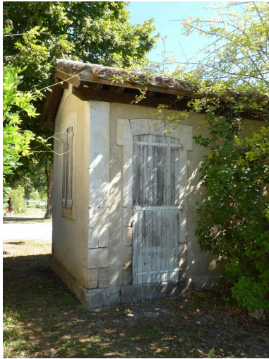
Toilettes et lampisterie. IVD46_20204602058NUCA