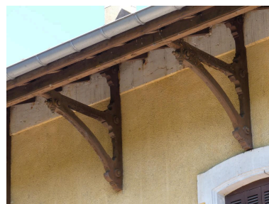
Bâtiment des voyageurs, élévation sud : détail des aisseliers. IVD46_20204602057NUCA