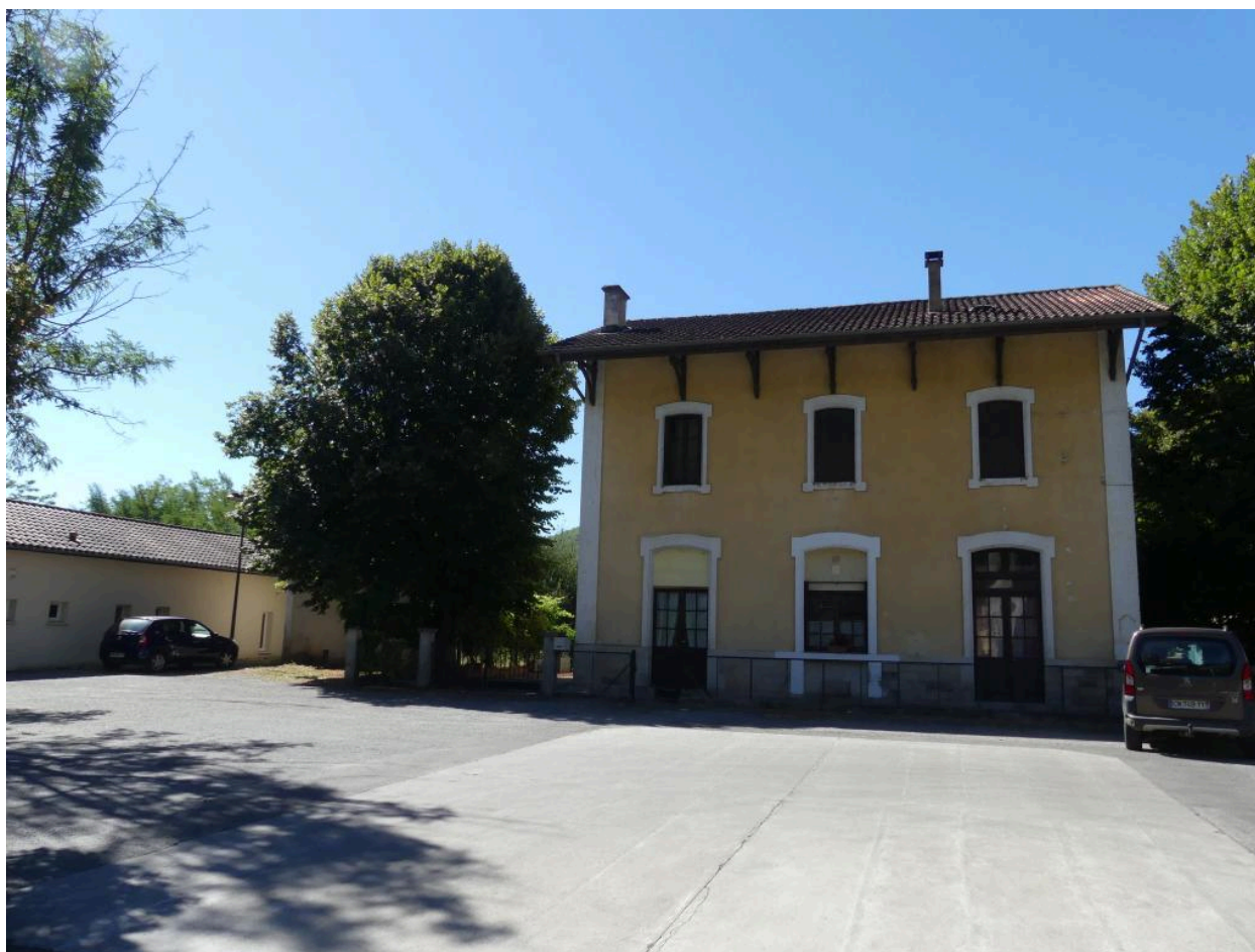
Bâtiment des voyageurs : élévation nord.