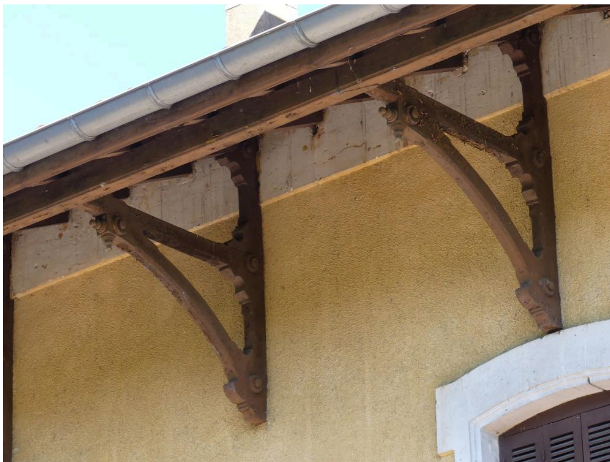
Bâtiment des voyageurs, élévation sud : détail des aisseliers.