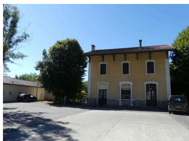
Bâtiment des voyageurs : élévation nord. IVD46_20204602064NUCA