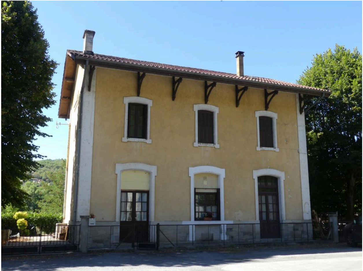
Bâtiment des voyageurs : élévation nord.