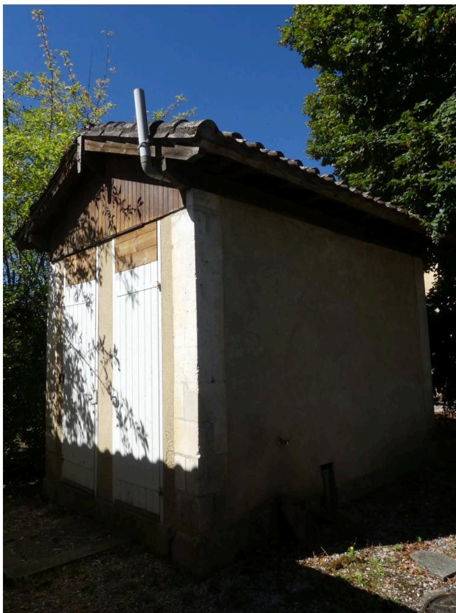
Toilettes et lampisterie.