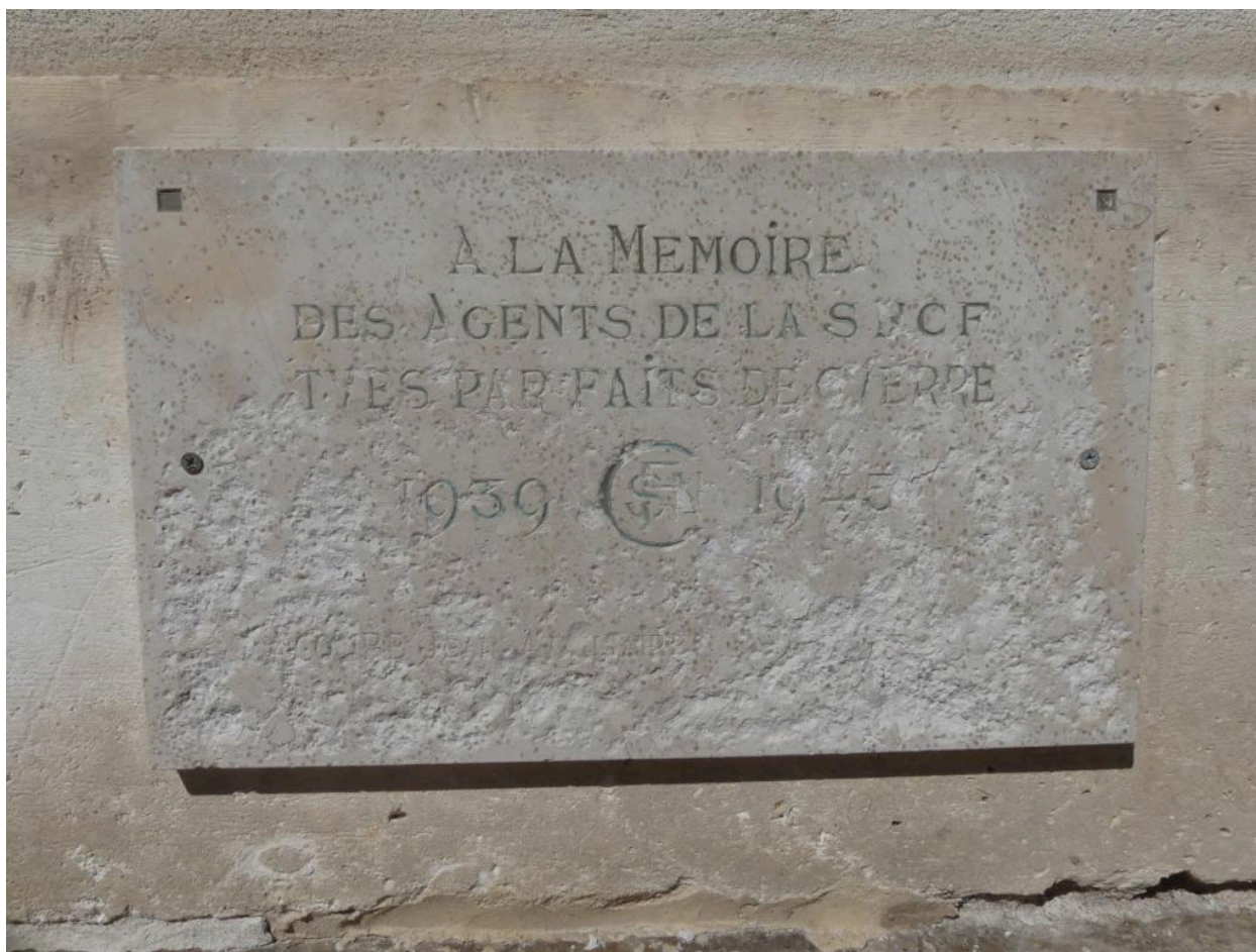
Plaque commémorative fixée sur le mur-pignon ouest.