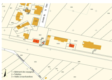
Extrait du plan cadastral de 2019. IVD46_20204602108NUCA