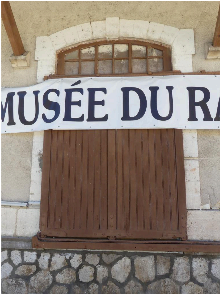
Halles à marchandises, élévation nord : porte.