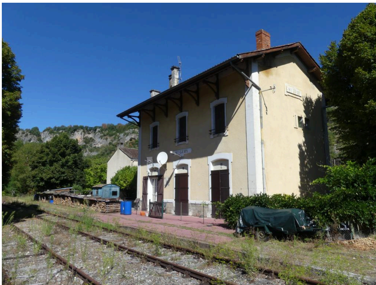
B timent des voyageurs : vue depuis le sud-est.