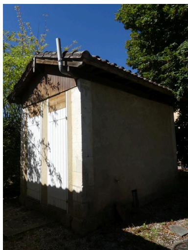
Toilettes et lampisterie. IVD46_20204602055NUCA