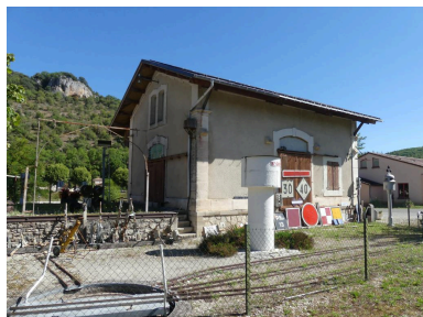
Halles à marchandises, vue depuis le sud. IVD46_20204602051NUCA