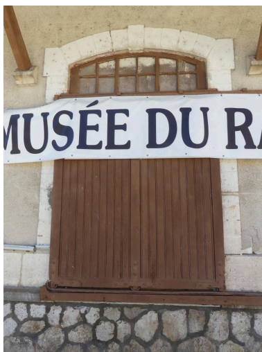
Halles à marchandises, élévation nord : porte. IVD46_20204602065NUCA