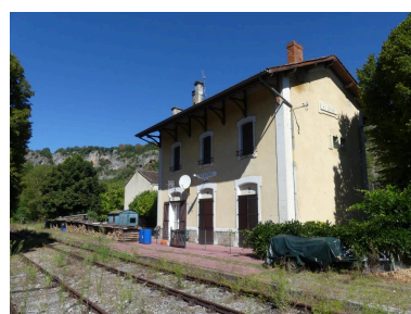
Bâtiment des voyageurs : vue depuis le sud-est. IVD46_20204602062NUCA