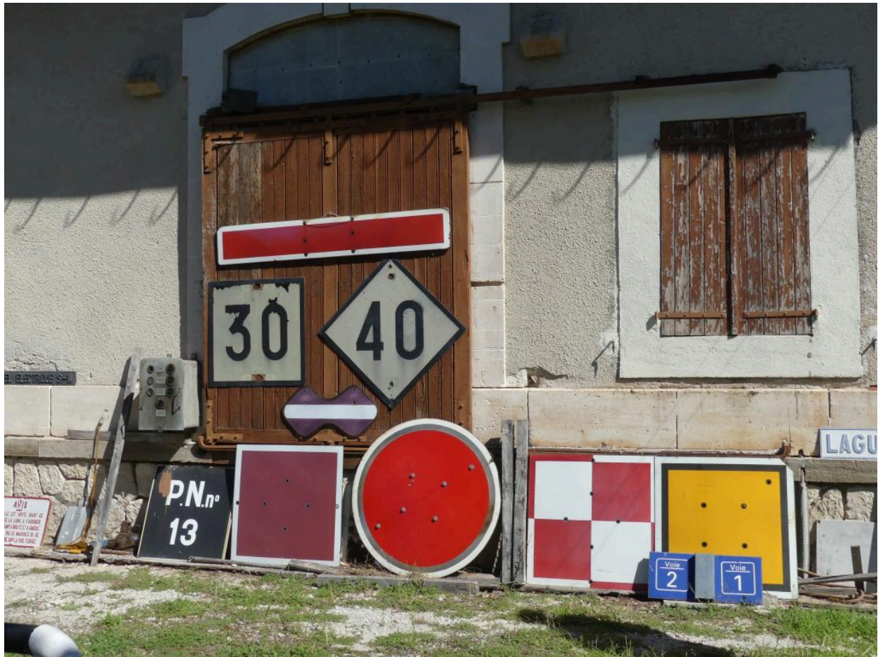
Halles à marchandises, élévation sud : porte.