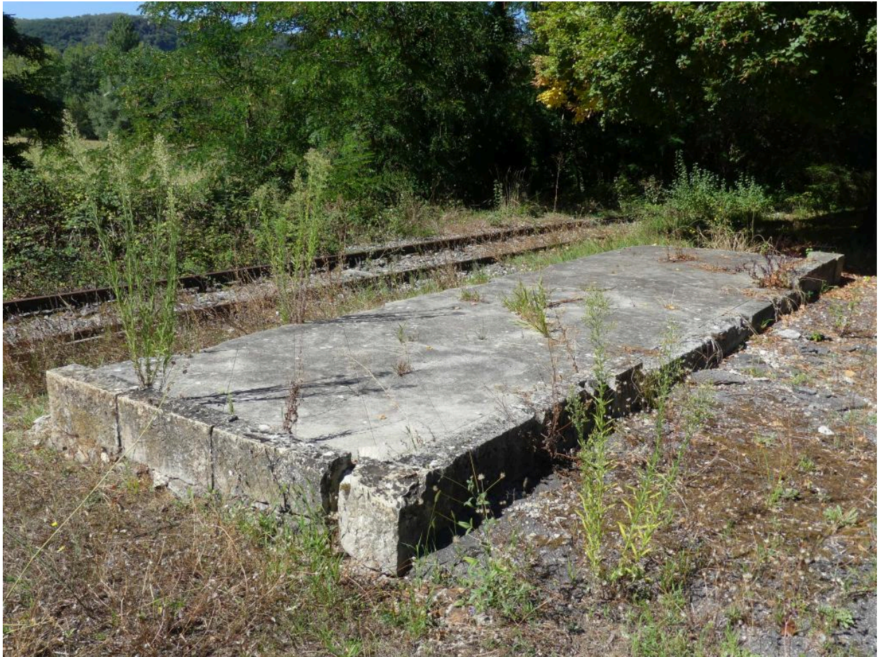
Vestiges d'un abri de voyageurs.