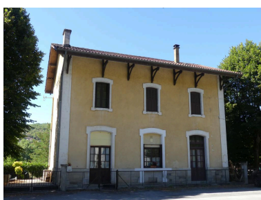
Bâtiment des voyageurs : élévation nord. IVD46_20204602052NUCA