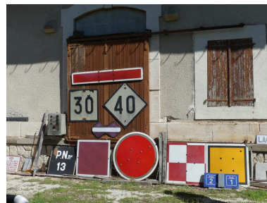
Halles à marchandises, élévation sud : porte. IVD46_20204602063NUCA