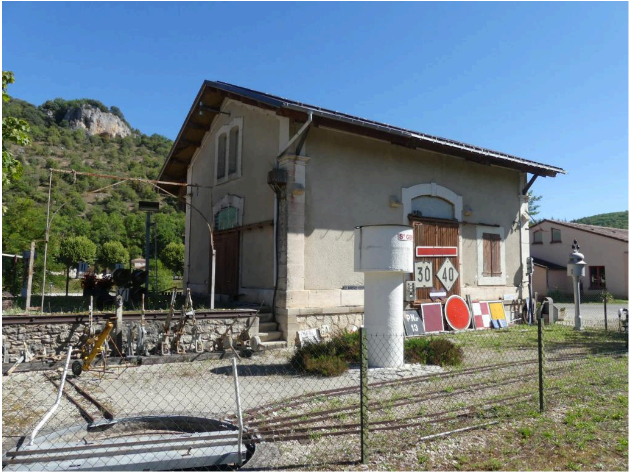
Halles à marchandises, vue depuis le sud.