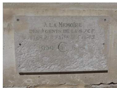
Plaque commémorative fixée sur le mur-pignon ouest.