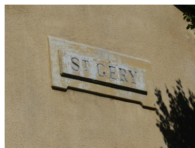
Bâtiment des voyageurs, élévation est : cartouche portant le nom de la station.