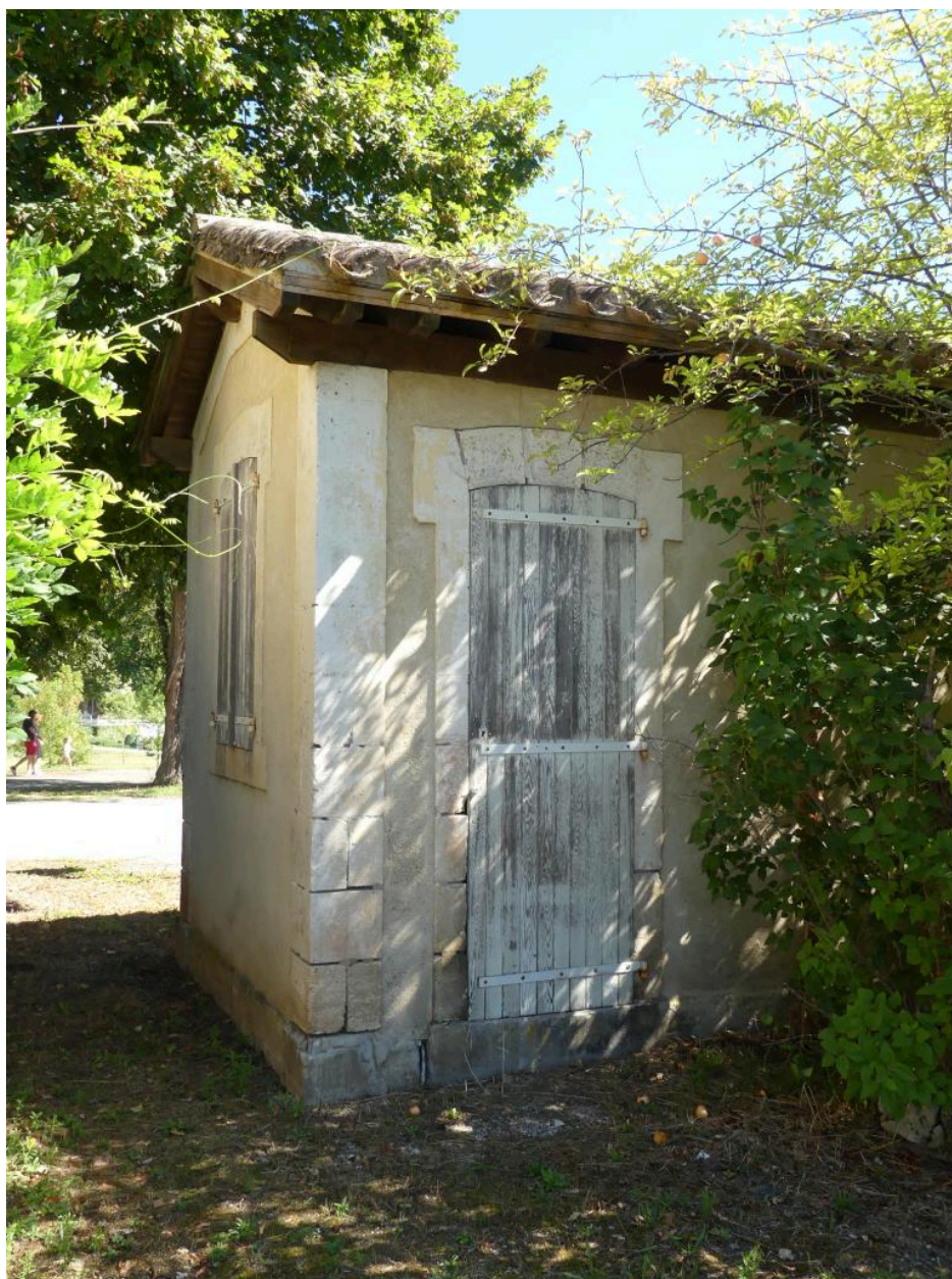
Toilettes et lampisterie.