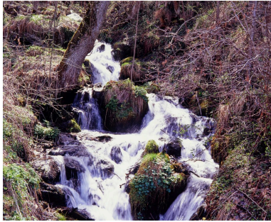
Paysage pyrénéen avec torrent (ruisseau d'Aube).