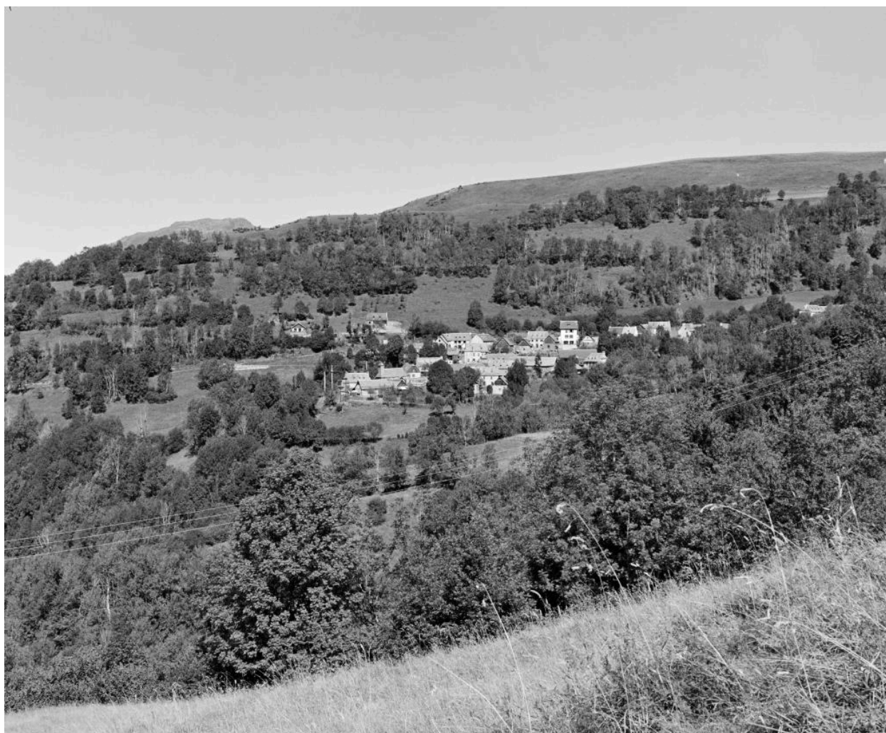
Paysage avec, au loin, le village de Germ sur un versant de la vallée du Louron.