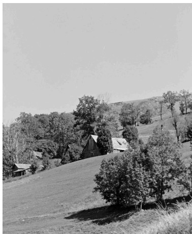
Paysage avec granges foraines à Bédérèdes.