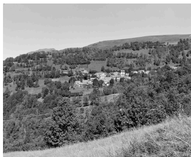
Paysage avec, au loin, le village de Germ sur un versant de la vallée du Louron.