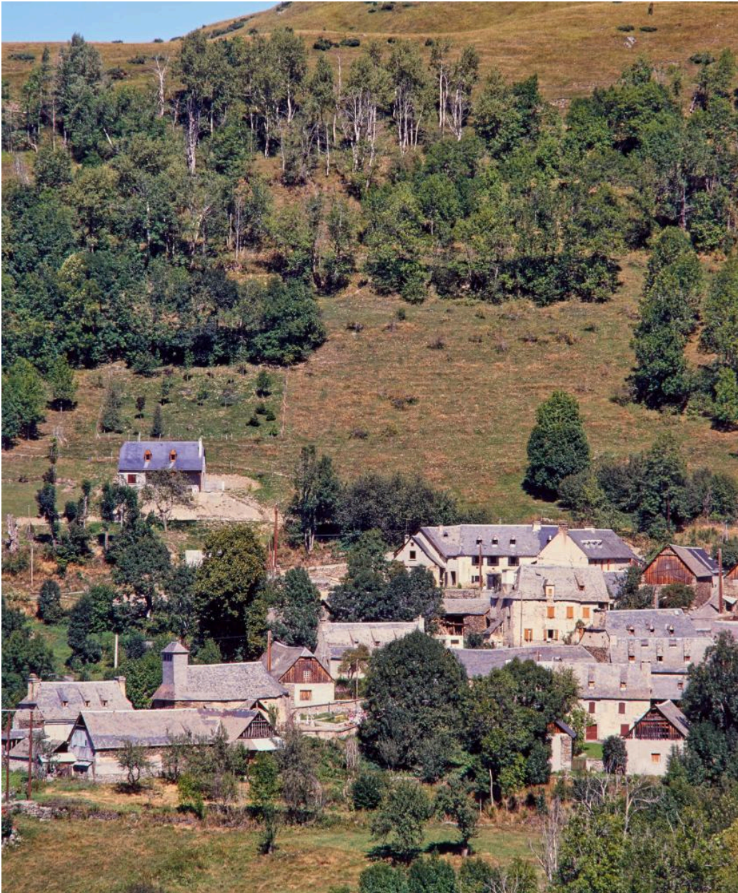
Paysage avec, au 1er plan, une partie (ouest) du village de Germ sur un versant de la vallée du Louron.