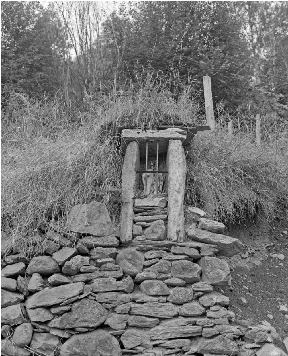
Oratoire en bordure de chemin.