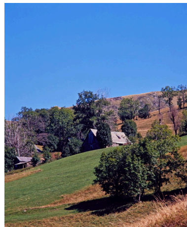
Paysage avec granges foraines à Bédérèdes.