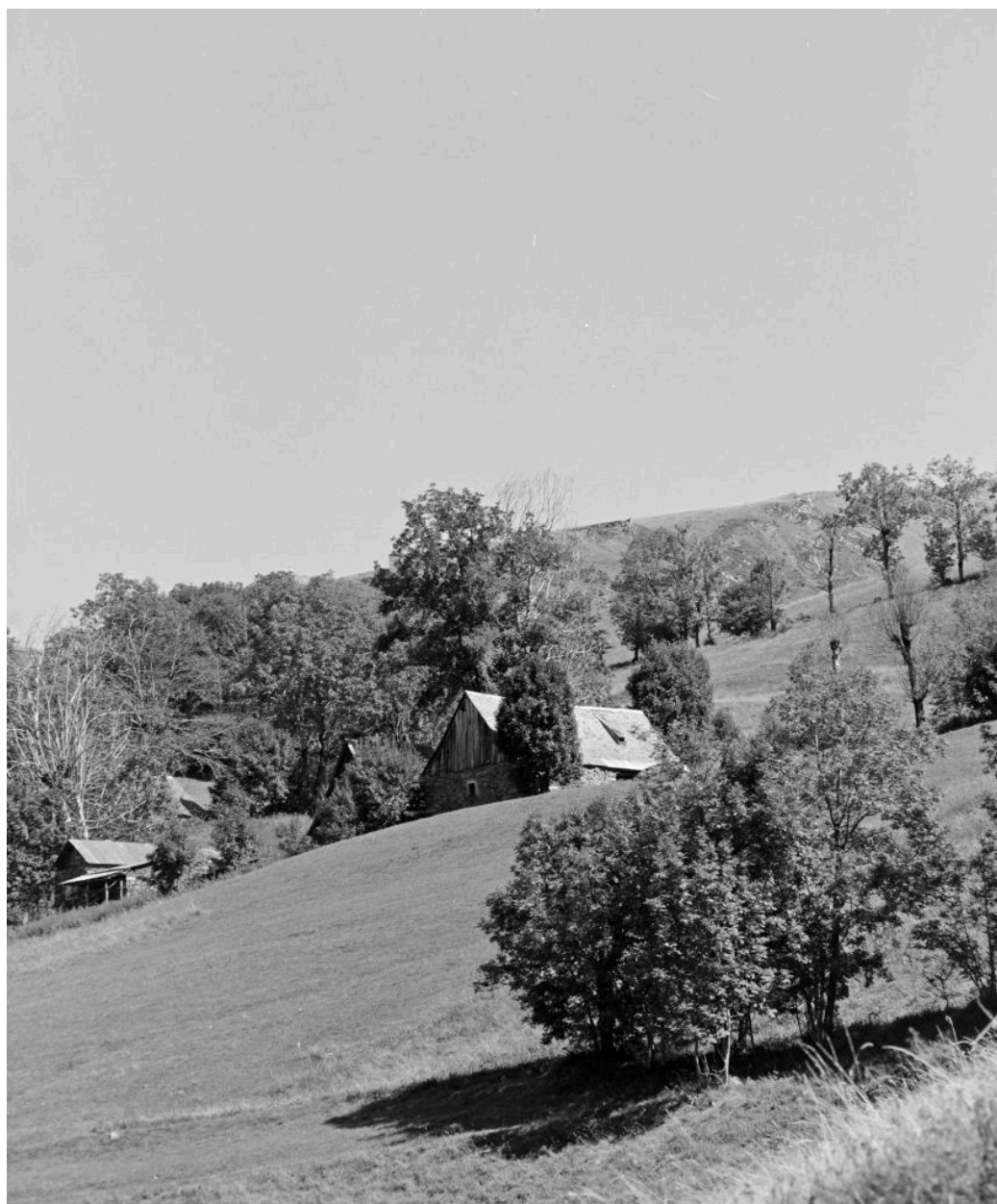
Paysage avec granges foraines à Bédérès.