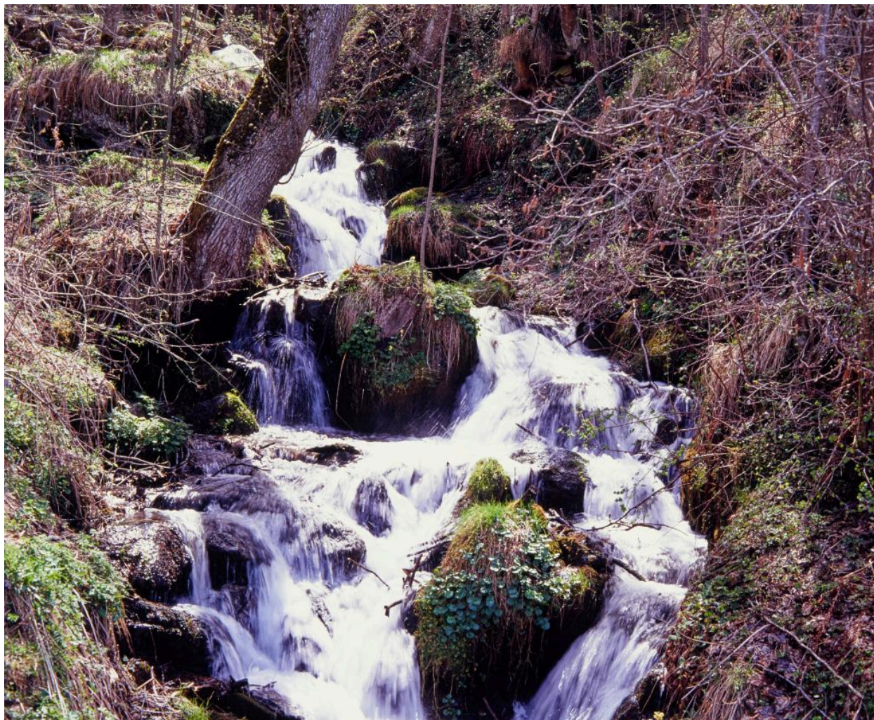
Paysage pyrénéen avec torrent (ruisseau d'Aube).