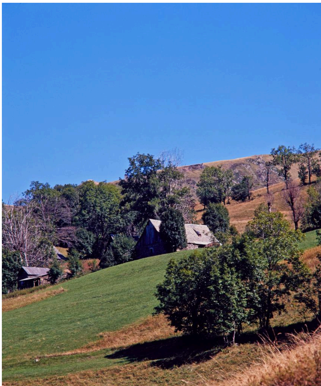
Paysage avec granges foraines à Bédérèdes.