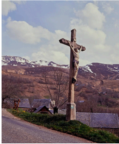
Croix de chemin à l'entrée du village.

Phot. Christian Soula IVR73_19916500319XA