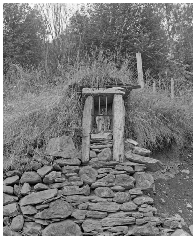
Oratoire en bordure de chemin. IVR73_19916500290X