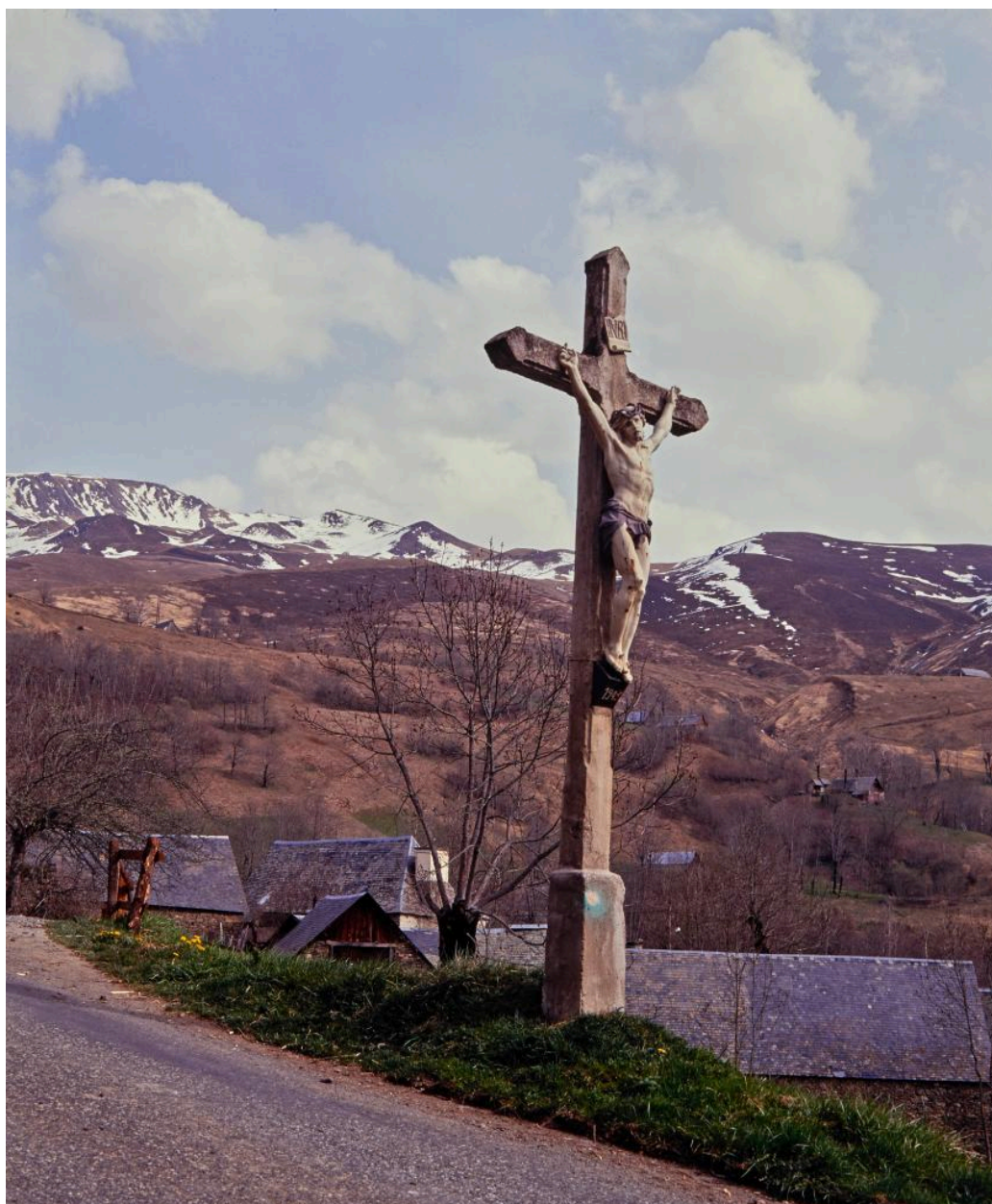
Croix de chemin à l'entrée du village.