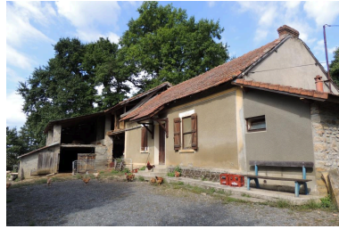
Vue de la ferme depuis le sud-est.