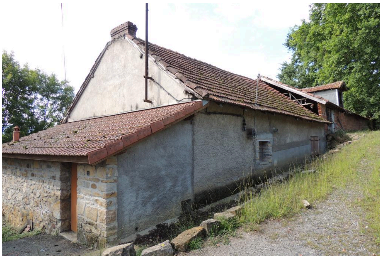
Vue de la ferme depuis le nord-est.