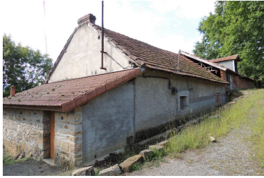
Vue de la ferme depuis le nord-est.