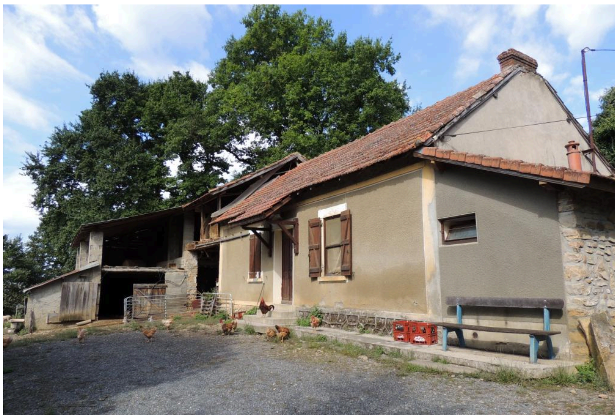
Vue de la ferme depuis le sud-est.