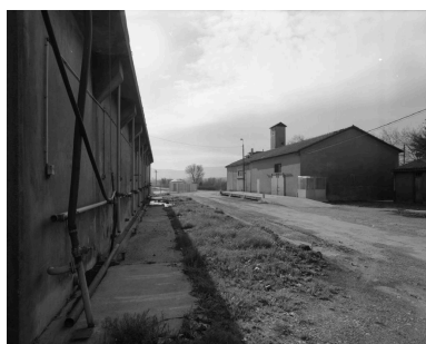
Détail du bâtiment de production avec la tour de la colonne de distillation.