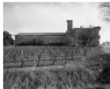
Elévation latérale depuis l'ouest. IVR91_19971100014X