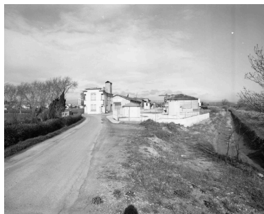
Entrée de la distillerie coopérative.