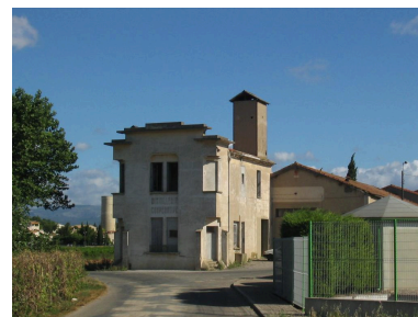
Vue de l'élévation de la distillerie portant inscription.