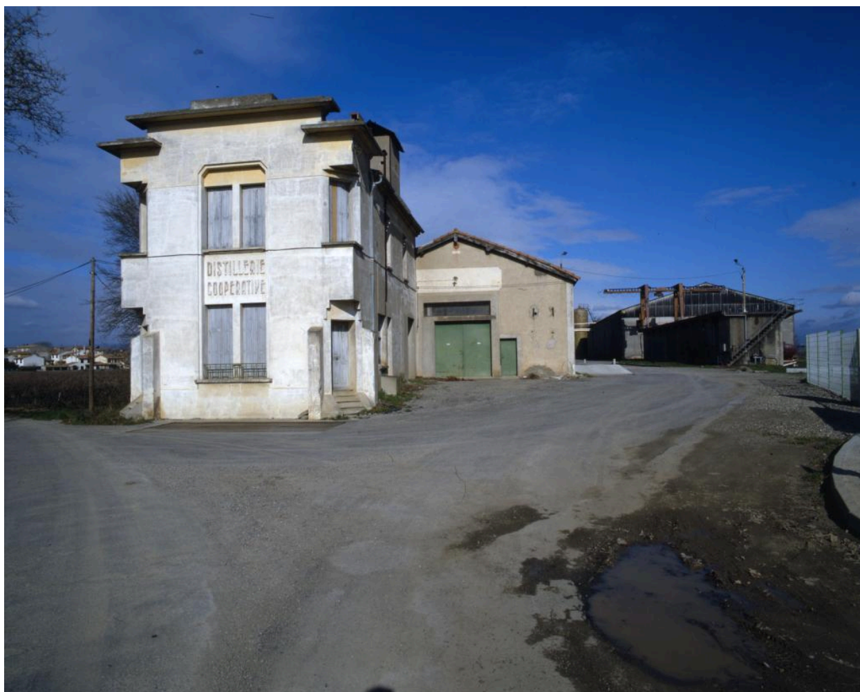
Vue rapprochée de l'élévation sud.