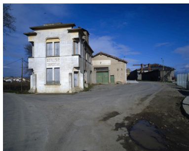
Vue rapprochée de l'élévation sud. IVR91_19971100012XA