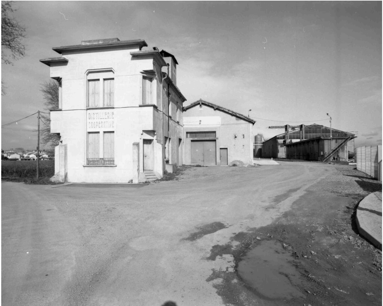
Vue rapprochée de l'élévation sud.