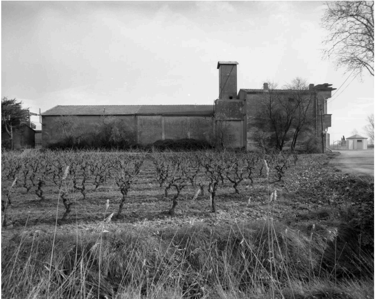
Elévation latérale depuis l'ouest.