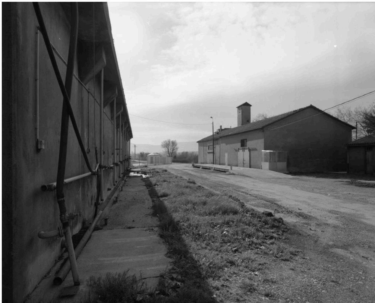
Détail du bâtiment de production avec la tour de la colonne de distillation.