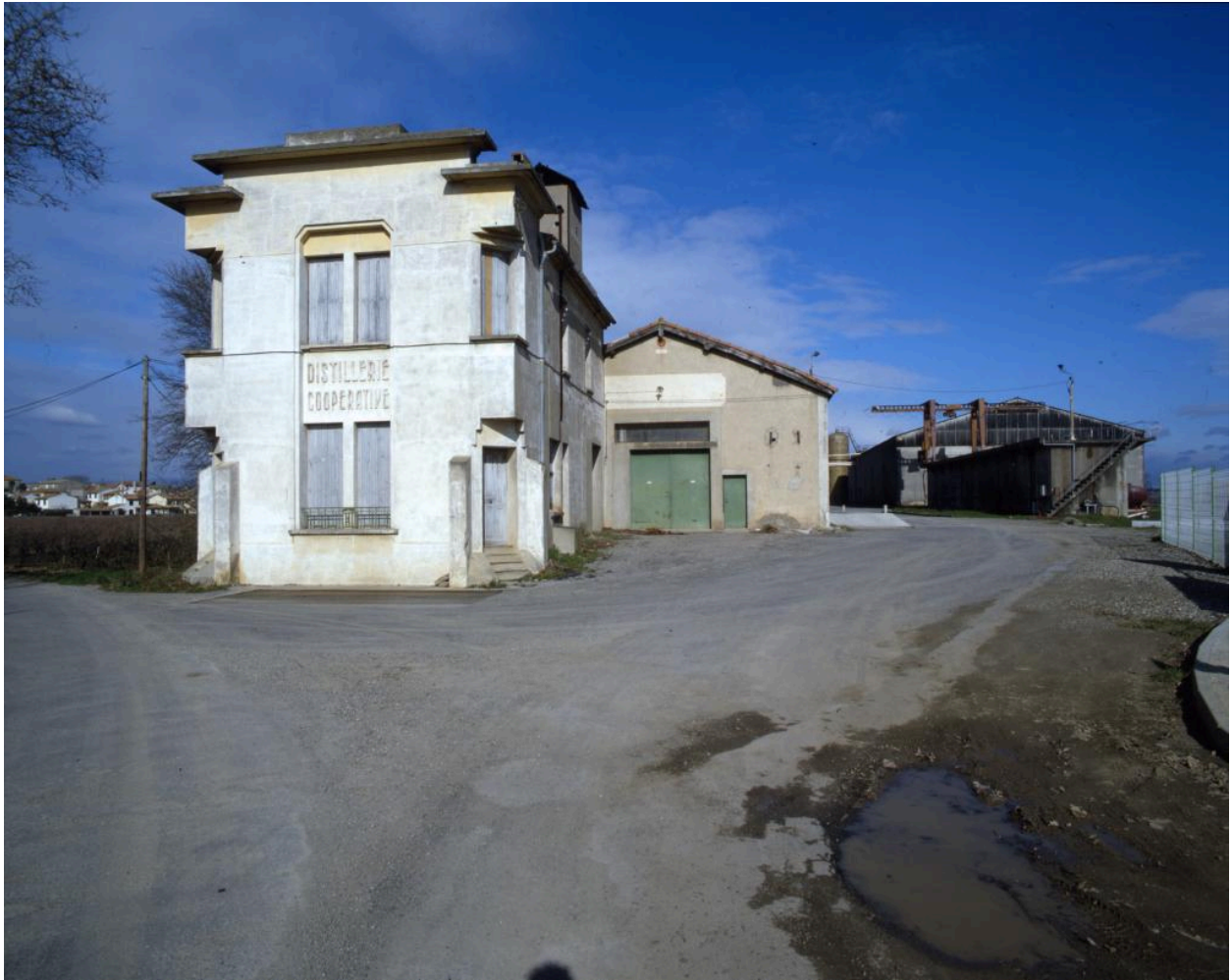
Vue rapprochée de l'élévation sud.