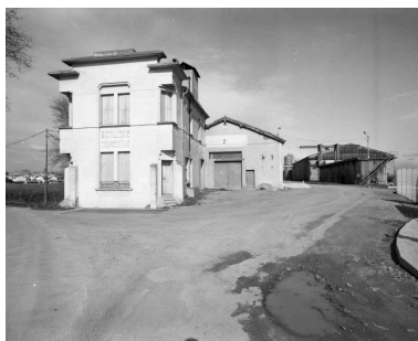
Vue rapprochée de l'élévation sud.

Cuves de diffusion en béton