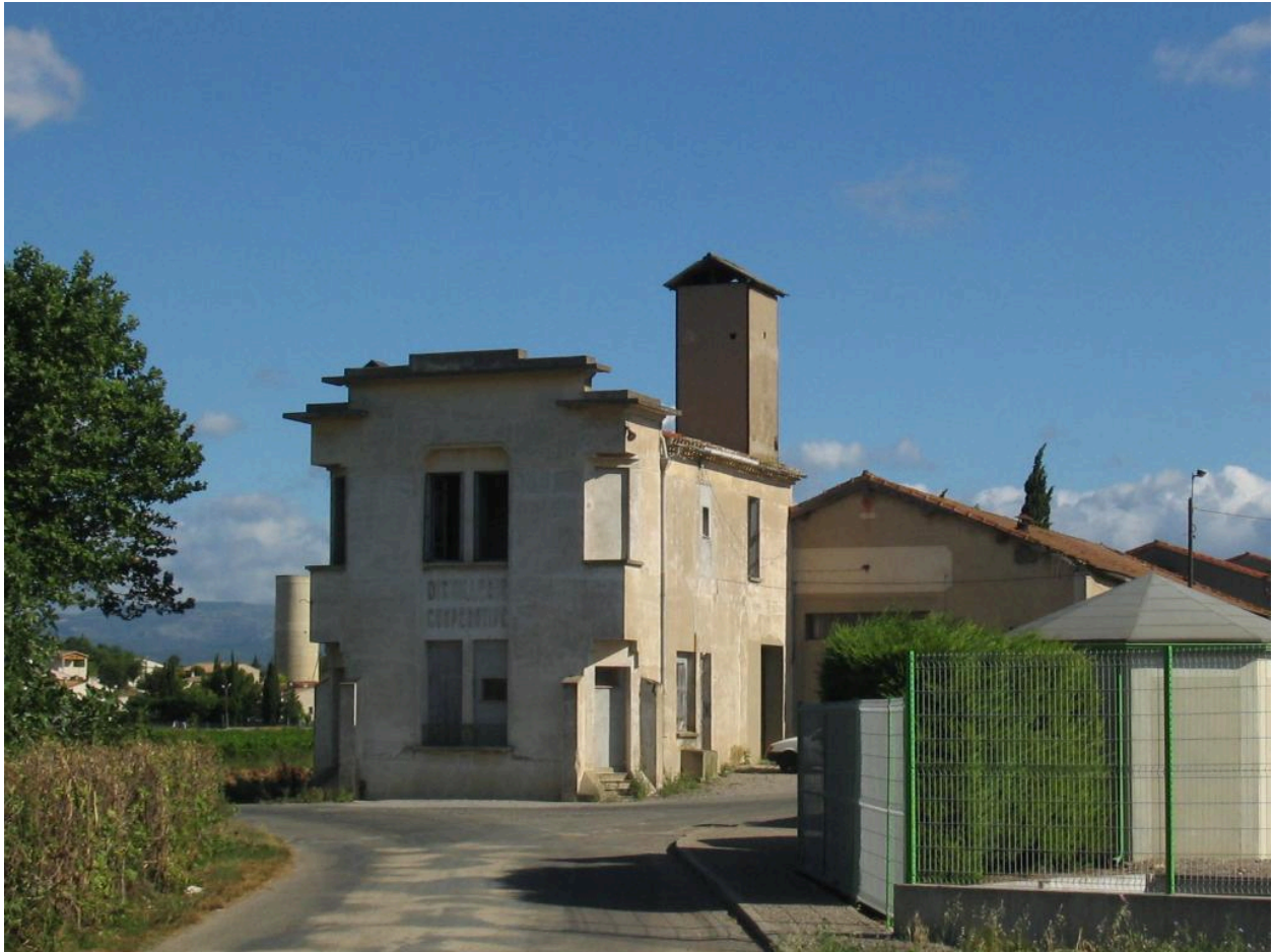
Vue de l'élévation de la distillerie portant inscription.