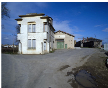
Vue rapprochée de l'élévation sud. IVR91_19971100013XA