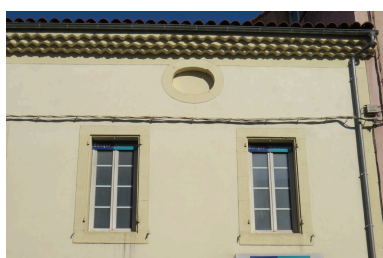
Elévation sud-est, donnant sur rue, détail. IVC09160_20180901040NUCA