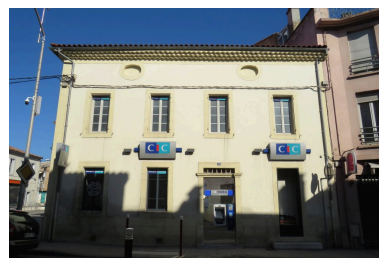
Elévation sud-est, donnant sur rue. IVC09160_20180901039NUCA