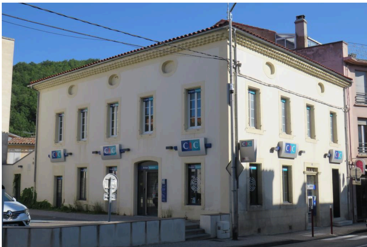
Elévations sud-ouest et sud-est, donnant sur rue.