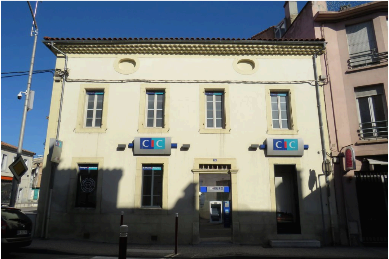
Elévation sud-est, donnant sur rue.