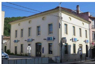
Elévations sud-ouest et sud-est, donnant sur rue. IVC09160_20180901041NUCA