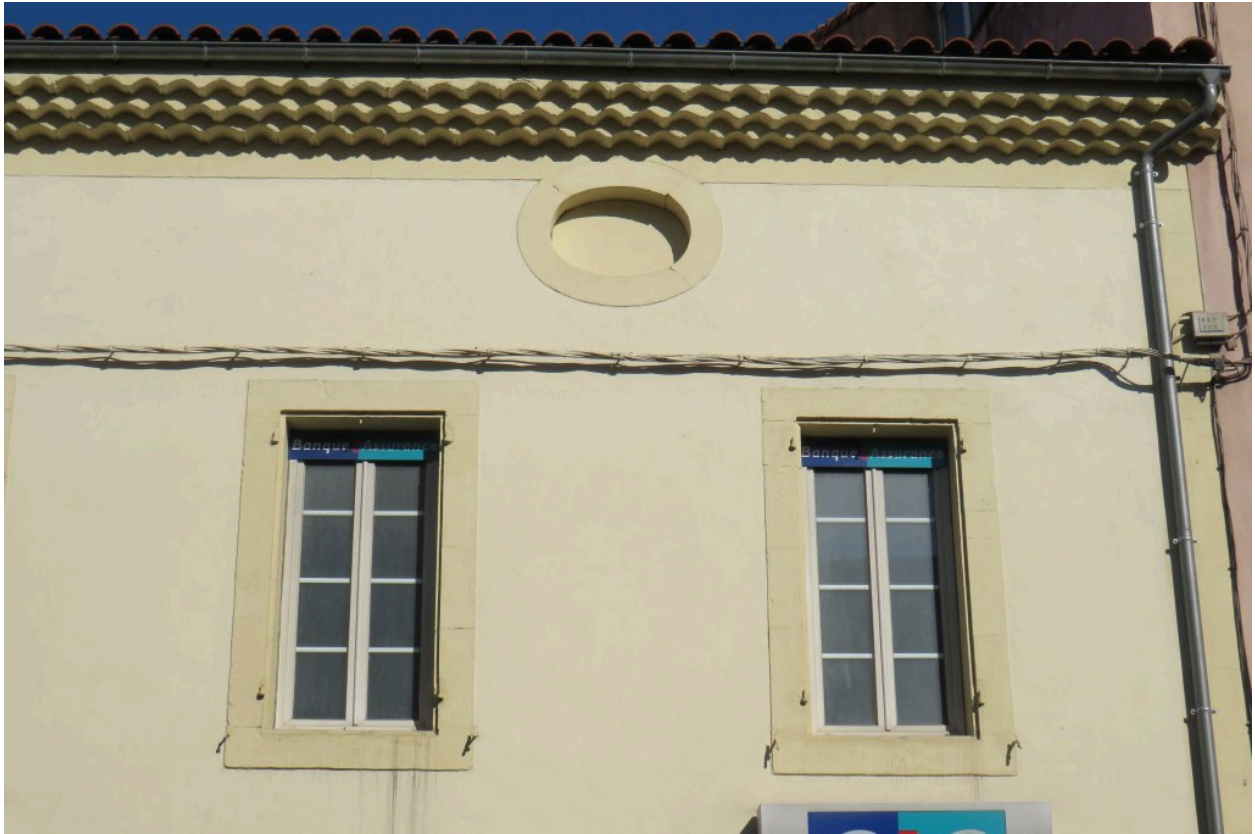
Elévation sud-est, donnant sur rue, détail.