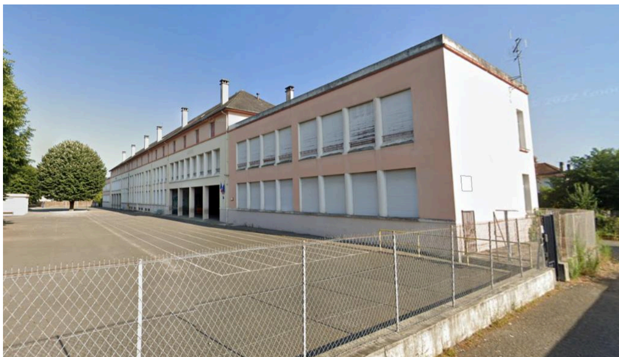
Vue de l'établissement depuis le nord-est.