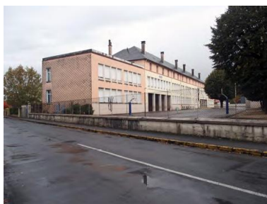
Vue de l'établissement depuis le sud-ouest.

Localisation de la parcelle sur le cadastre 2014.