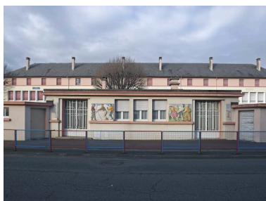
Vue d'ensemble depuis la rue. IVR73_20146501037NUCA

Vue d'ensemble de la cour IVR73_20146501039NUCA