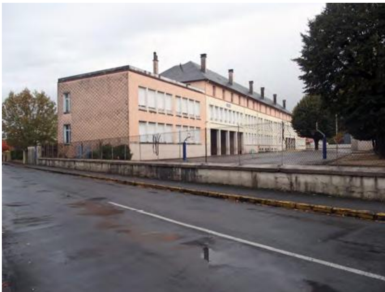
Vue de l'établissement depuis le sud-ouest.