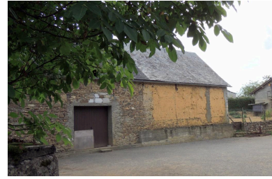
Vue de l'élévation ouest.