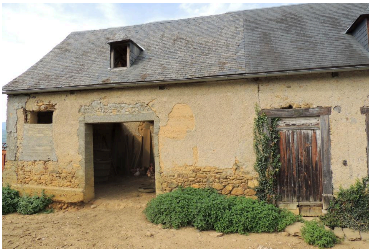
Vue de la remise.