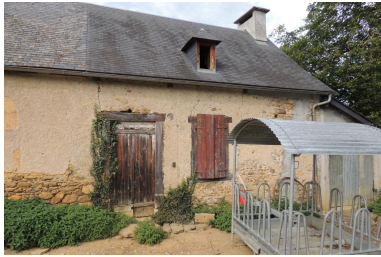
Vue de la partie de la construction dédiée à l'habitation depuis l'est. IVD65_20146500547NUCA