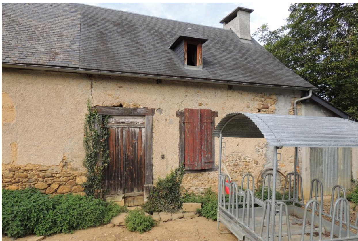
Vue de la partie de la construction dédiée à l'habitation depuis l'est.