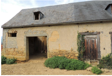
Vue de la remise. IVD65_20146500548NUCA