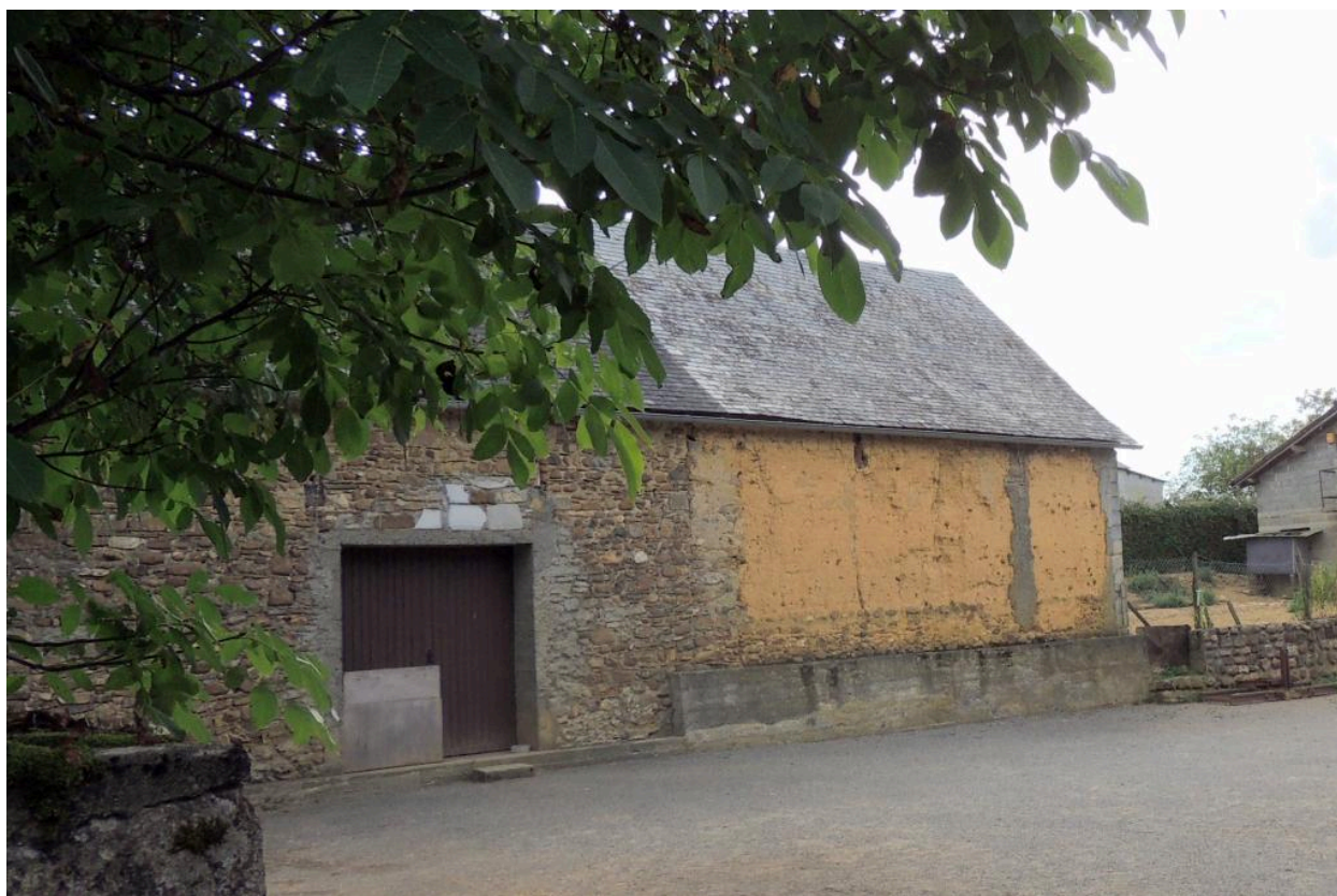
Vue de l'élévation ouest.