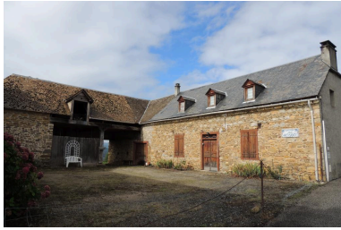
Vue depuis le sud-est. IVD65_20146500630NUCA