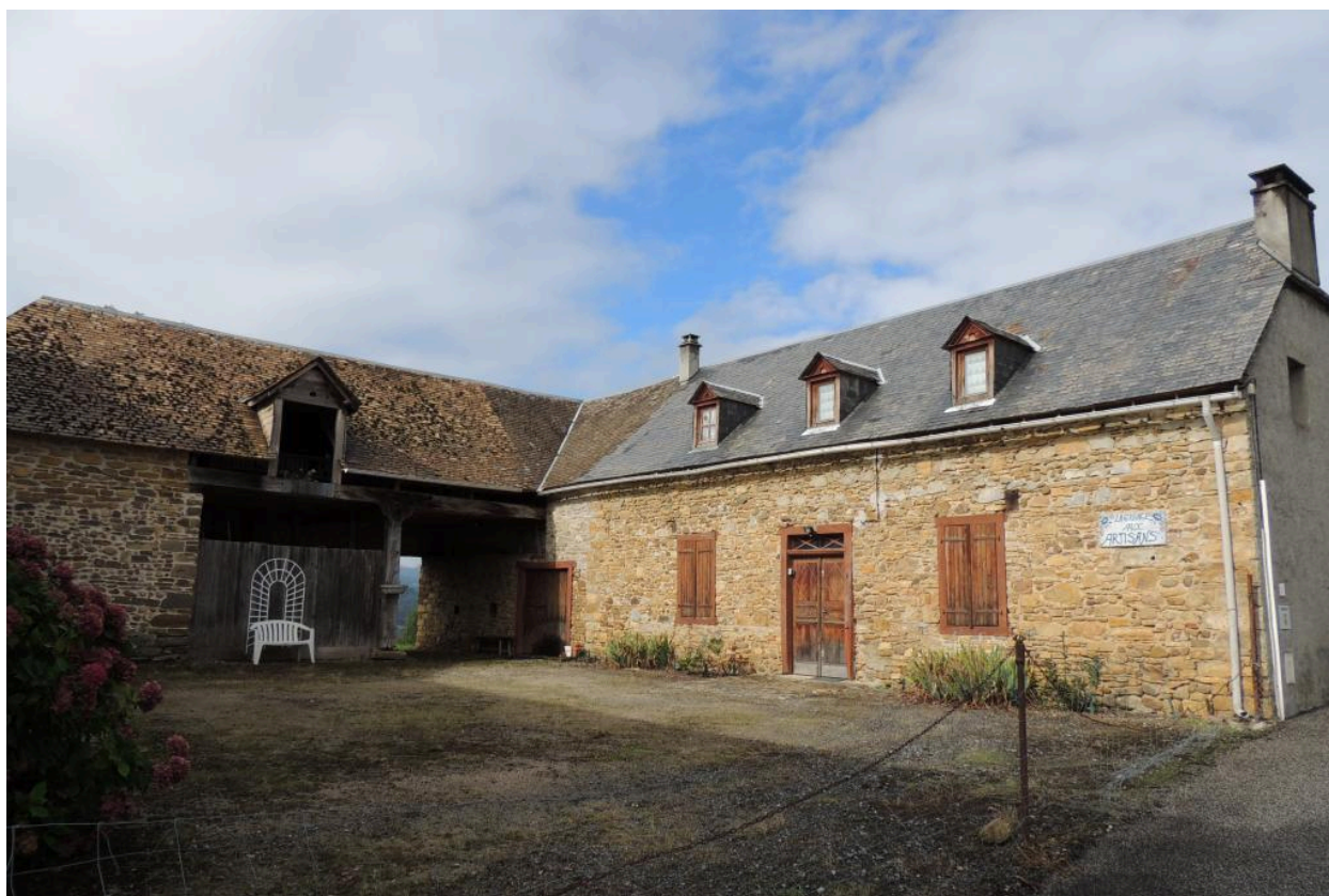
Vue depuis le sud-est.