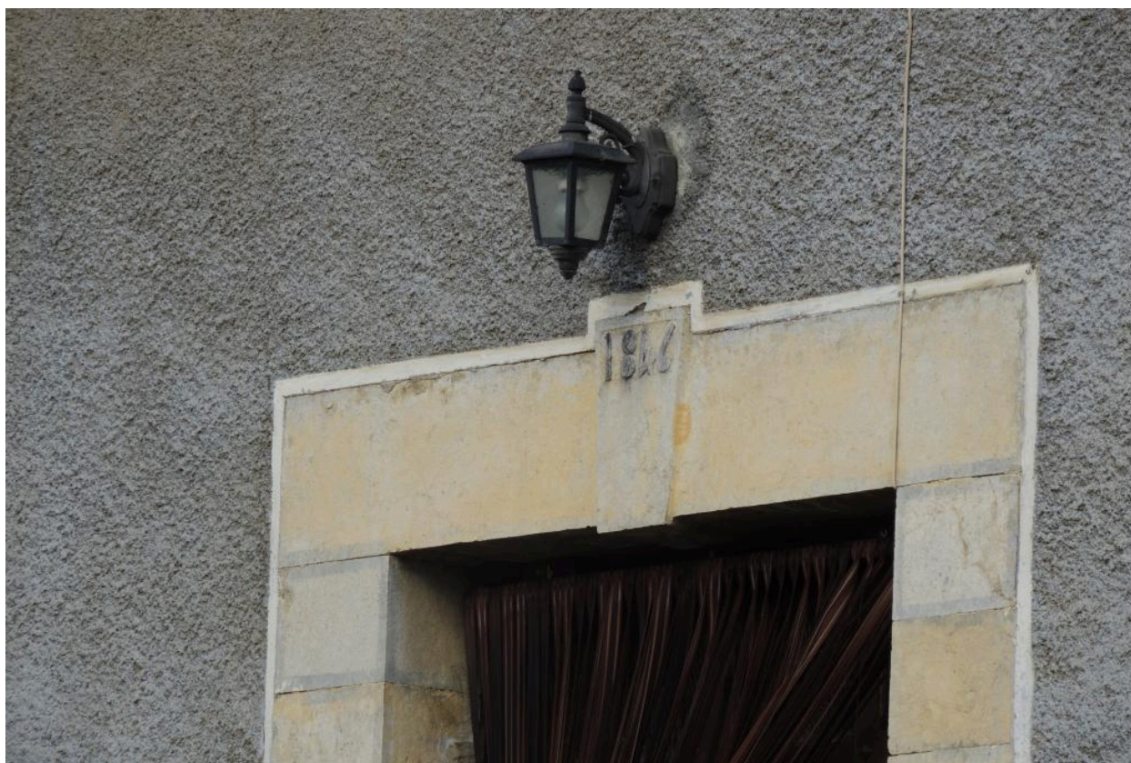
Détail du linteau daté (1846).