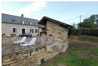
Vue du puits et de l'abreuvoir.