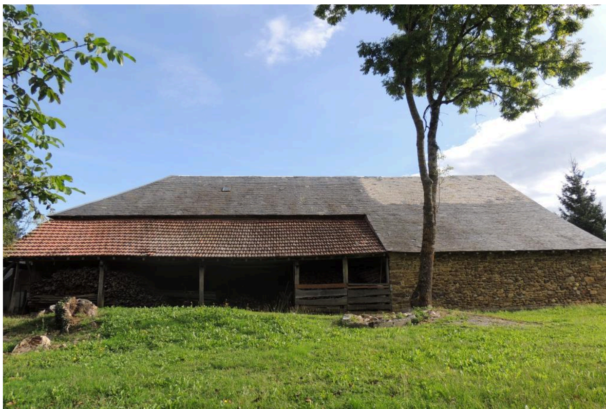
Vue de l'élévation nord des dépendances.