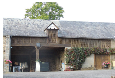
Vue des dépendances depuis le nord.