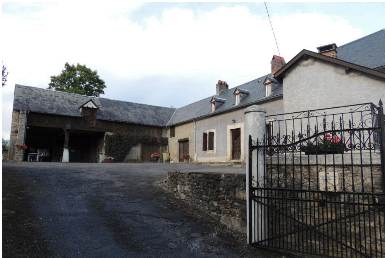
Vue de la ferme depuis le nord.