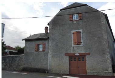
Vue de l'élévation nord de la ferme. IVD65_20146500505NUCA