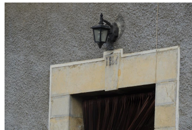
Détail du linteau daté (1846).