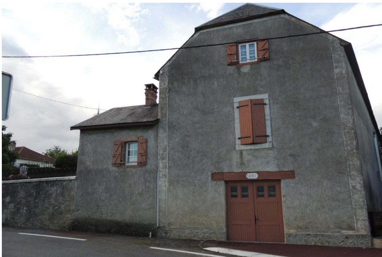
Vue de l'élévation nord de la ferme.