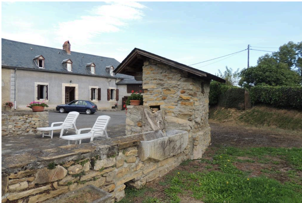
Vue du puits et de l'abreuvoir.