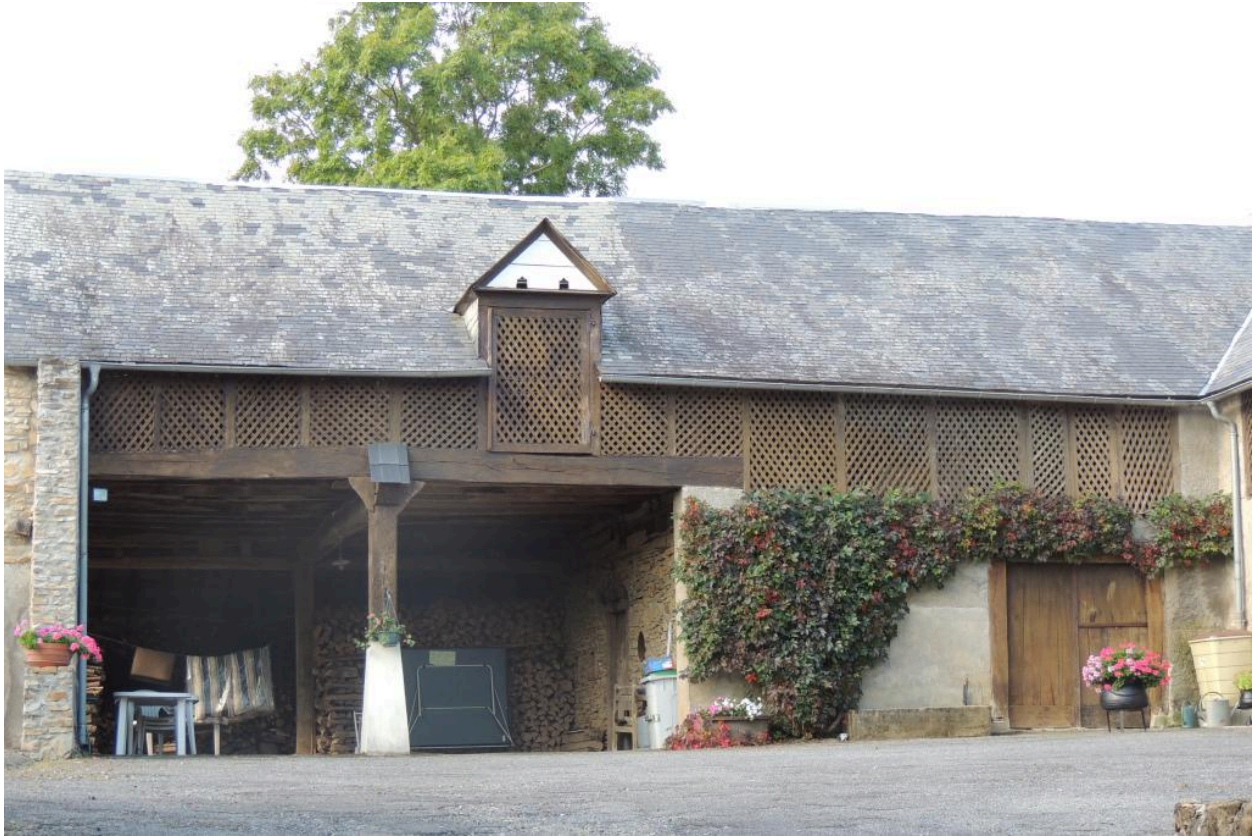
Vue des dépendances depuis le nord.