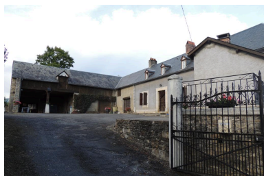
Vue de la ferme depuis le nord. IVD65_20146500506NUCA