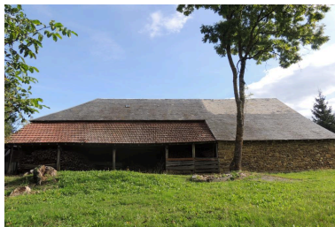
Vue de l'élévation nord des dépendances. IVD65_20146500510NUCA