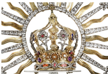
Couronne de Notre-Dame des Victoires, avers, détail