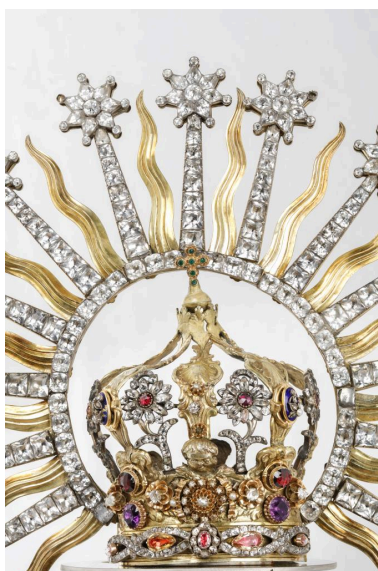
Couronne de Notre-Dame des Victoires, avers, détail IVR76_20236651011NUCA