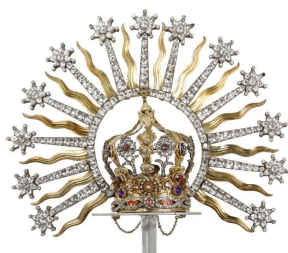
Couronne de Notre-Dame des Victoires, avers, vue d'ensemble. IVR76_20236651009NUCA