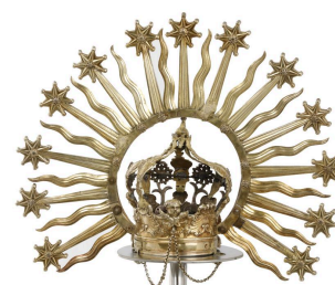
Couronne de Notre-Dame des Victoires, avers, vue d'ensemble. IVR76_20236651012NUCA