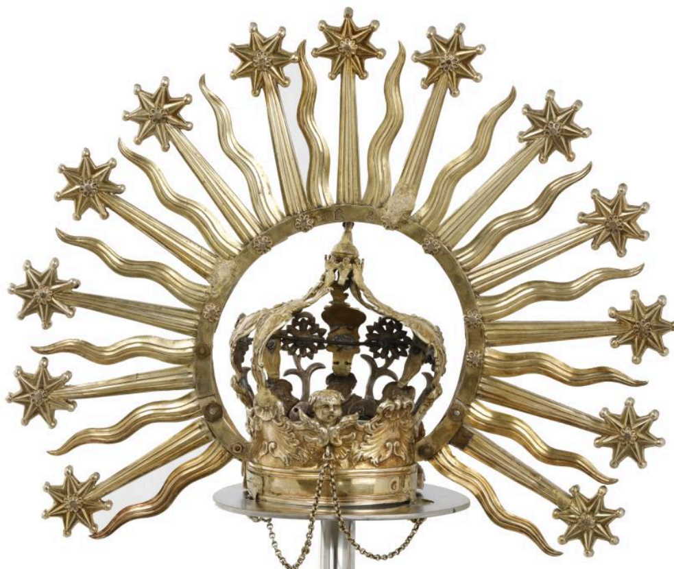
Couronne de Notre-Dame des Victoires, avers, vue d'ensemble.