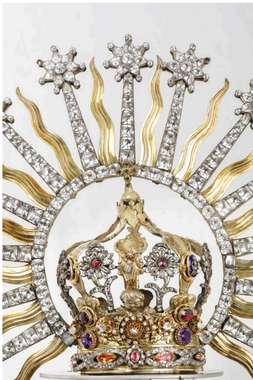
Couronne de Notre-Dame des Victoires, avers, détail