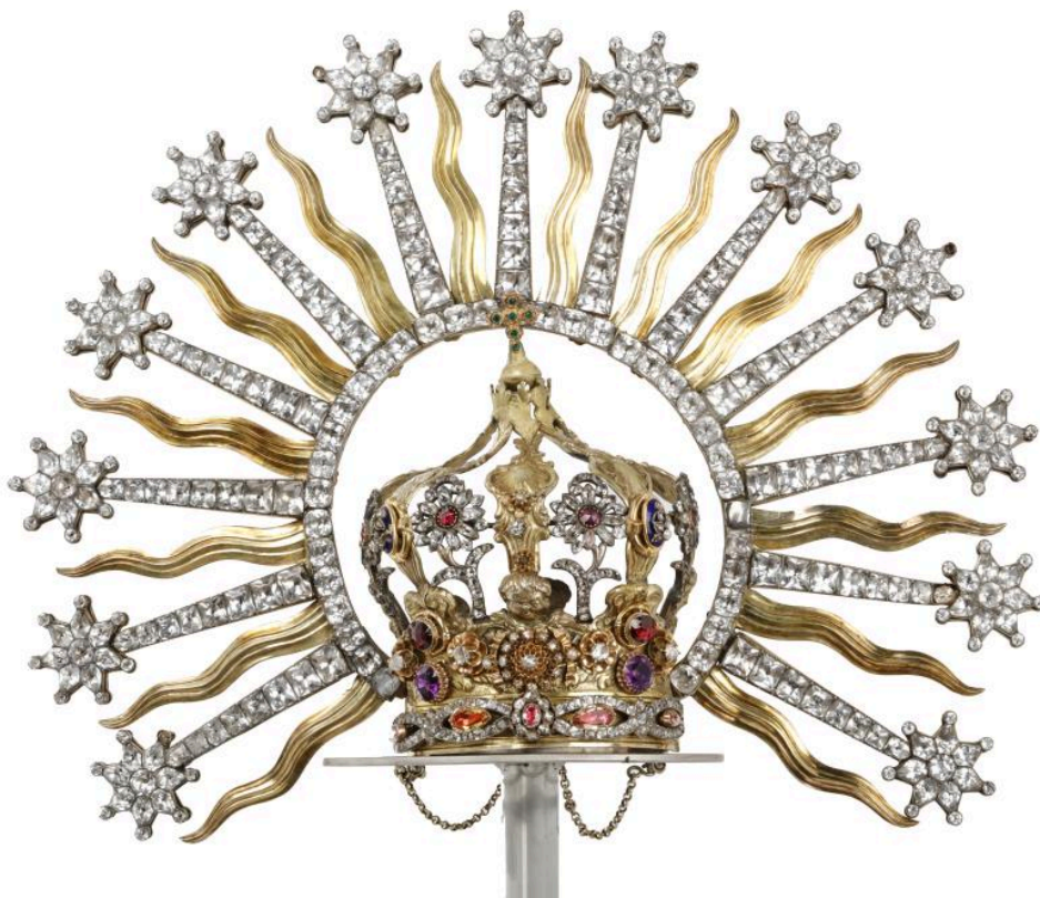
Couronne de Notre-Dame des Victoires, avers, vue d'ensemble.