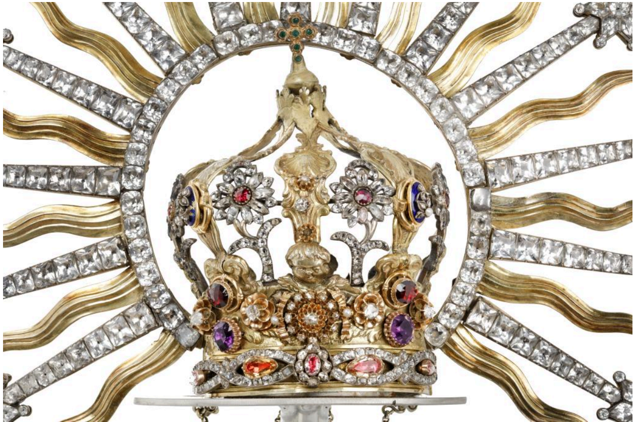
Couronne de Notre-Dame des Victoires, avers, détail