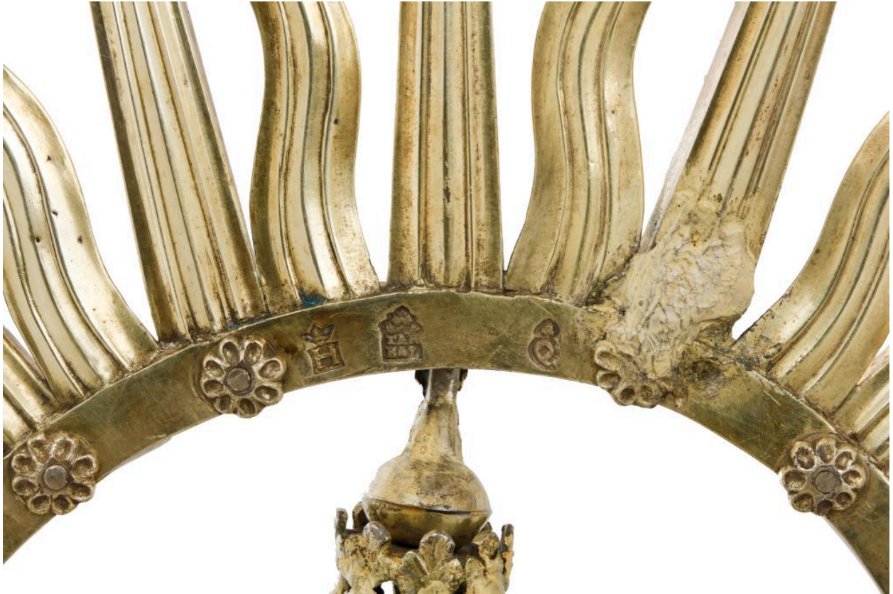
Couronne de Notre-Dame des Victoires, détail du revers.