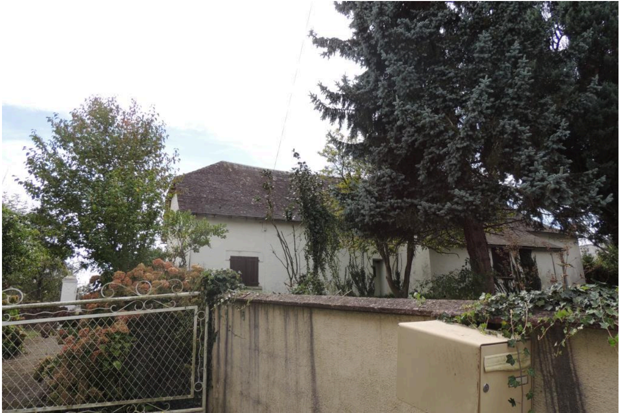
Vue de la maison depuis le nord.