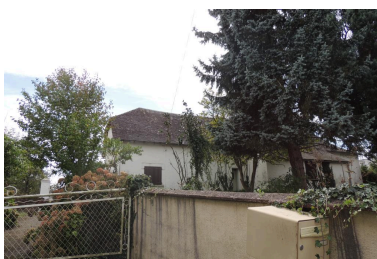
Vue de la maison depuis le nord.