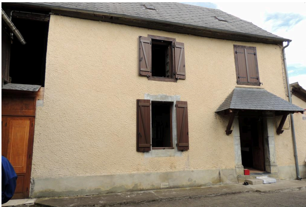
Vue de l'élévation principale de l'habitation depuis le sud.