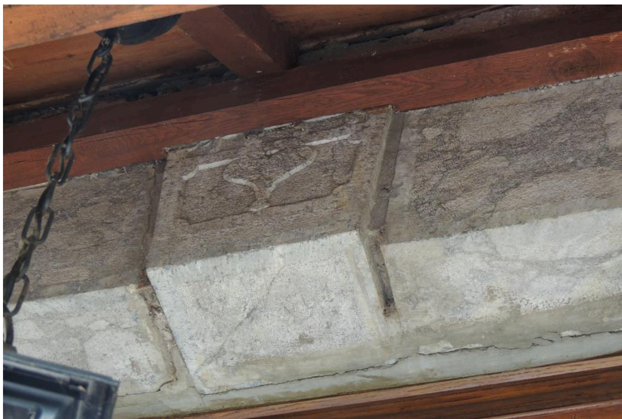
Détail du linteau de porte gravé (1858?), en partie occulté.