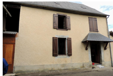
Vue de l'élévation principale de l'habitation depuis le sud. IVD65_20136500136NUCA