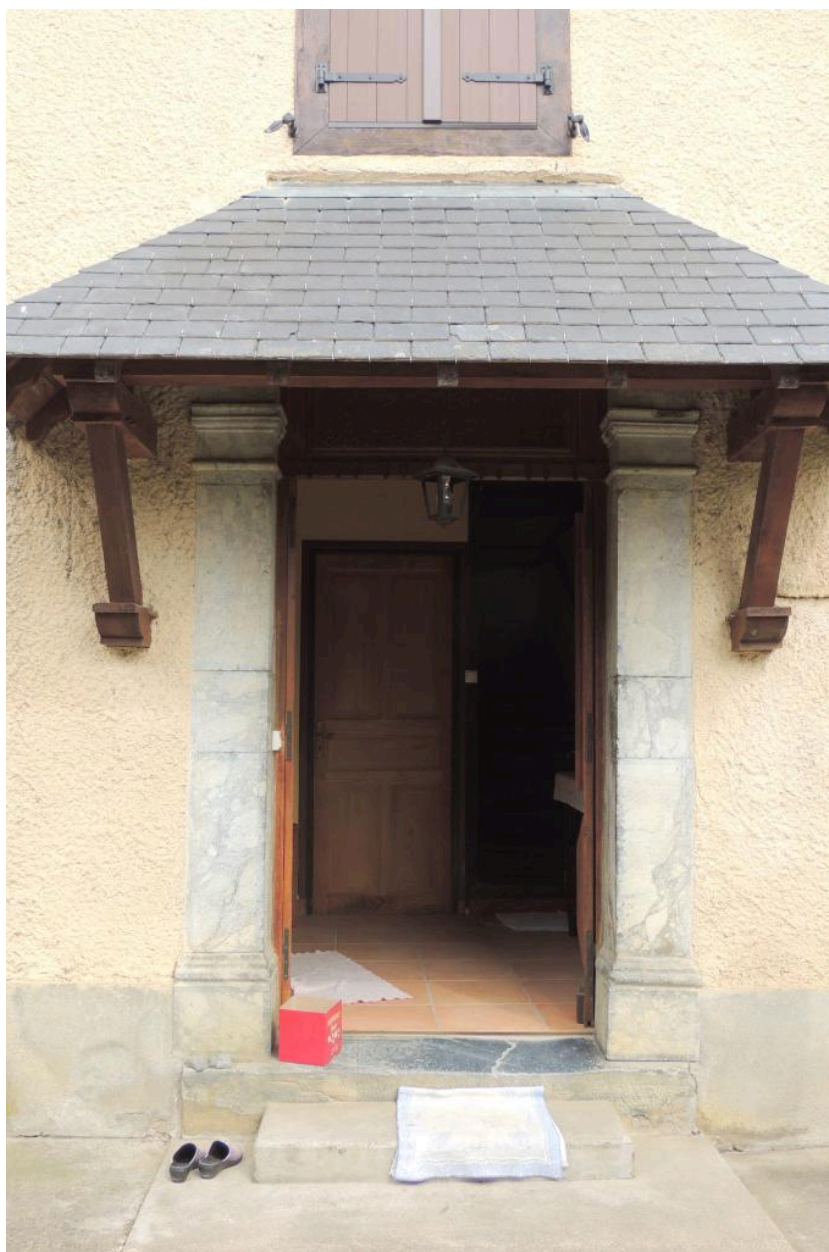
Porte d'entrée avec encadrement en pierre de taille.