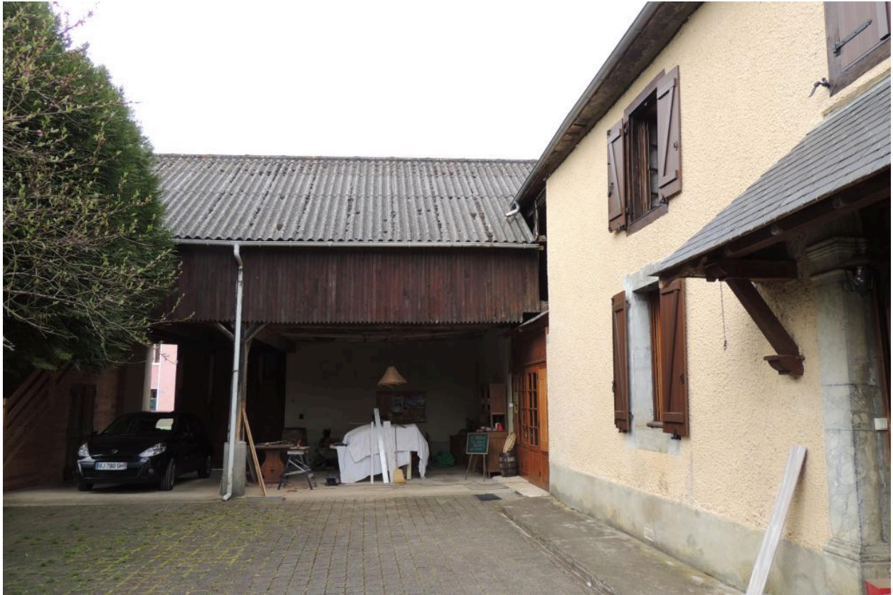
Vue des dépendances depuis l'est.