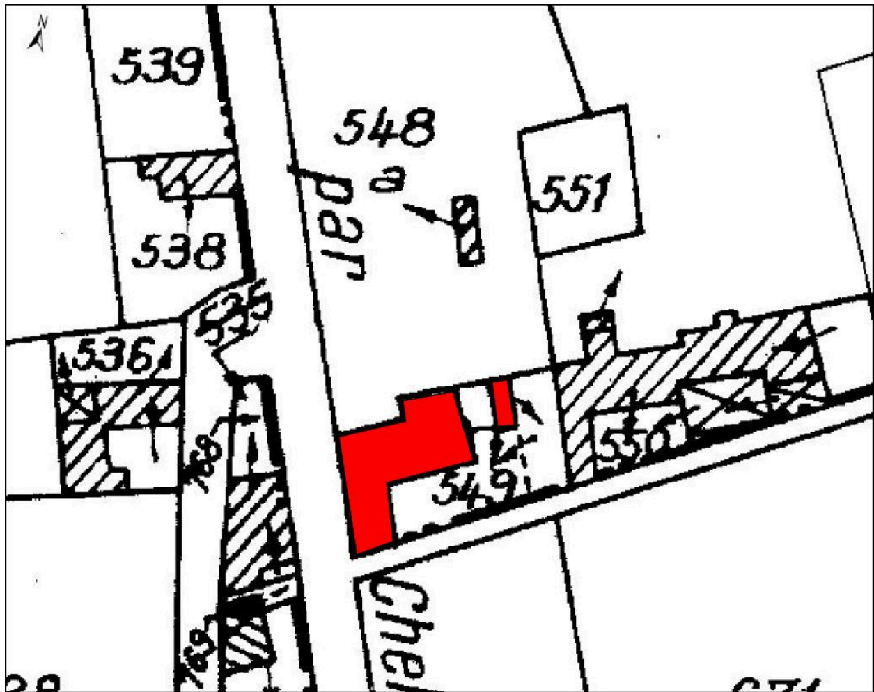
Plan de situation (cadastre 2011).