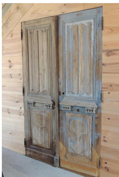
Porte d'origine déposée. IVD65_20136500140NUCA