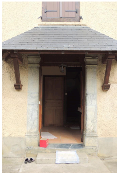
Porte d'entrée avec encadrement en pierre de taille.