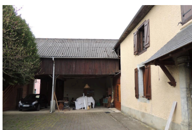
Vue des dépendances depuis l'est.