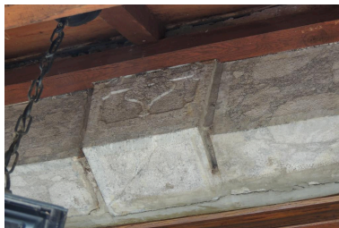
Détail du linteau de porte gravé (1858?), en partie occulté. IVD65_20136500138NUCA