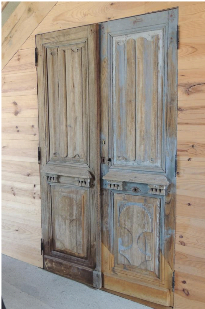
Porte d'origine déposée.