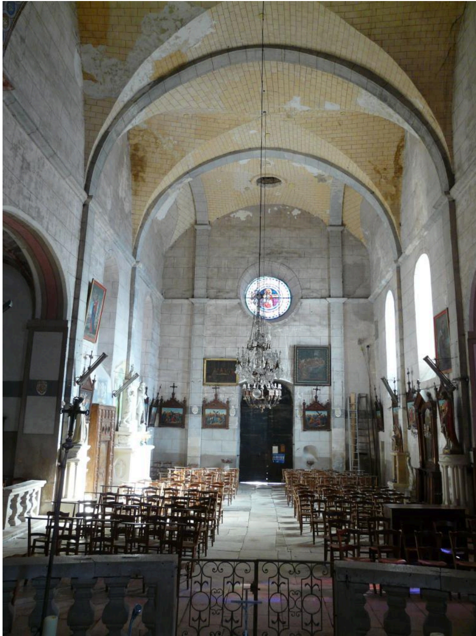
La nef vue depuis le choeur