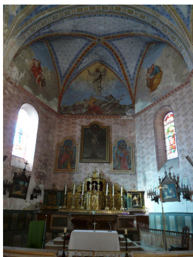
Le chœur IVD46_20104600196NUCA