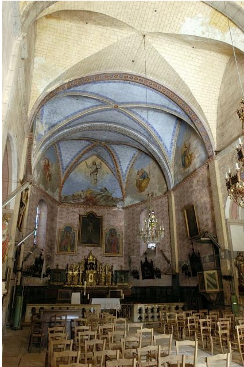
L'église Saint-Georges : vue intérieure