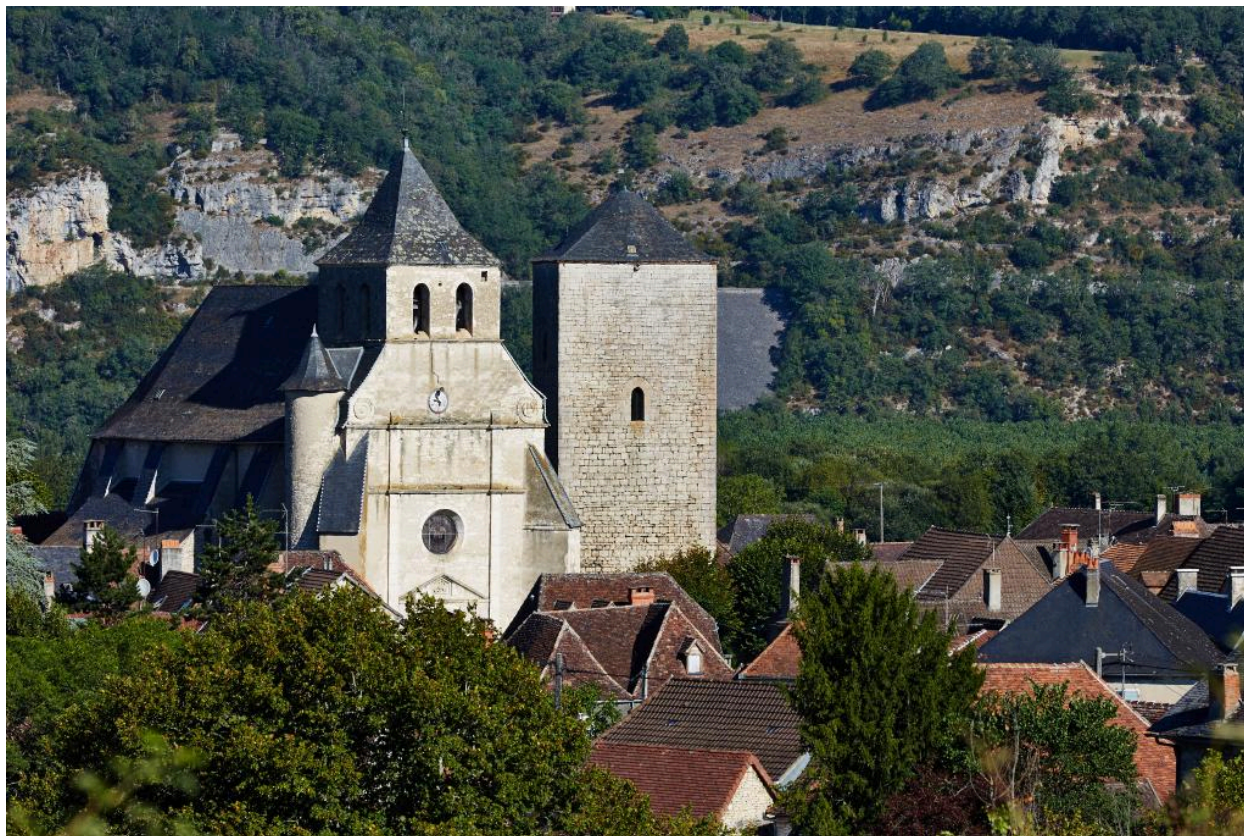
Vue générale de l'église et de la tour.