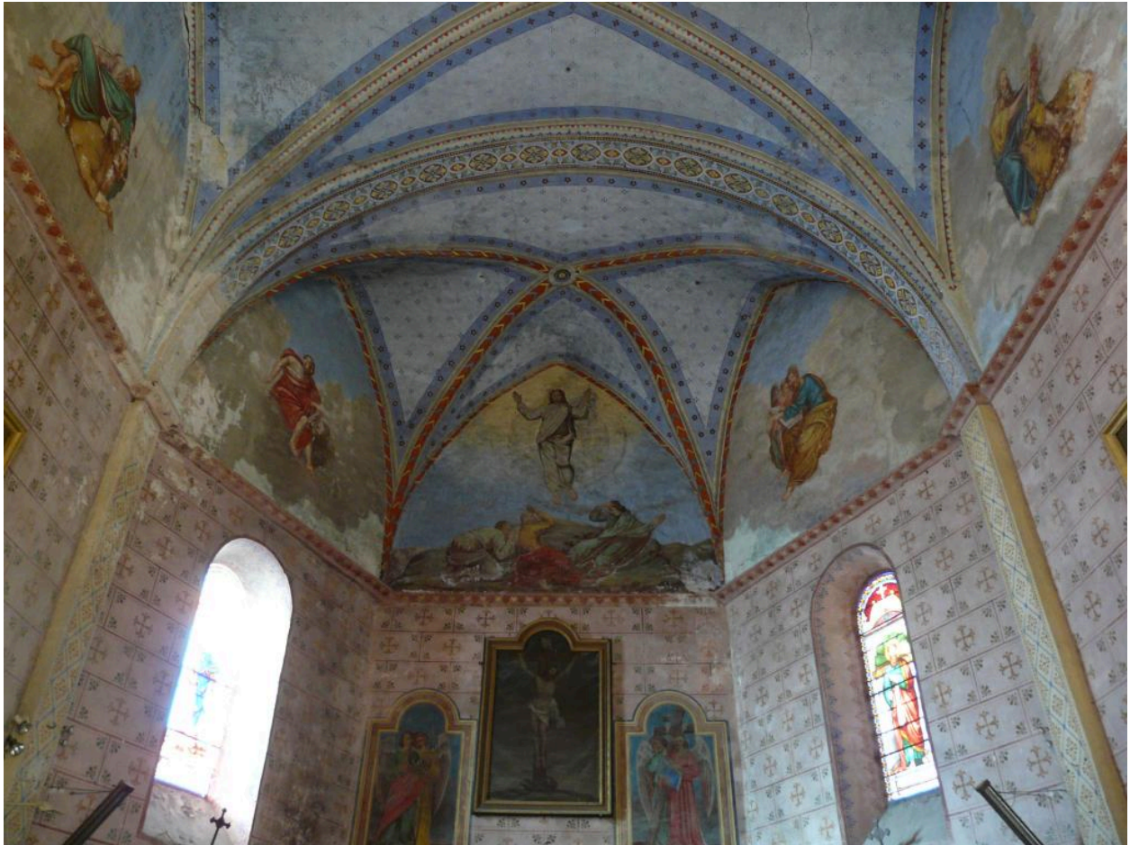
Les peintures murales du choeur