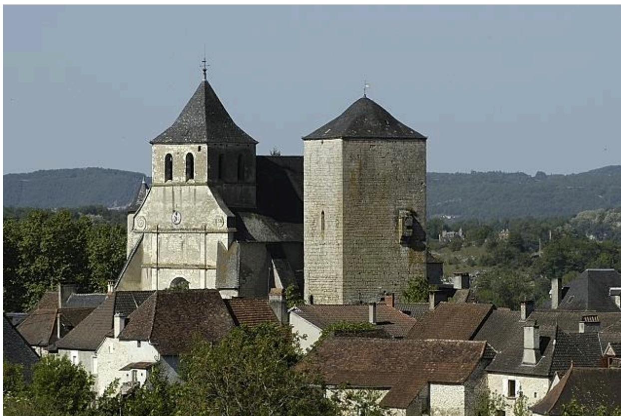
L'église Saint-Georges et la tour