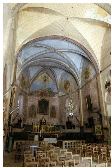
L'église Saint-Georges : vue intérieure IVD46_20044600575NUCA