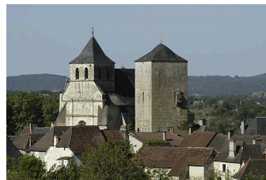
L'église Saint-Georges et la tour