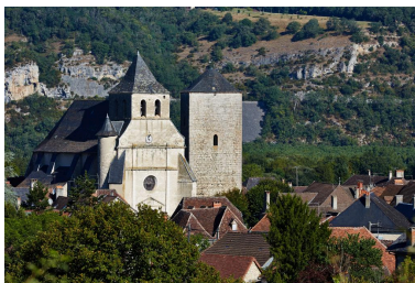
Vue générale de l'église et de la tour.