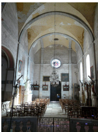
La nef vue depuis le chœur