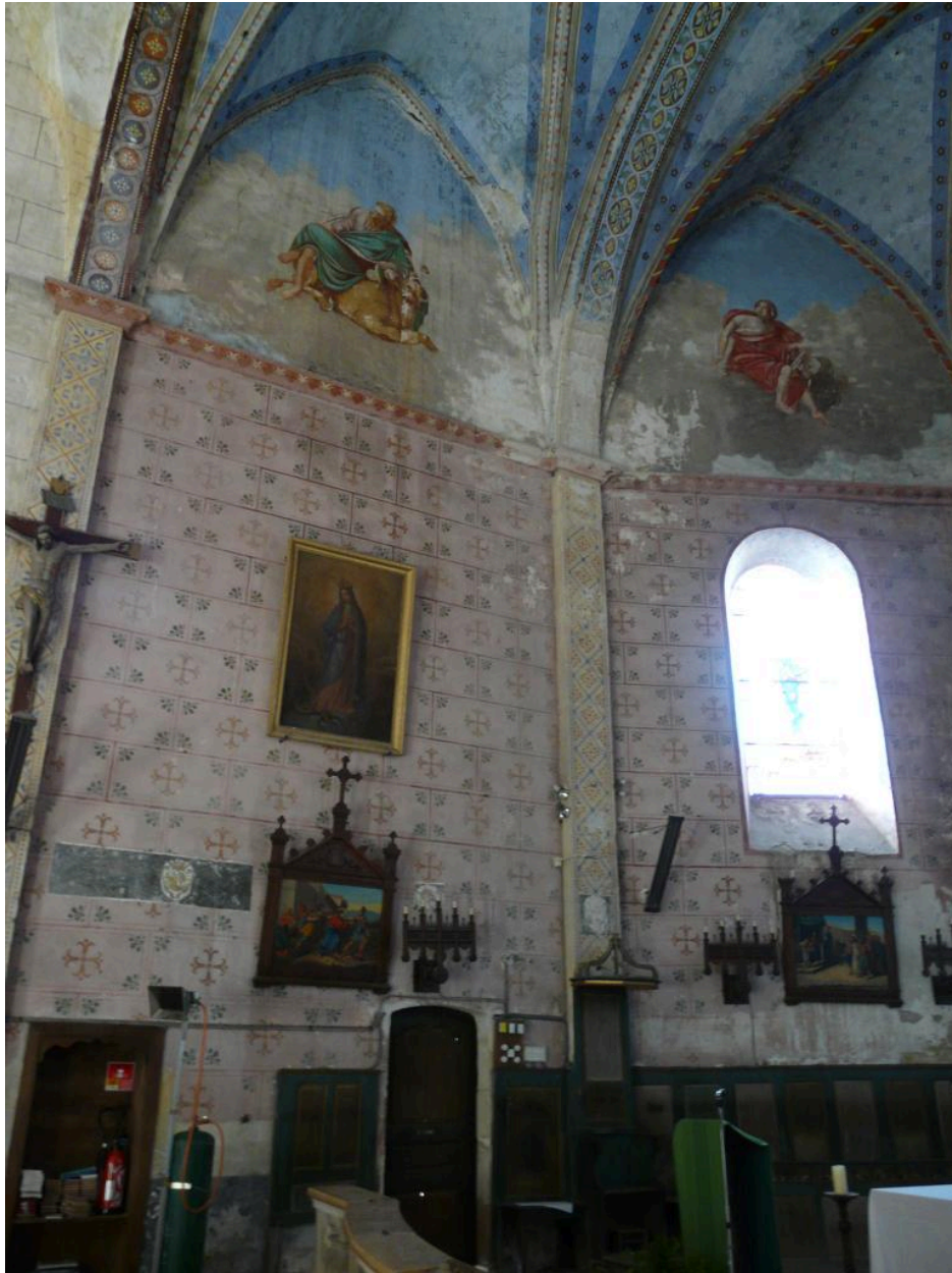
Côté gauche du chœur