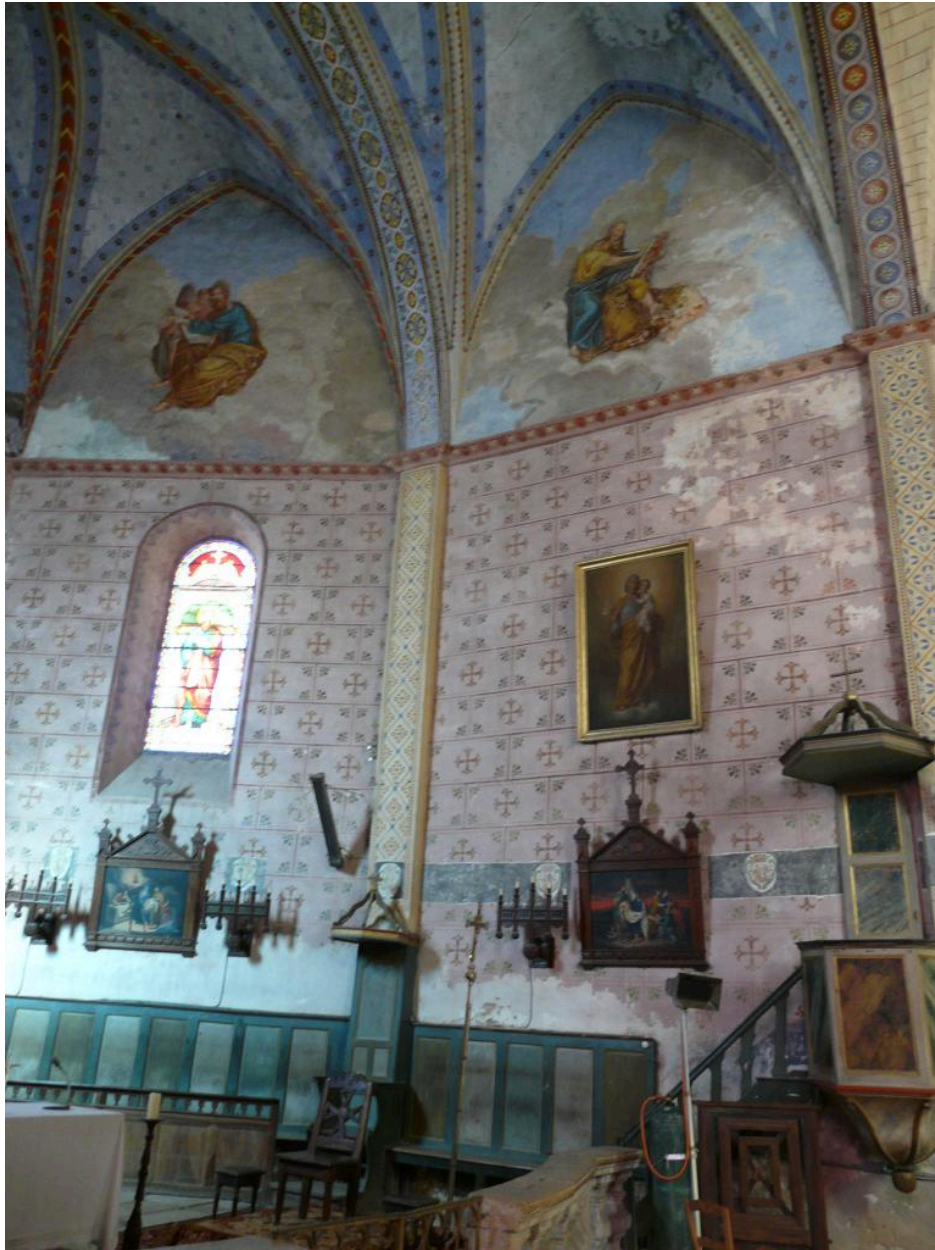
Côté droit du choeur