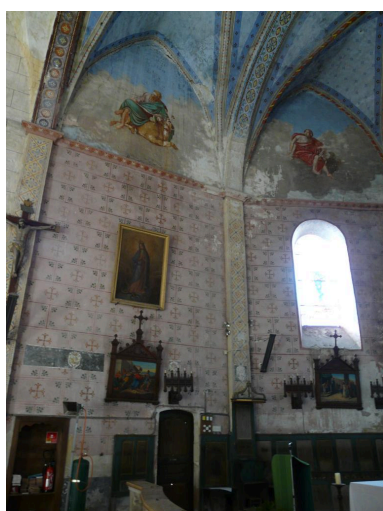
Côté gauche du chœur