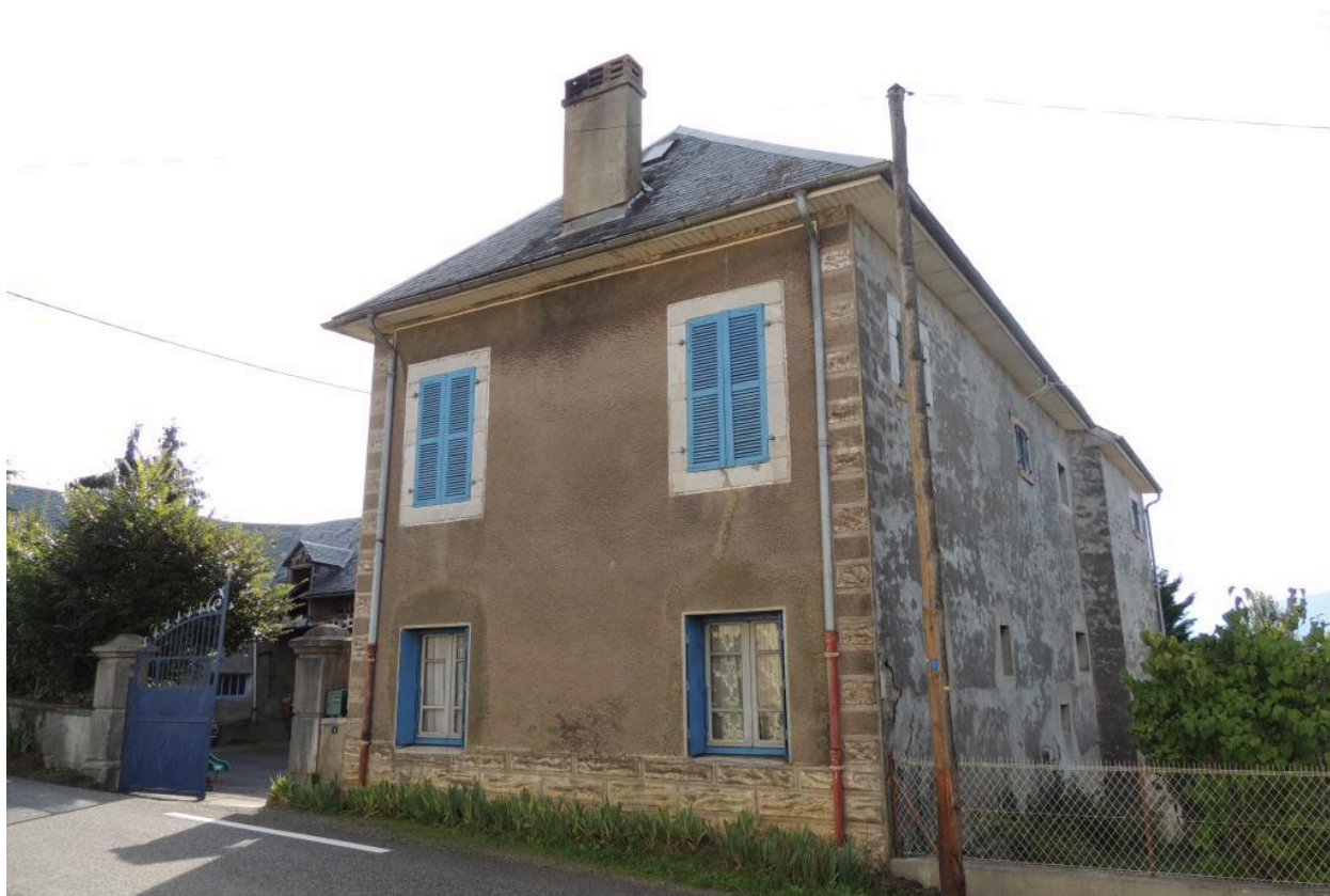
Vue de l'élévationouest du logis.