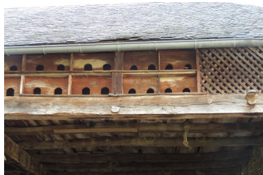
Détail du pigeonnier.