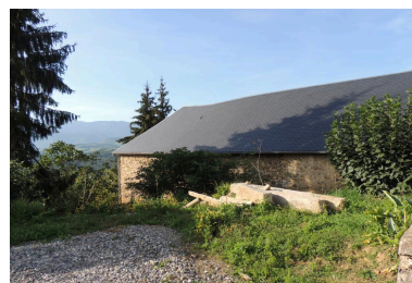
Elévation nord-est des dépendances.