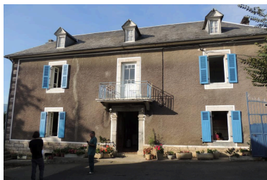
Vue de l'élévation principale du logis. IVD65_20146500450NUCA