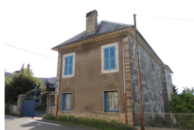
Vue de l'élévation ouest du logis. IVD65_20146500451NUCA