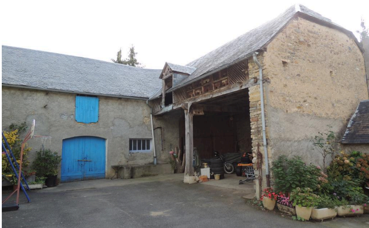
Vue des dépendances depuis le sud.