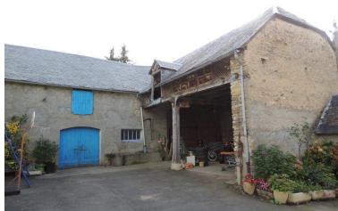
Vue des dépendances depuis le sud. IVD65_20146500453NUCA