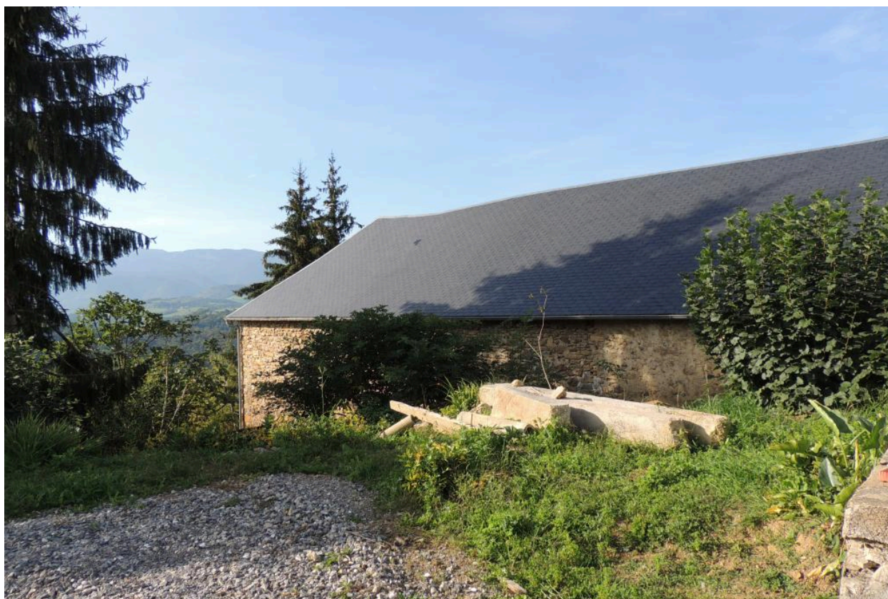
Elévation nord-est des dépendances.