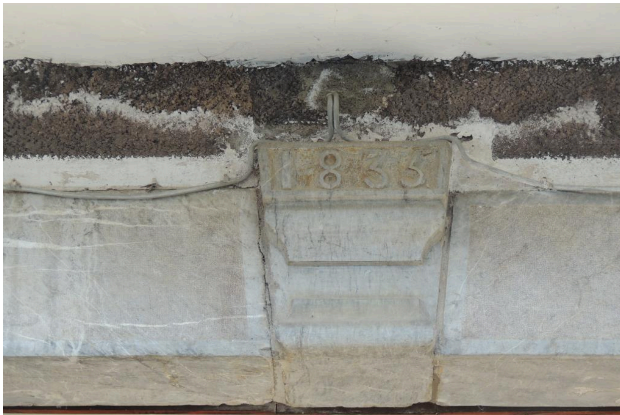
Détail du linteau daté (1835).