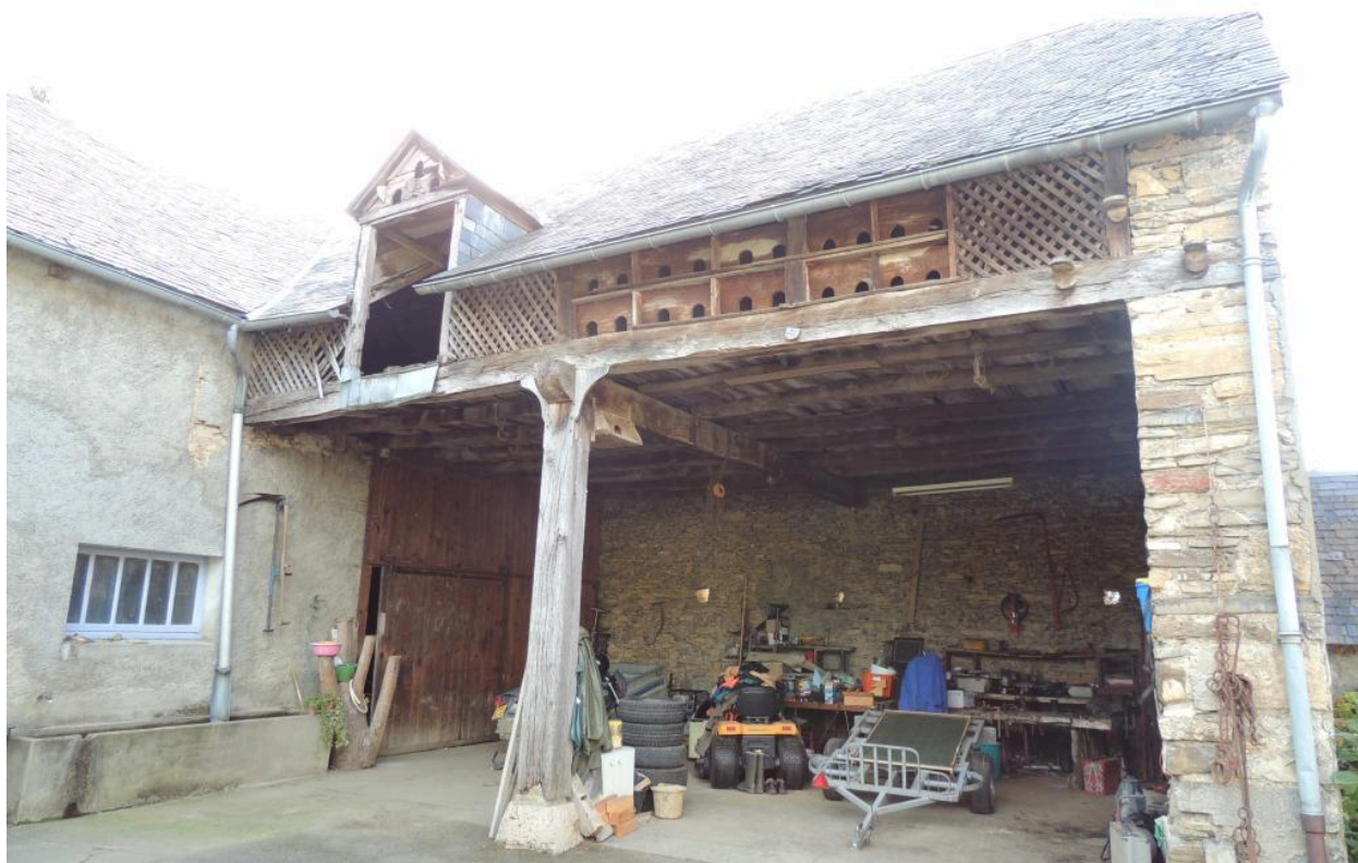
Remise, fenil, et pigeonnier.