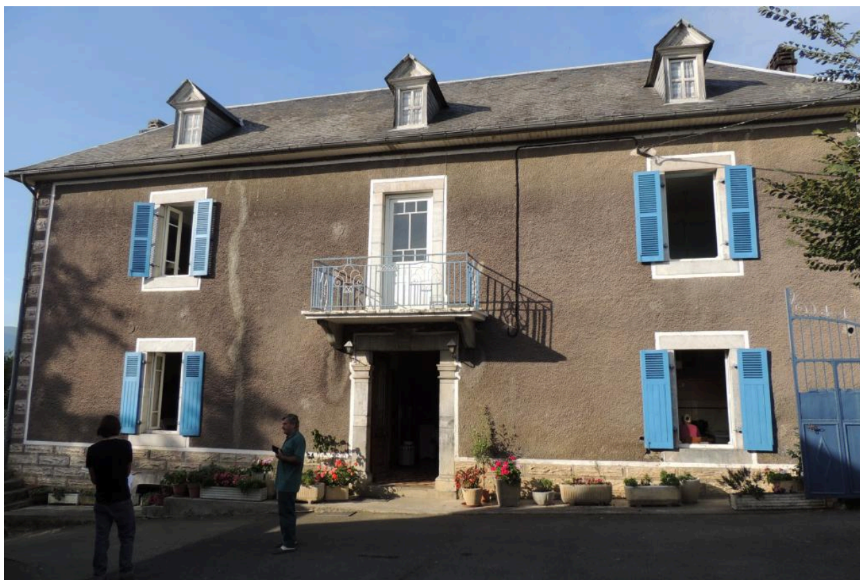
Vue de l'élévation principale du logis.