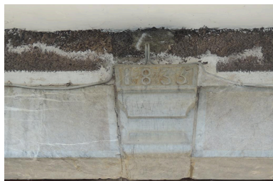
Détail du linteau daté (1835).