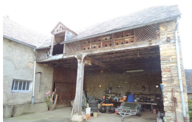
Remise, fenil, et pigeonnier.