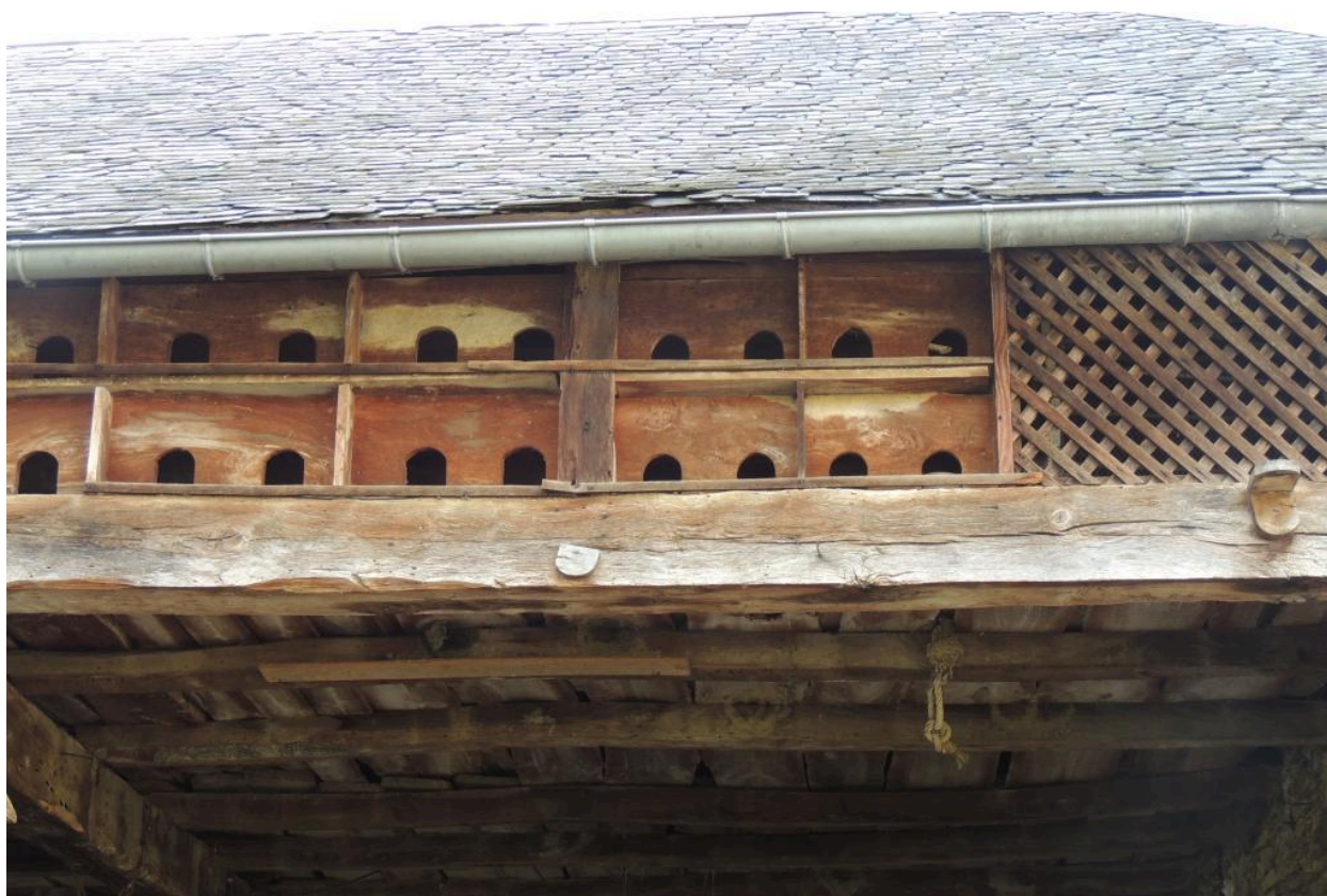
Détail du pigeonnier.