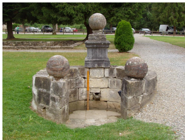
Vue d'ensemble de la fontaine.