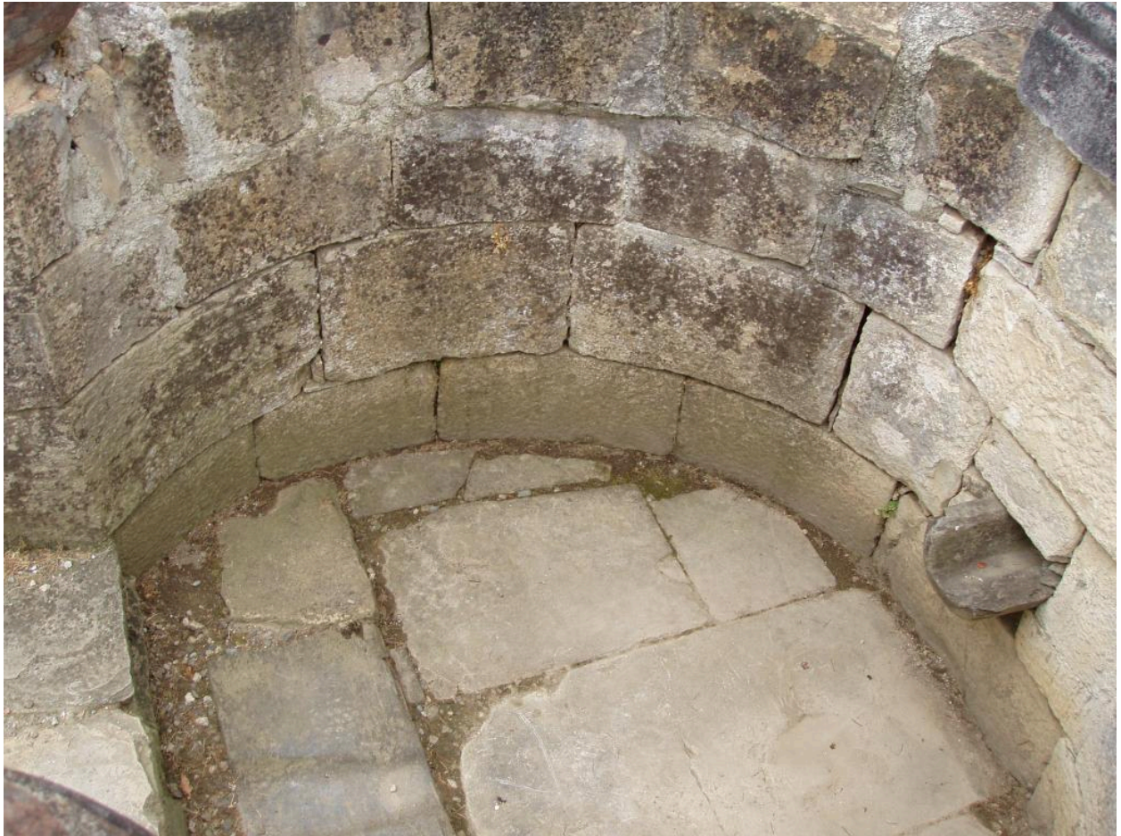
Détail de la fontaine : bec déversoir et bassin.