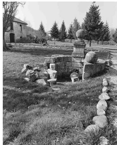
Fontaine.