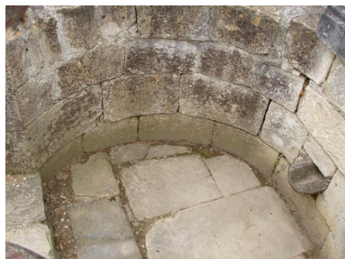
Détail de la fontaine : bec déversoir et bassin. IVD65_20116500003NUCA