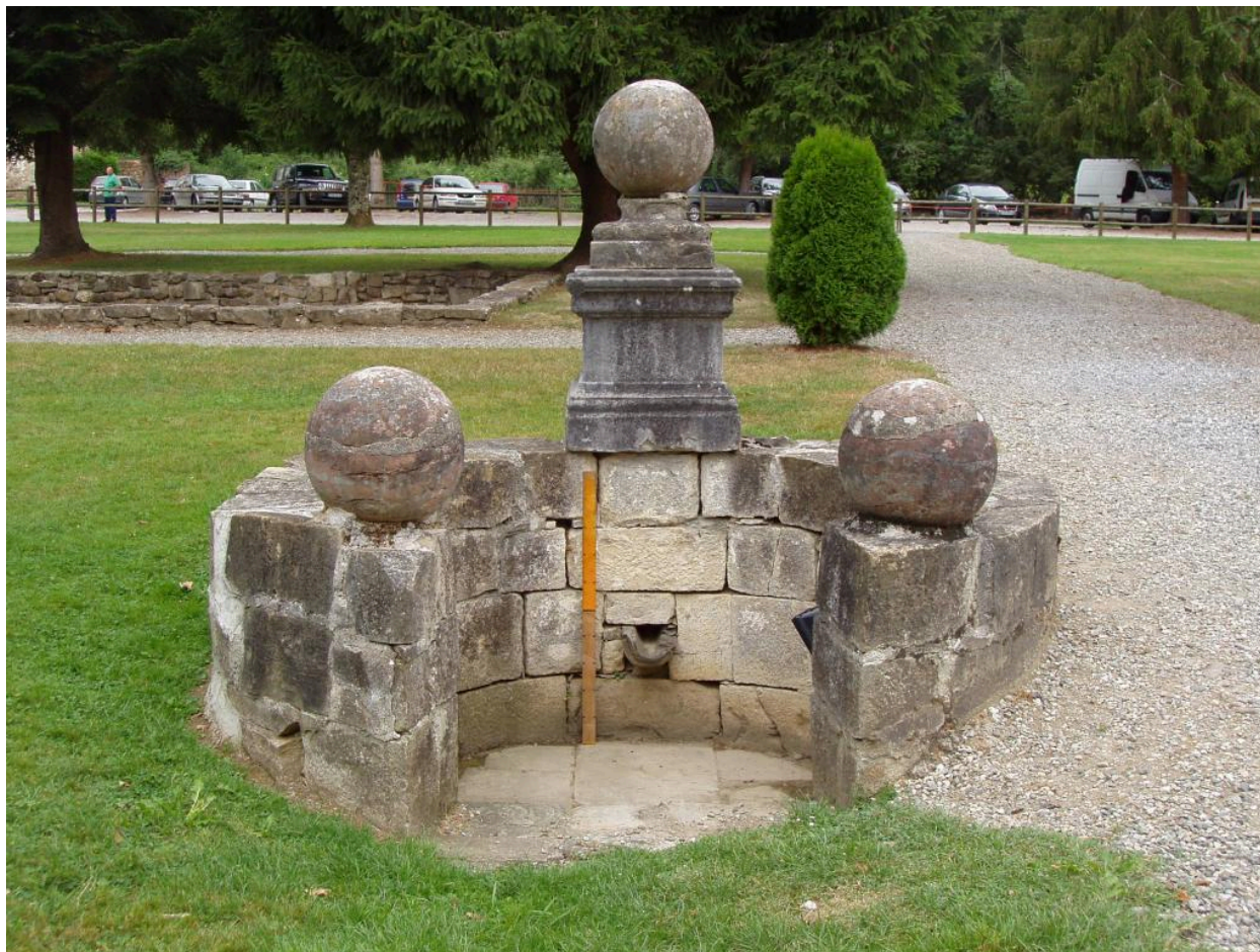
Vue d'ensemble de la fontaine.