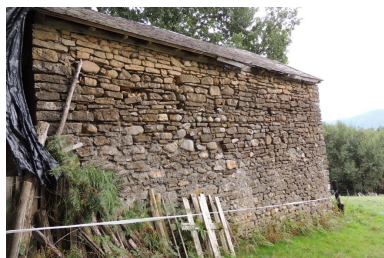
Vue de l'élévation ouest. IVD65_20146500005NUCA