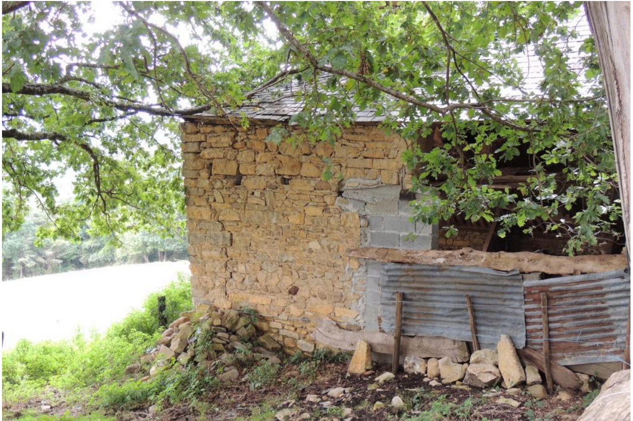
Vue de l'élévation est.