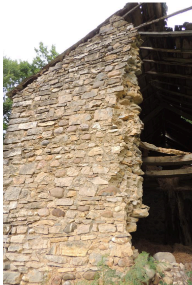
Vue de l'élévation sud. IVD65_20146500006NUCA