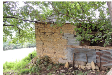
Vue de l'élévation est. IVD65_20146500004NUCA