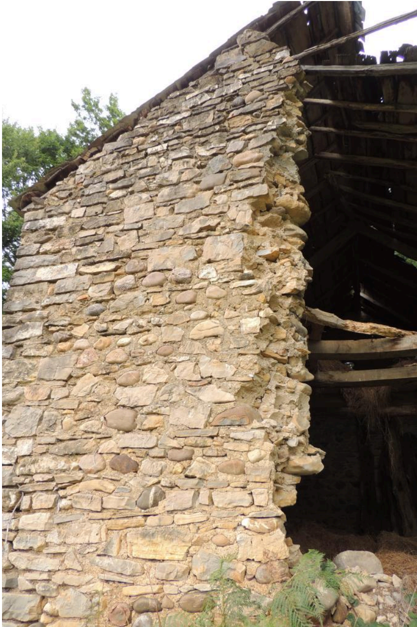
Vue de l'élévation sud.