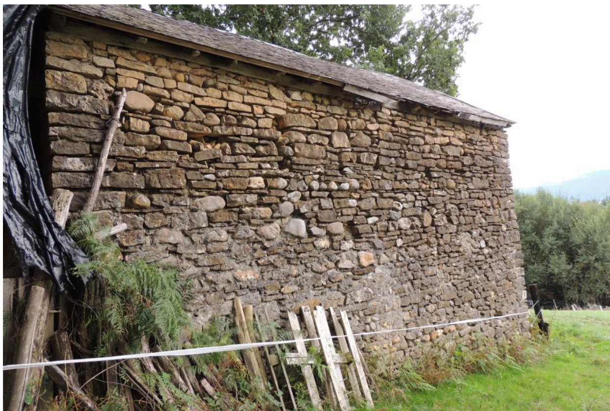
Vue de l'élévation ouest.