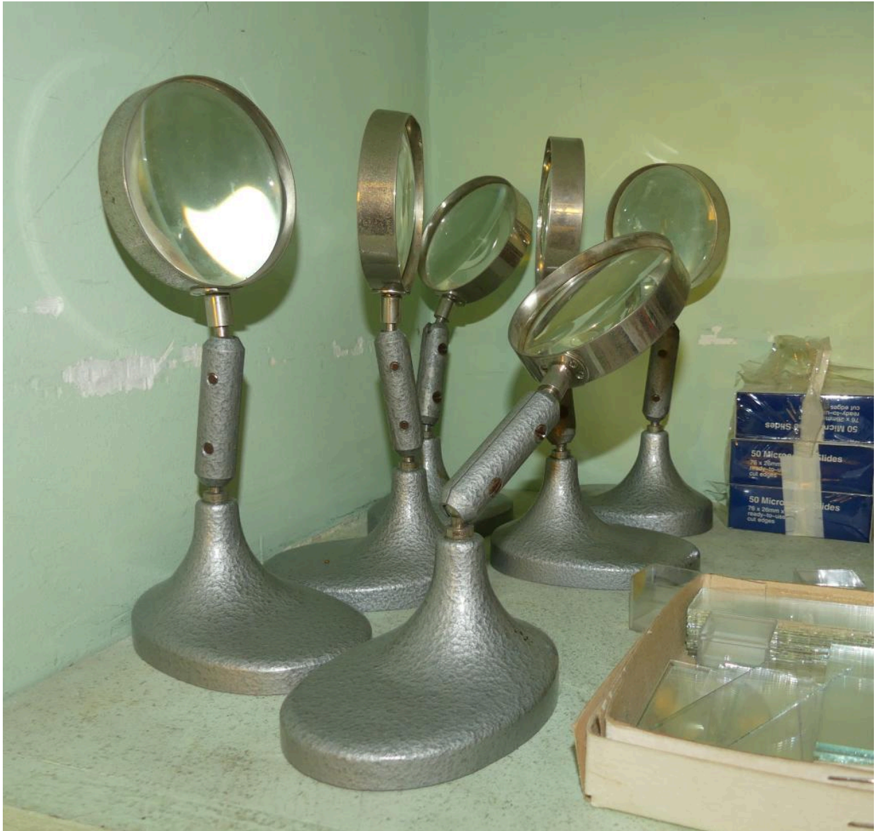
Ensemble de loupes.