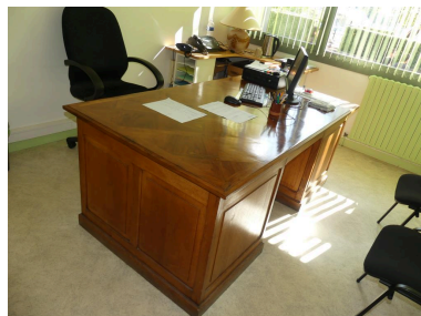
Bureau du directeur.