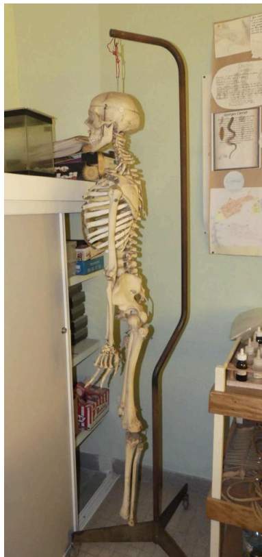
Squelette humain. IVD46_20194602322NUCA