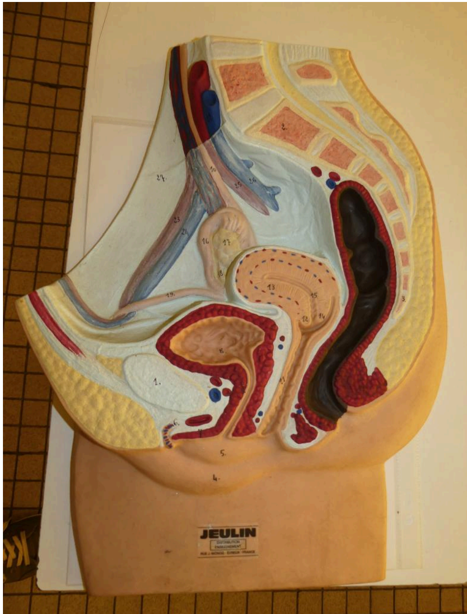
Modèle anatomique d'un bassin de femme en coupe.