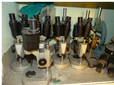
Ensemble de microscopes.