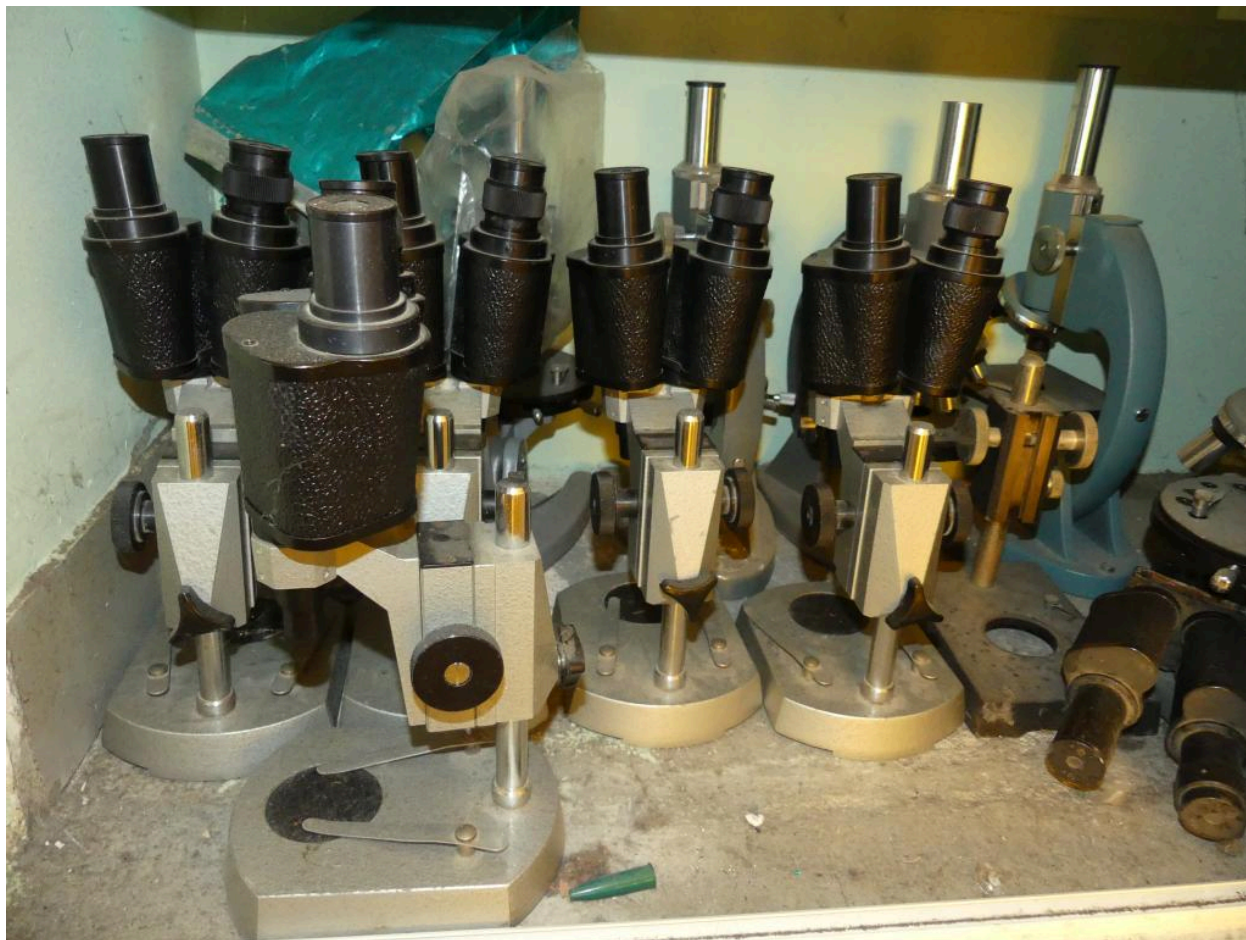
Ensemble de microscopes.