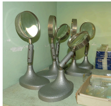
Ensemble de loupes. IVD46_20194602324NUCA