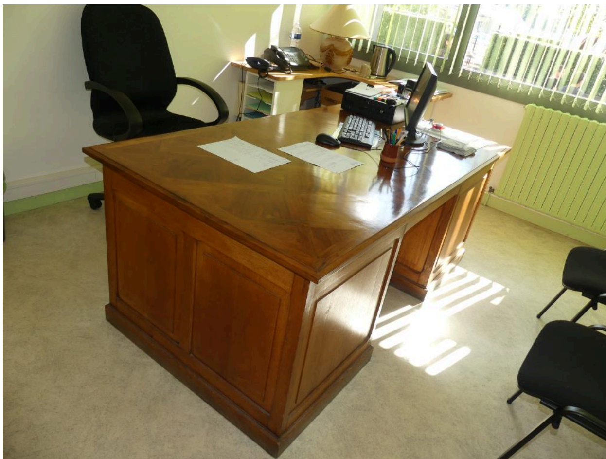
Bureau du directeur.