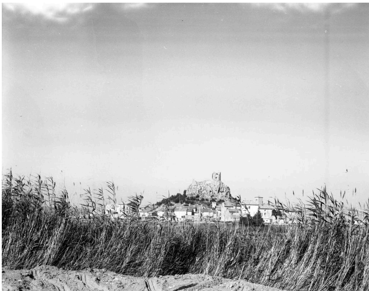
Vue du bourg de Gruissan depuis l'île Saint-Martin.