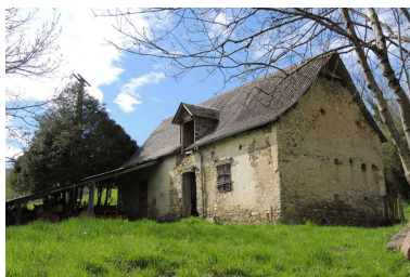
Vue de la ferme depuis le sud-est. IVD65_20136500119NUCA