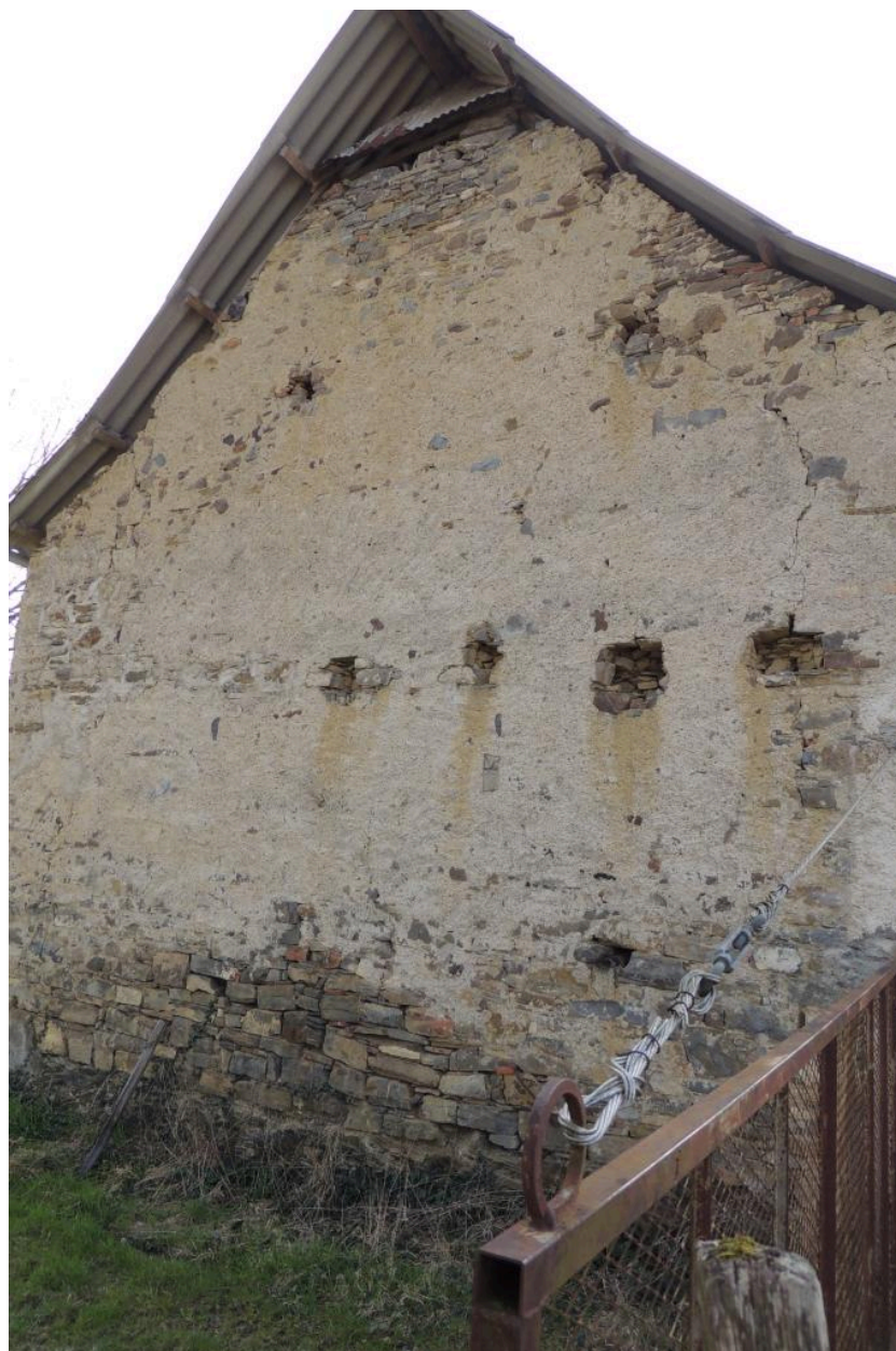
Vue de l'élévation est.