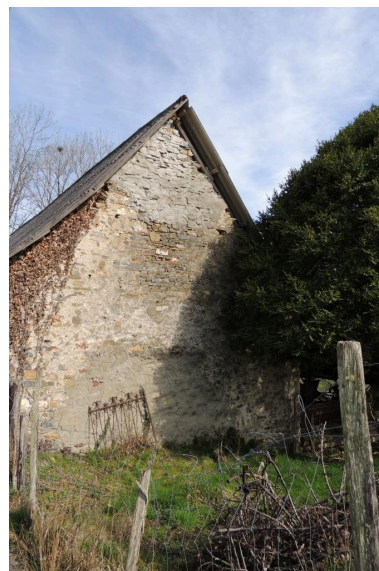
Vue de l'élévation ouest.