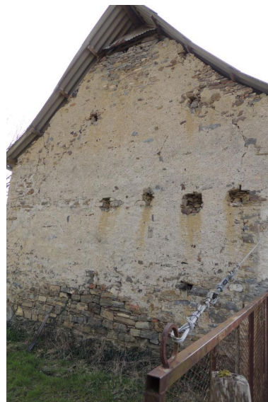
Vue de l'élévation est. IVD65_20136500118NUCA