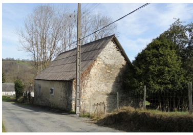
Vue des élévations nord et ouest depuis l'ouest. IVD65_20136500116NUCA