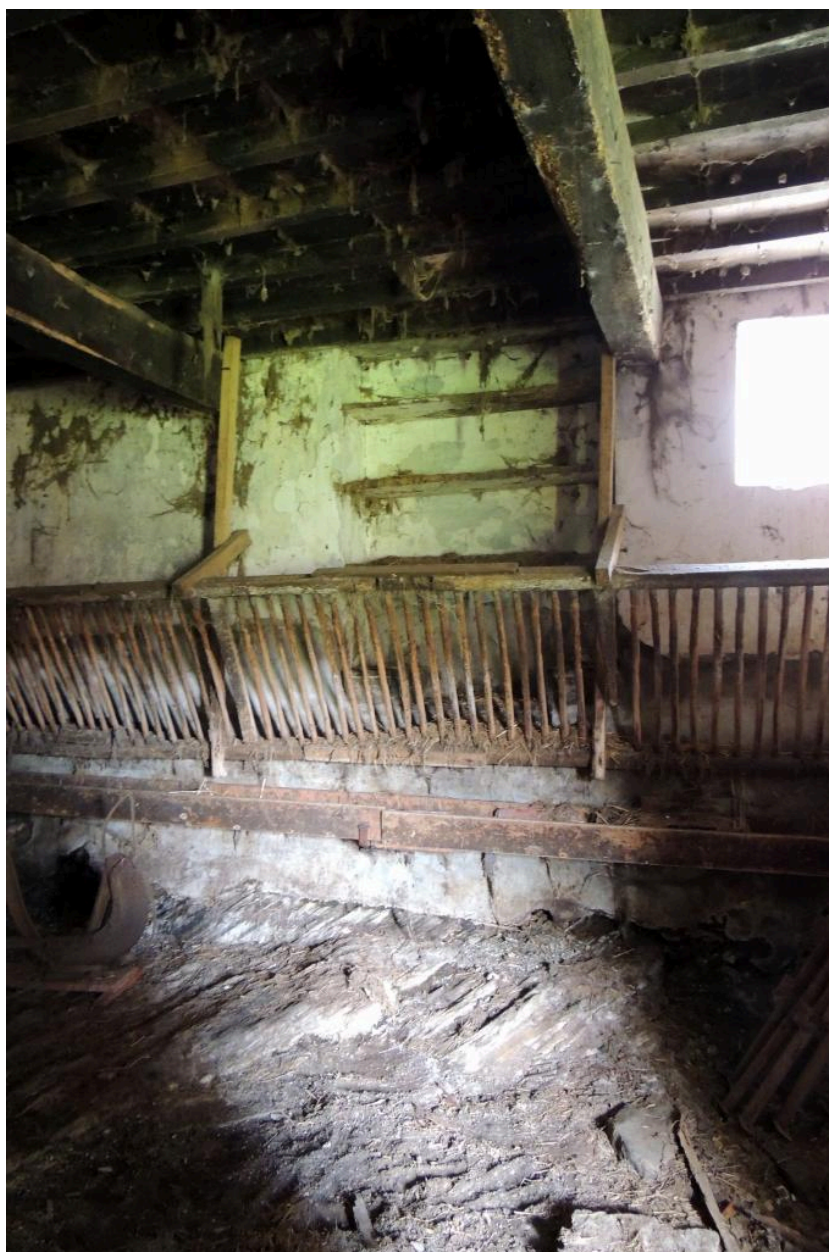
Vue intérieure du mur nord-ouest (évier).