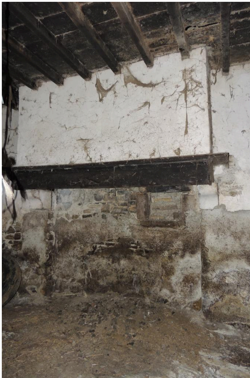
Vue intérieure de l'élévation ouest (cheminée).