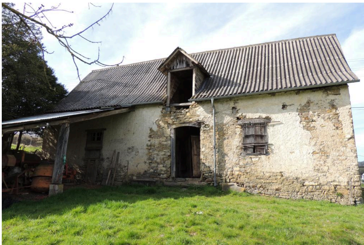
Vue de l'élévation principale depuis le sud.