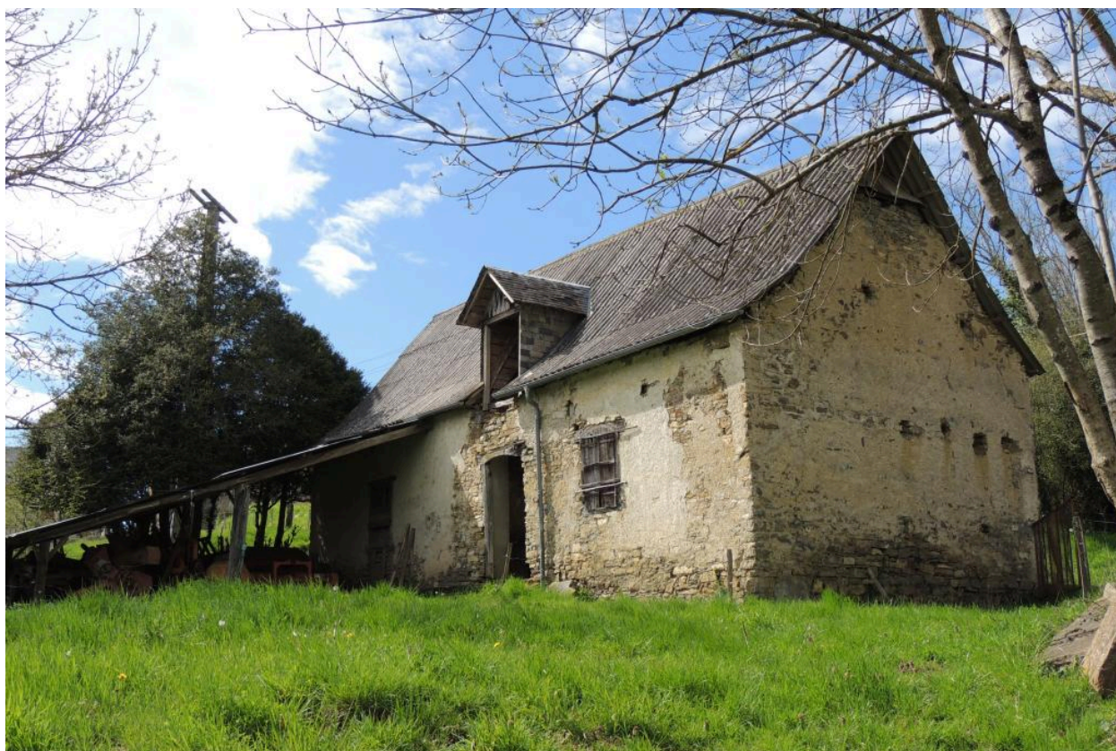
Vue de la ferme depuis le sud-est.