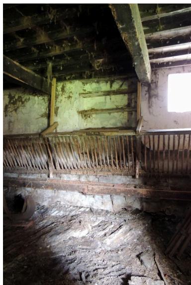
Vue intérieure du mur nord-ouest (évier). IVD65_20136500122NUCA