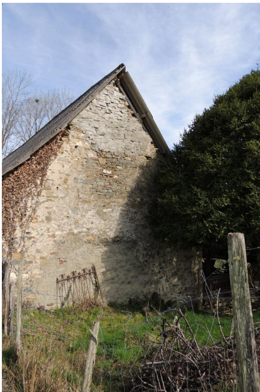
Vue de l'élévation ouest.