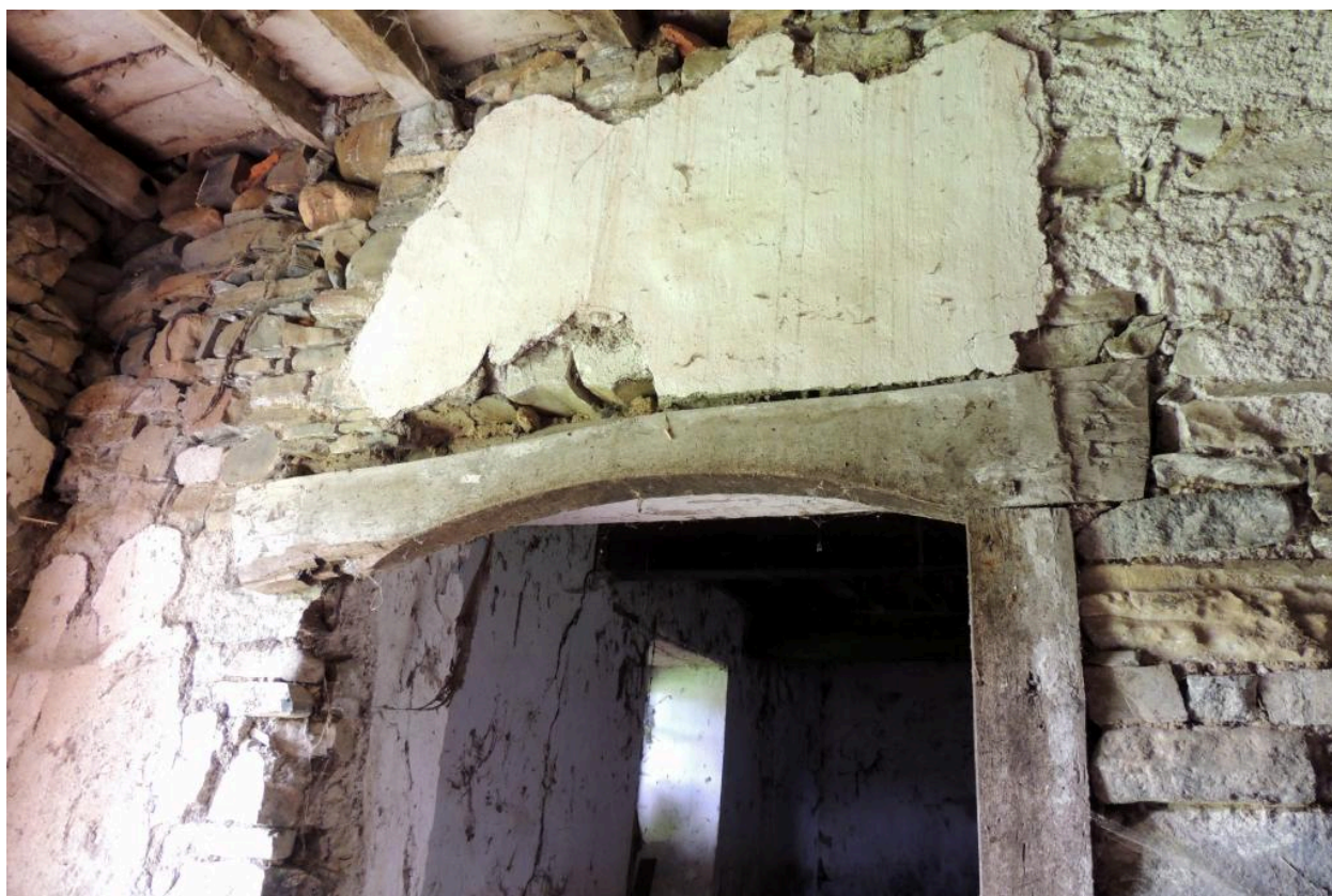
Détail de l'encadrement de la porte d'accès à la pièce ouest.