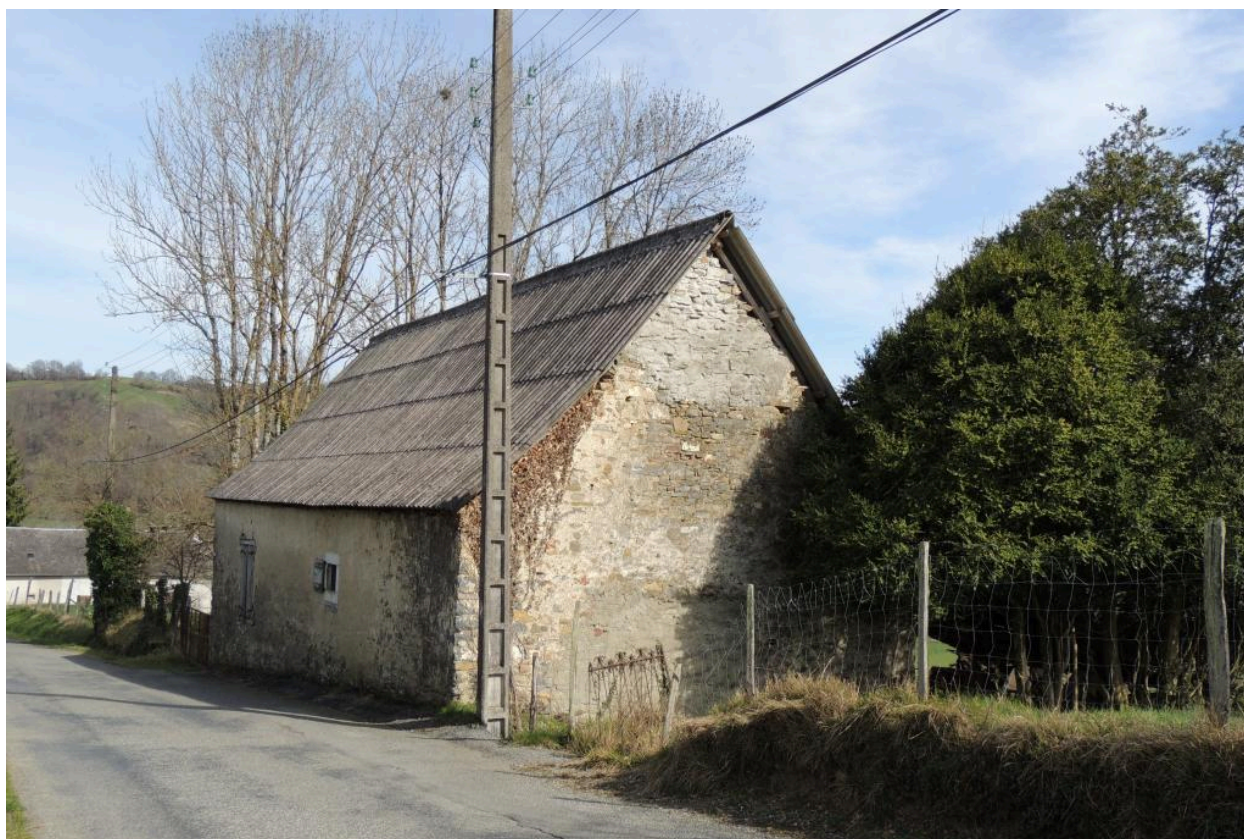
Vue des élévations nord et ouest depuis l'ouest.