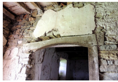
Détail de l'encadrement de la porte d'accès à la pièce ouest.