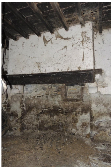
Vue intérieure de l'élévation ouest (cheminée). IVD65_20136500123NUCA