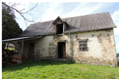
Vue de l'élévation principale depuis le sud. IVD65_20136500120NUCA