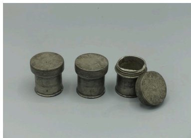
Vue d'ensemble. IVD46_20244601356NUCA