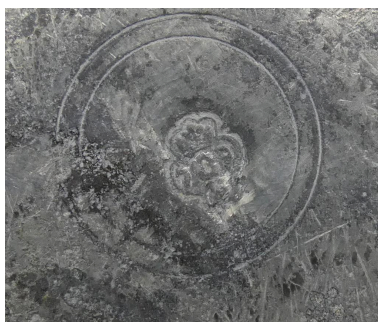
Vue du poinçon sous la base. IVD46_20244601384NUCA