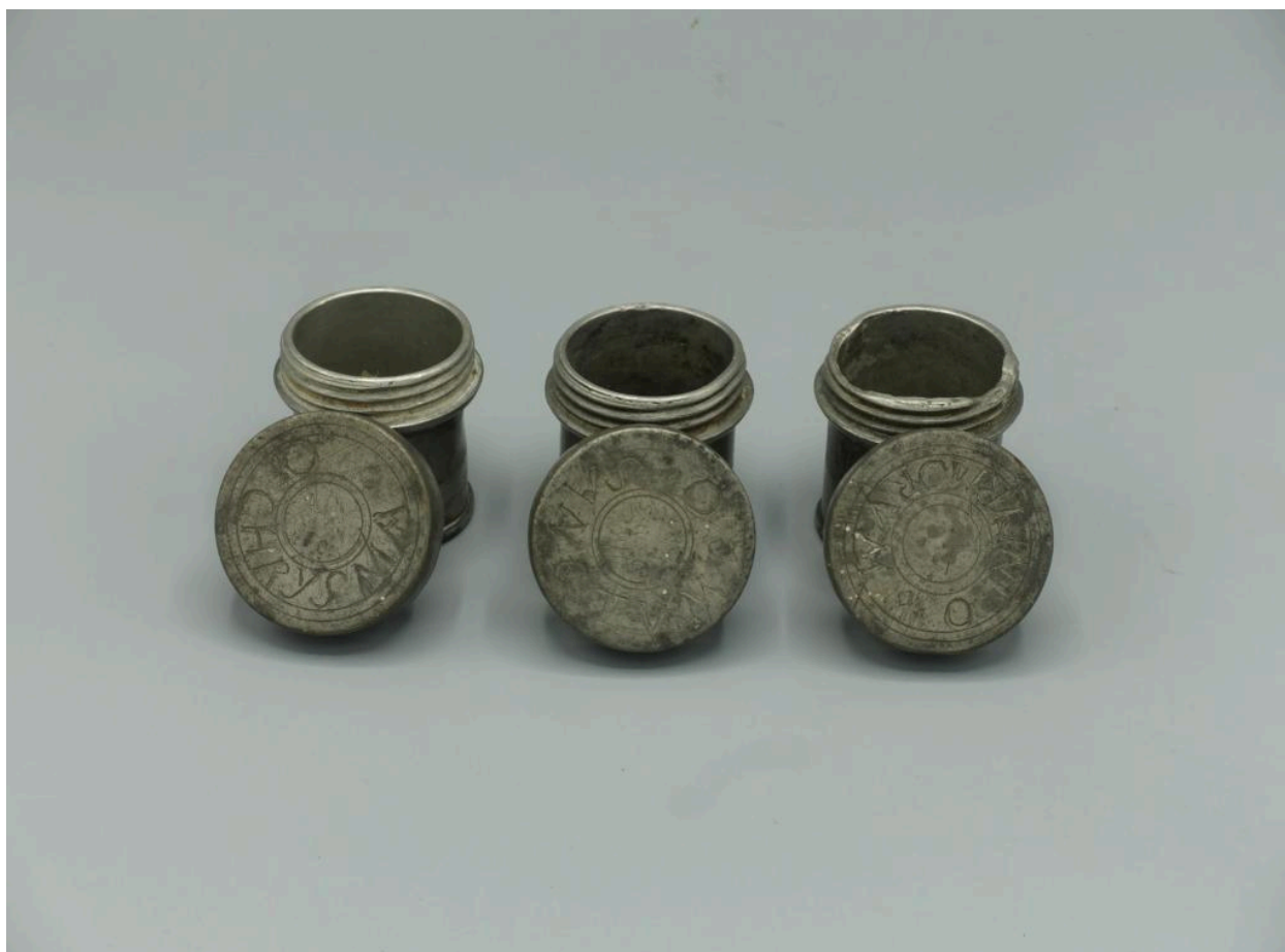
Vue d'ensemble, couvercles ouverts.