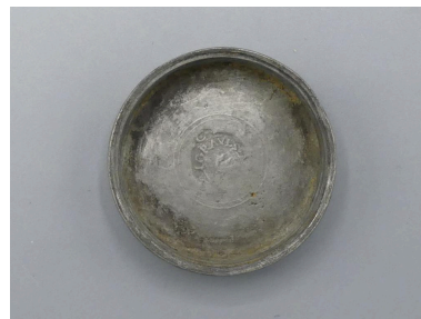
Vue du poinçon à l'intérieur d'un couvercle. IVD46_20244601382NUCA