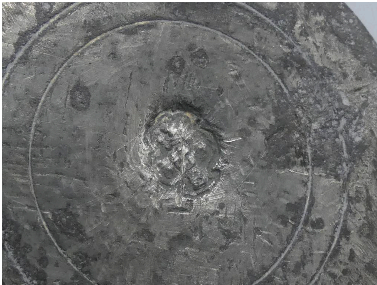
Vue du poinçon sous la base.