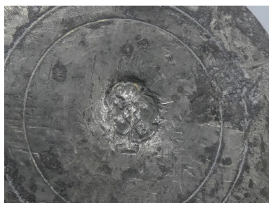
Vue du poinçon sous la base. IVD46_20244601383NUCA