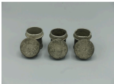
Vue d'ensemble, couvercles ouverts. IVD46_20244601357NUCA