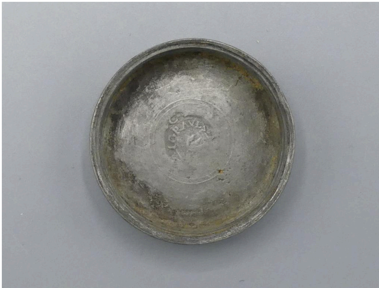
Vue du poinçon à l'intérieur d'un couvercle.