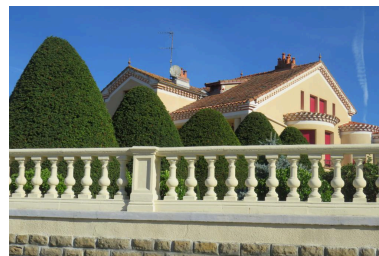
Vue générale depuis la rue. IVC09160_20190900591NUCA