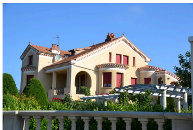
Vue générale depuis la rue (élévations sud et est). IVC09160_20200900174NUCA