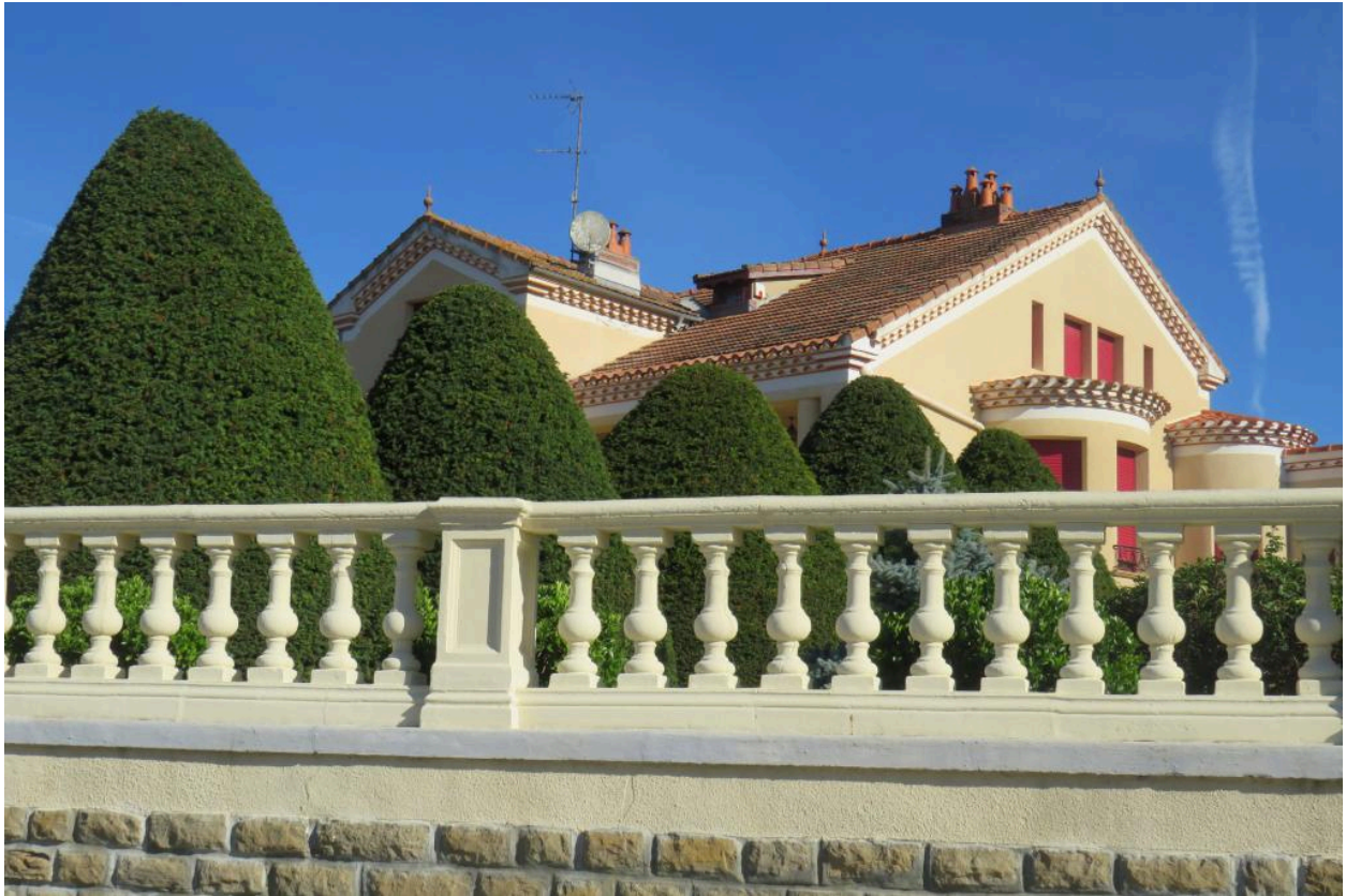
Vue générale depuis la rue.