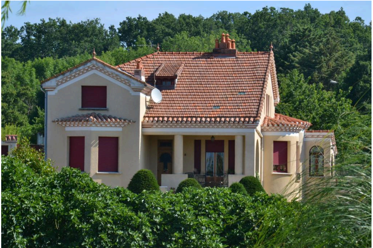
Vue générale, élévation sud.