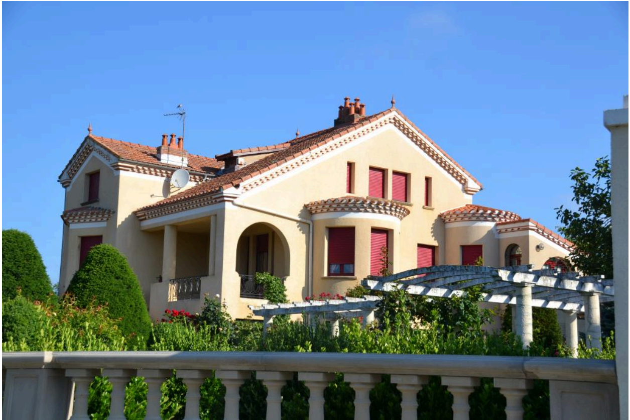
Vue générale depuis la rue (élévations sud et est).