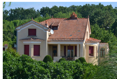
Vue générale, élévation sud. IVC09160_20200900175NUCA