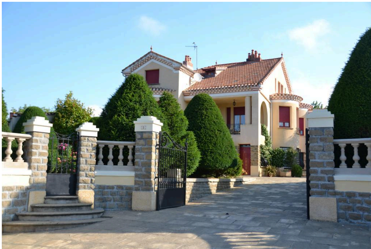
Vue générale depuis la rue (élévations sud et est).