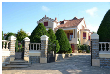
Vue générale depuis la rue (élévations sud et est). IVC09160_20200900173NUCA