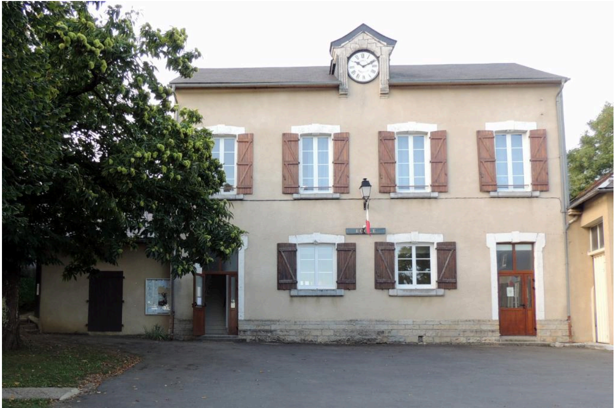
Elévation principale de l'école depuis le nord.