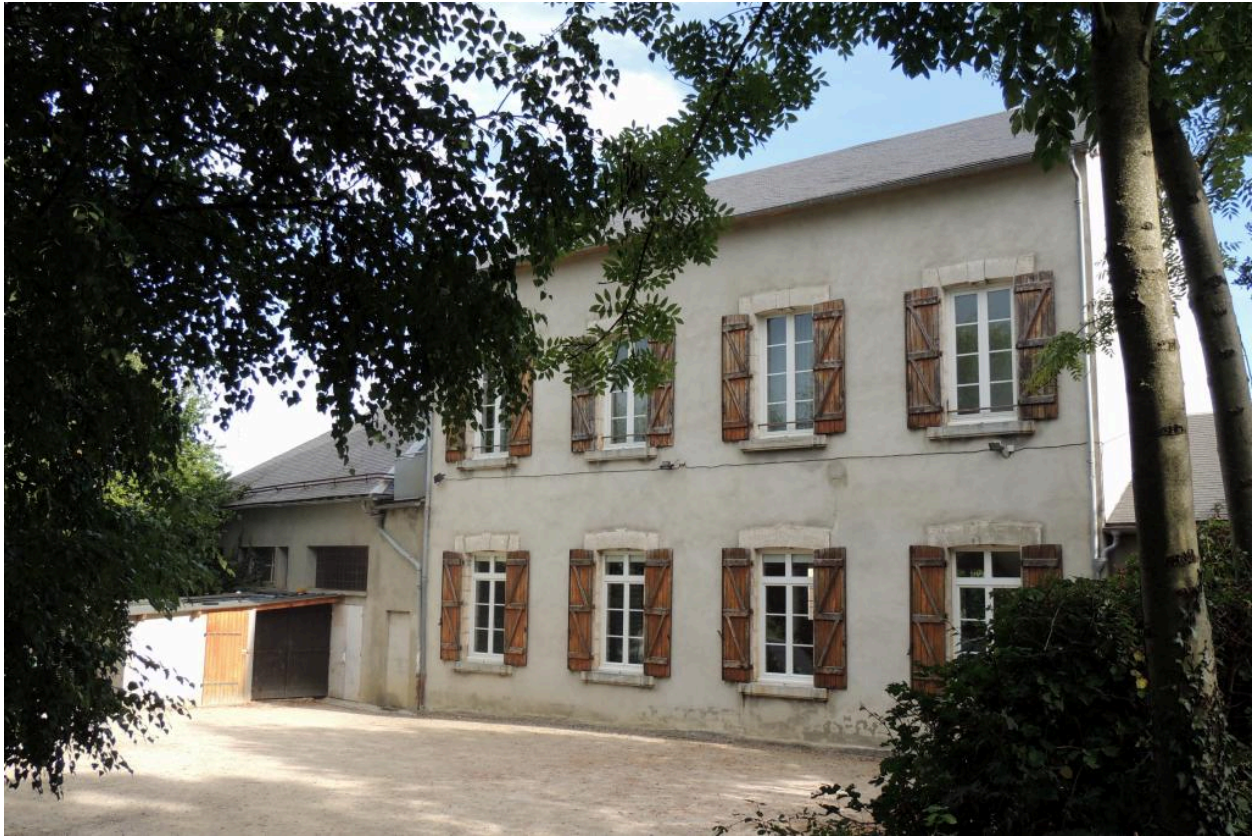
Vue de l'élévation sud.