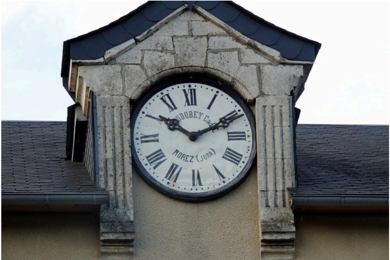
Détail de l'horloge.