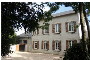
Vue de l'élévation sud.