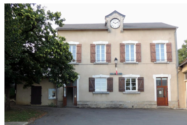
Elévation principale de l'école depuis le nord. IVD65_20146500501NUCA