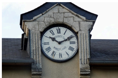
Détail de l'horloge. IVD65_20146500502NUCA