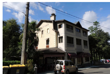
Vue de l'auberge depuis l'est. IVD65_20146500029NUCA