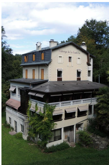
Vue de l'auberge depuis le sud-est. IVD65_20146500028NUCA