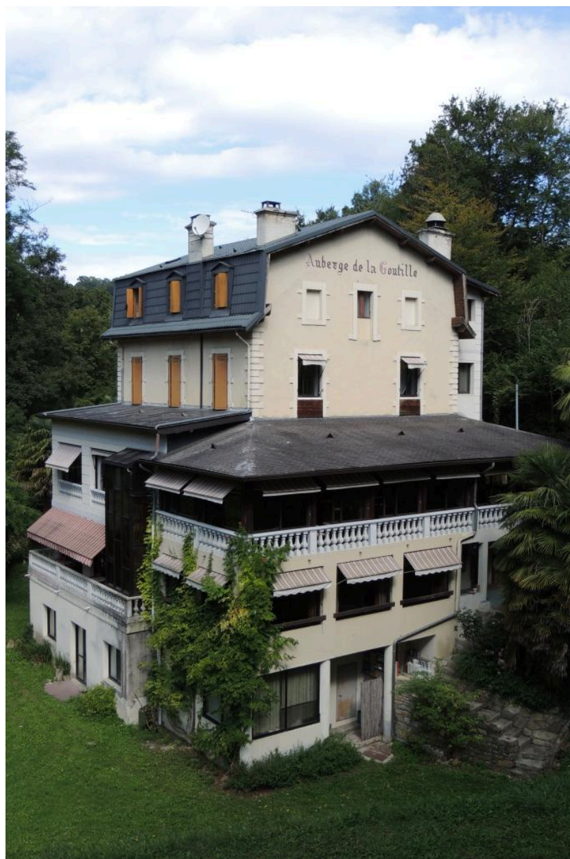
Vue de l'auberge depuis le sud-est.