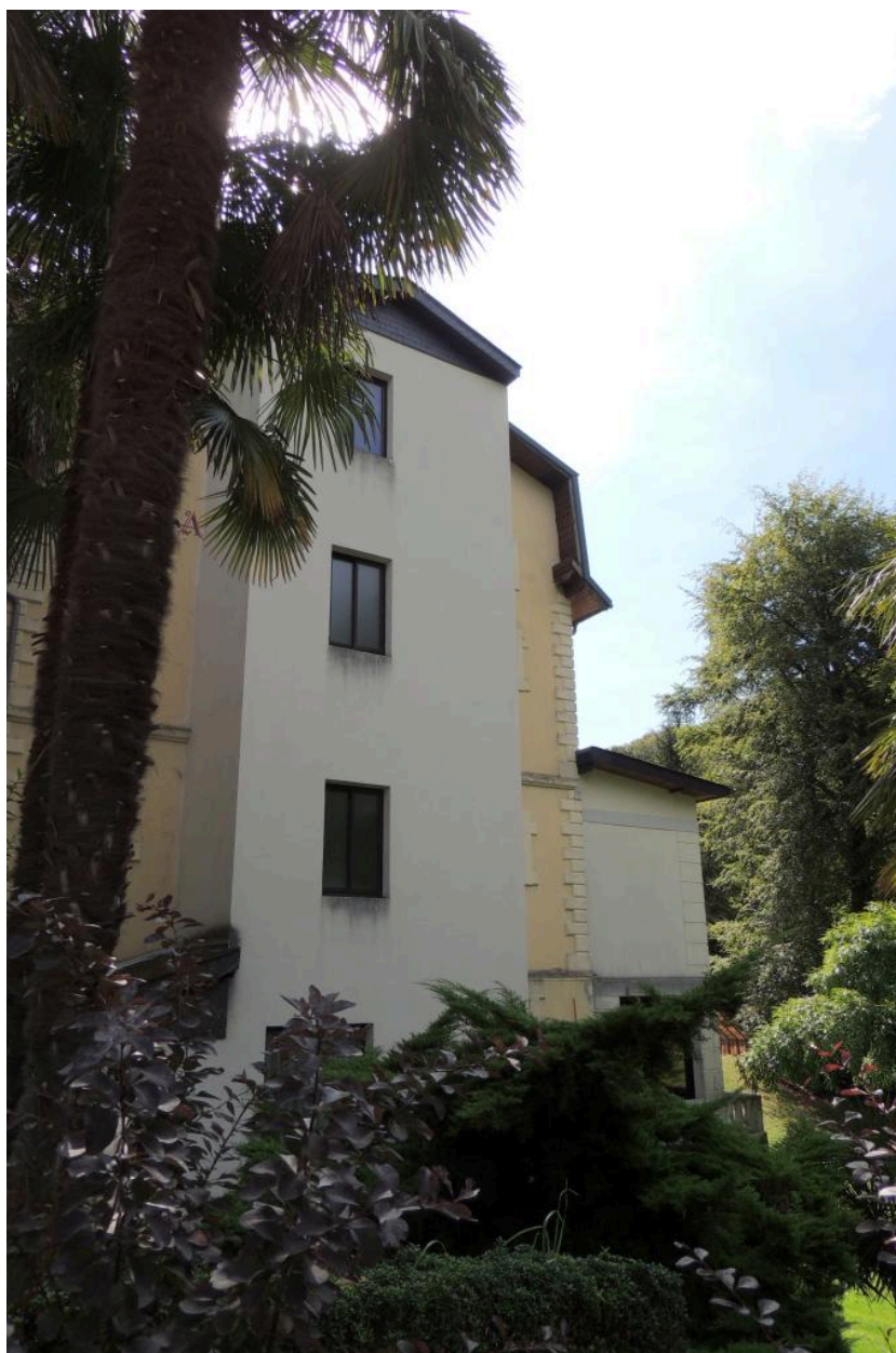
Vue de l'élévation ouest.