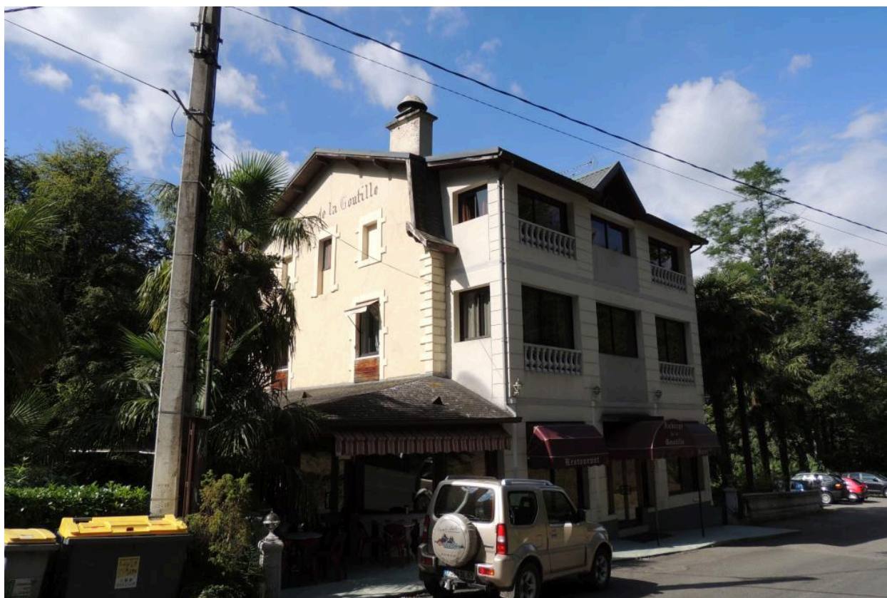
Vue de l'auberge depuis l'est.