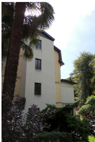
Vue de l'élévation ouest. IVD65_20146500030NUCA