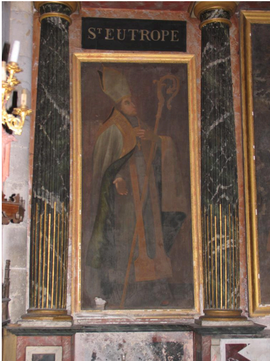
Retable de la chapelle Saint-Antoine : tableau représentant saint Eutrope