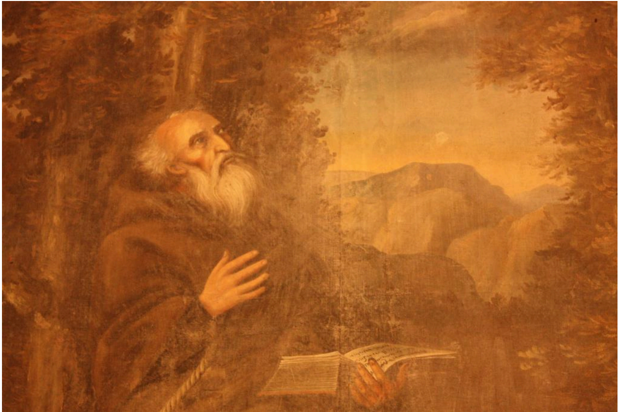
Retable de la chapelle Saint-Antoine : détail du tableau central représentant saint Antoine