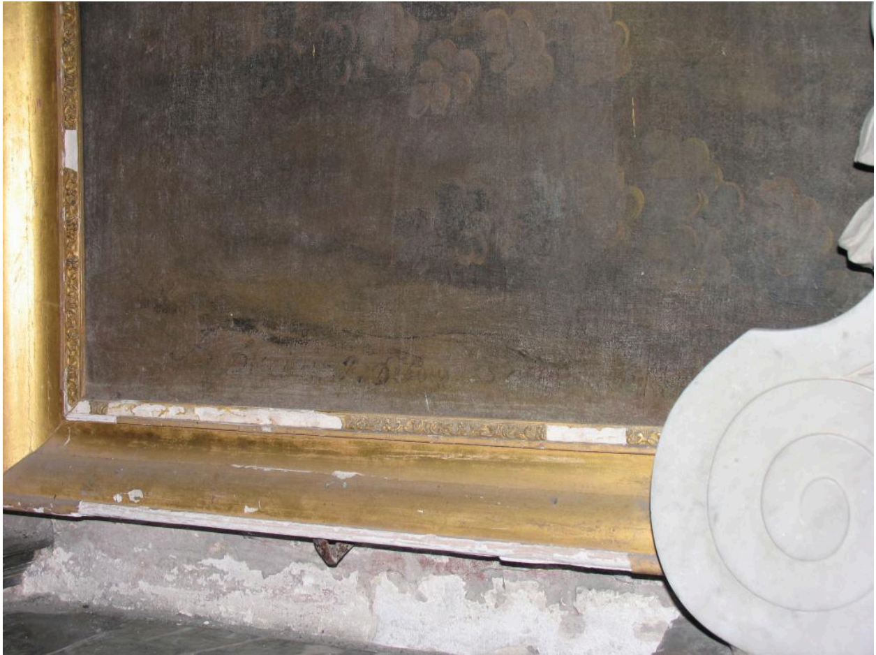
Retable de la chapelle Saint-Antoine : inscription