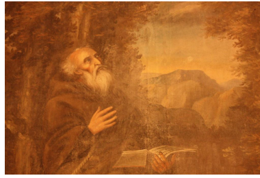
Retable de la chapelle Saint- Antoine : détail du tableau central représentant saint Antoine IVR73_20103201057NUCA