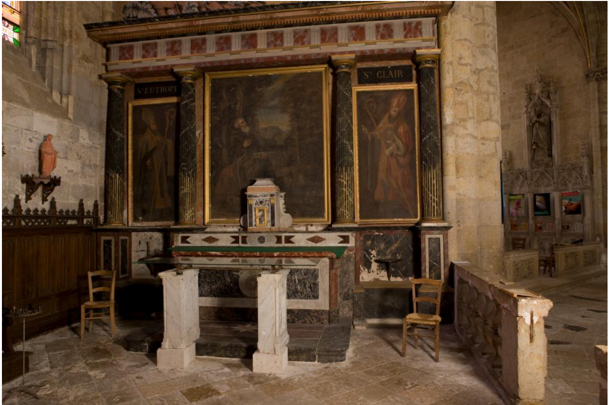
Tableaux de la chapelle Saint-Antoine.