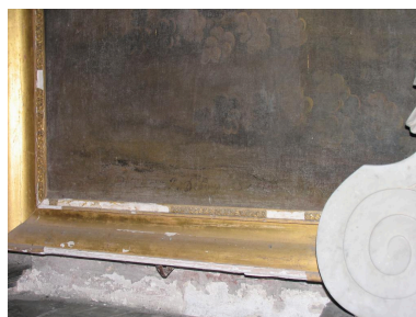
Retable de la chapelle Saint-Antoine : inscription IVR73_20103201002NUCA