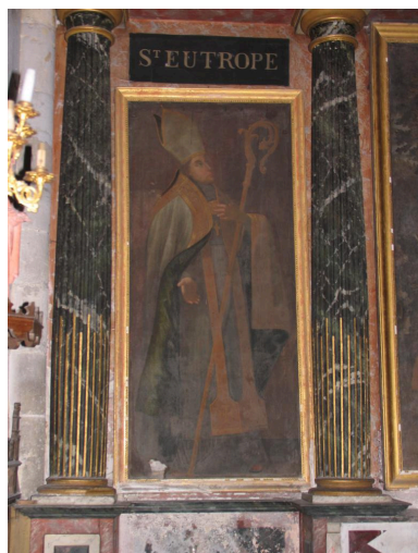
Retable de la chapelle Saint-Antoine : tableau représentant saint Eutrope