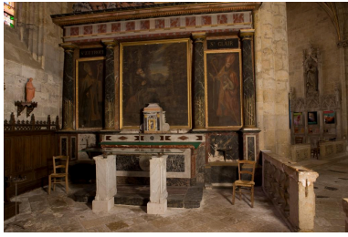
Tableaux de la chapelle Saint-Antoine. IVR73_20103250247NUCA