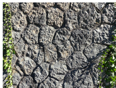
Mur de sout nement, d tail (M9).