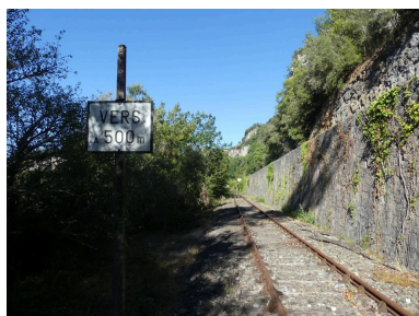
Panneau de signalisation,   500 m de la gare de Vers.