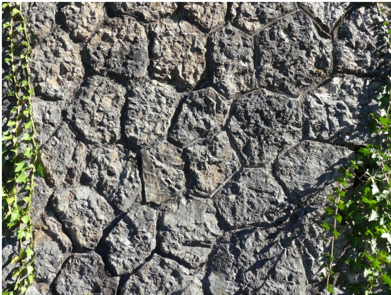
Mur de sout nement, d tail (M9).