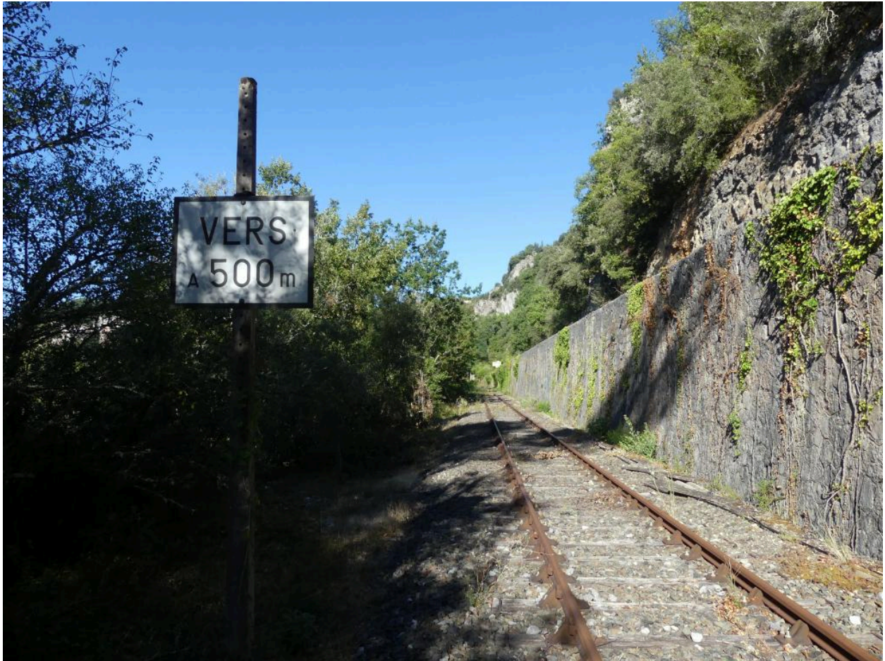
Panneau de signalisation,   500 m de la gare de Vers.