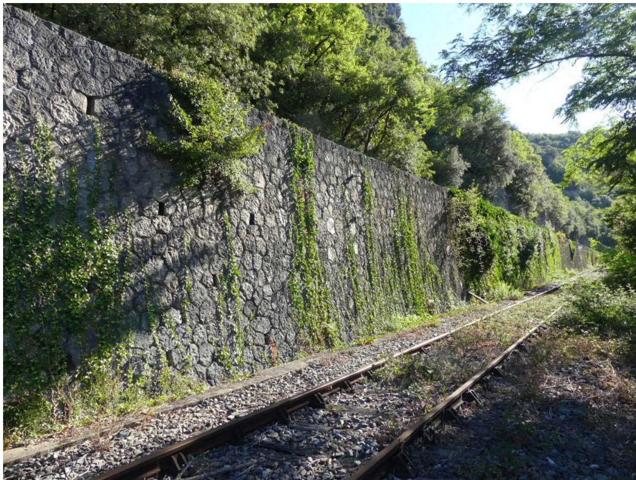
Mur de sout nement (M9).