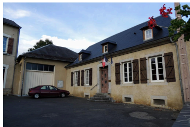
Vue de l'élévation principale de la mairie. IVD65_20146500498NUCA