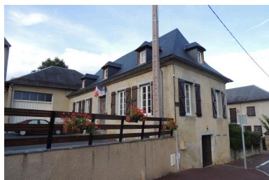
Vue des élévations est et nord.