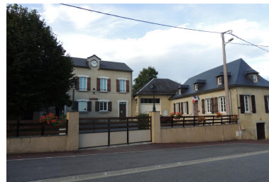
Vue de la mairie et de l'école depuis le nord. IVD65_20146500497NUCA