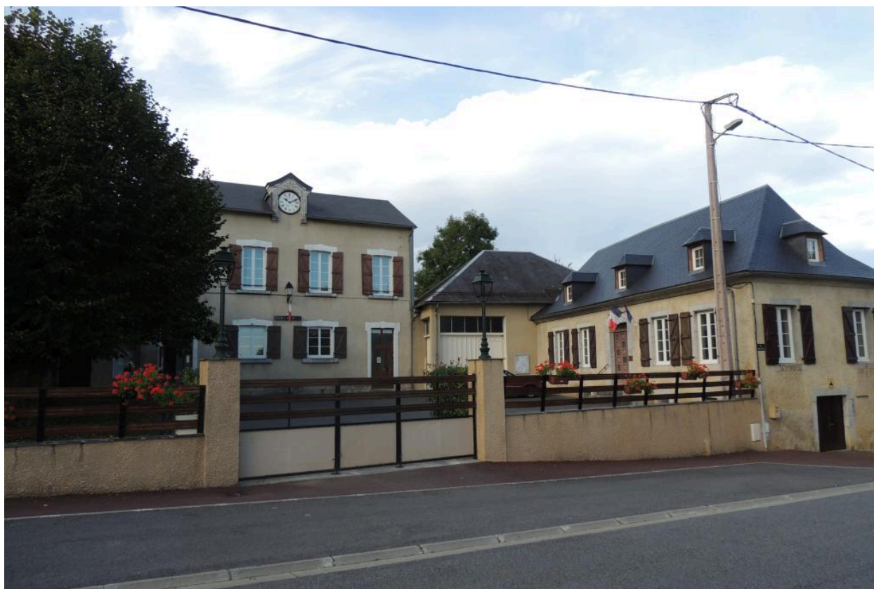
Vue de la mairie et de l'école depuis le nord.