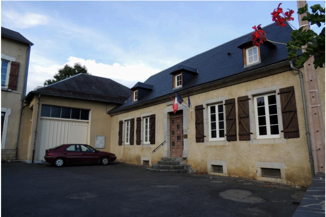
Vue de l'élévation principale de la mairie.