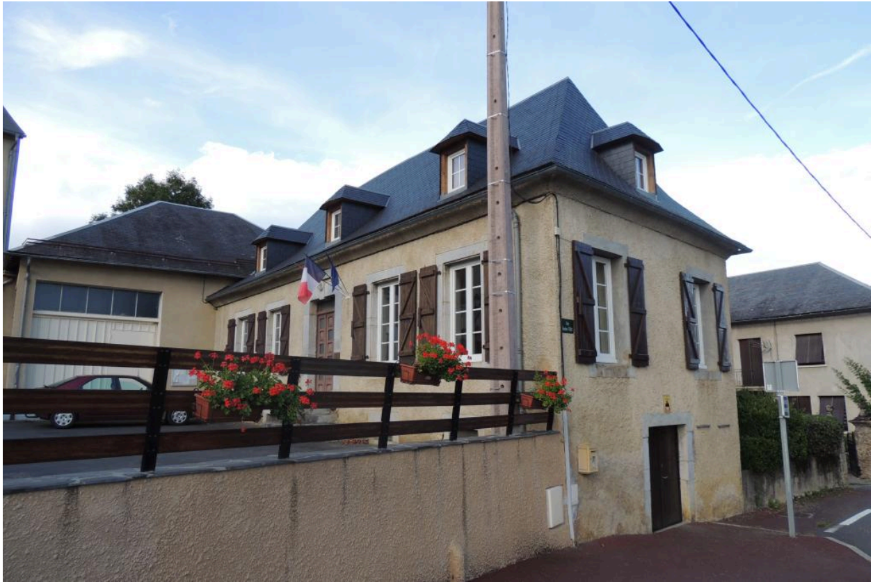
Vue des élévations est et nord.