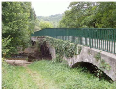
Vue d'ensemble du pont. IVD65_20116500011NUCA