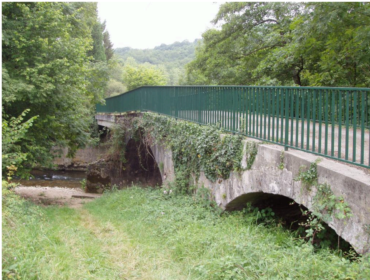
Vue d'ensemble du pont.