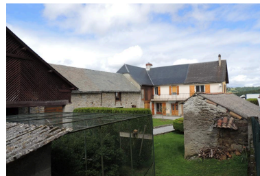
Vue depuis le sud. IVD65_20146500640NUCA