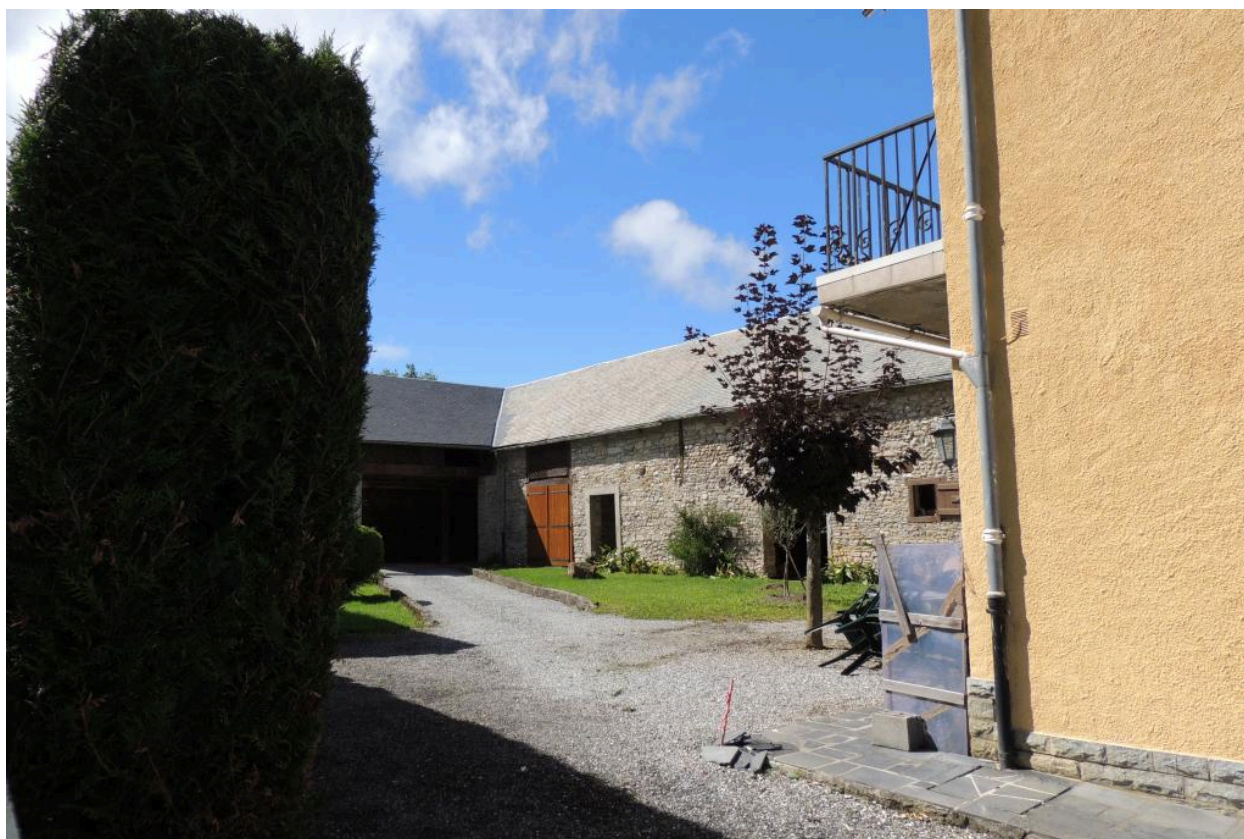
Vue générale de la cour.