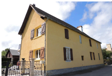
Vue de la façade nord-est.