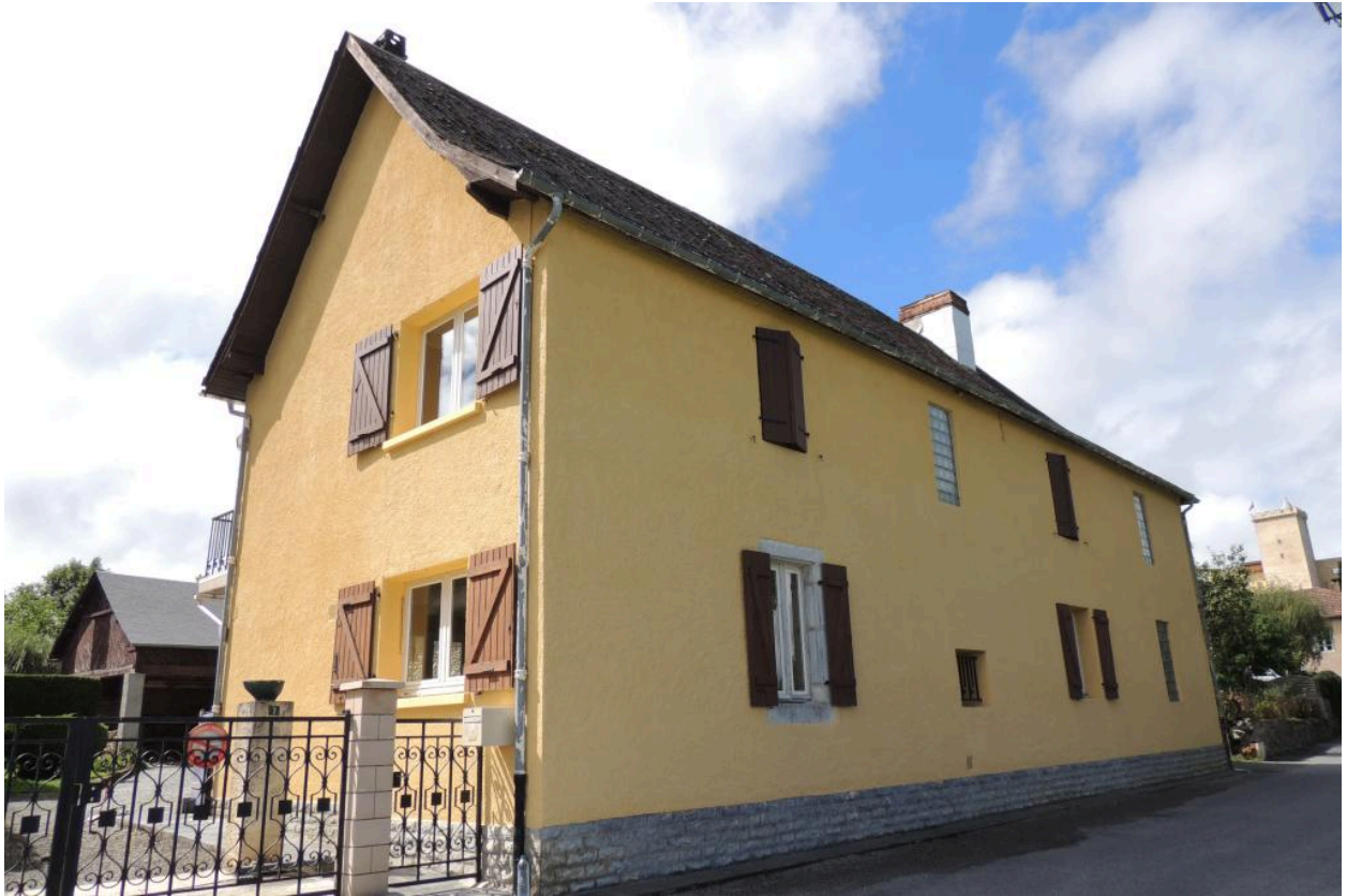
Vue de la façade nord-est.