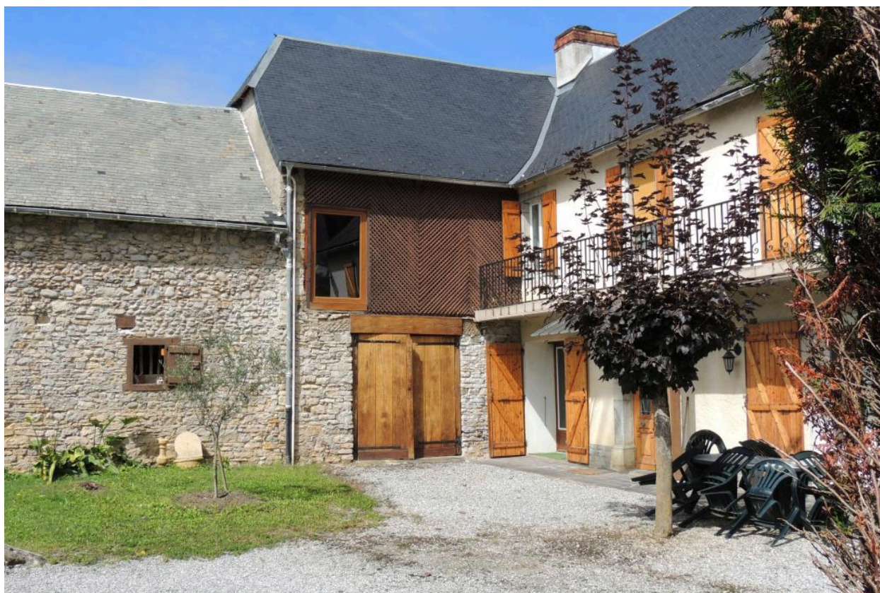
Vue de l'angle nord-ouest de la cour.