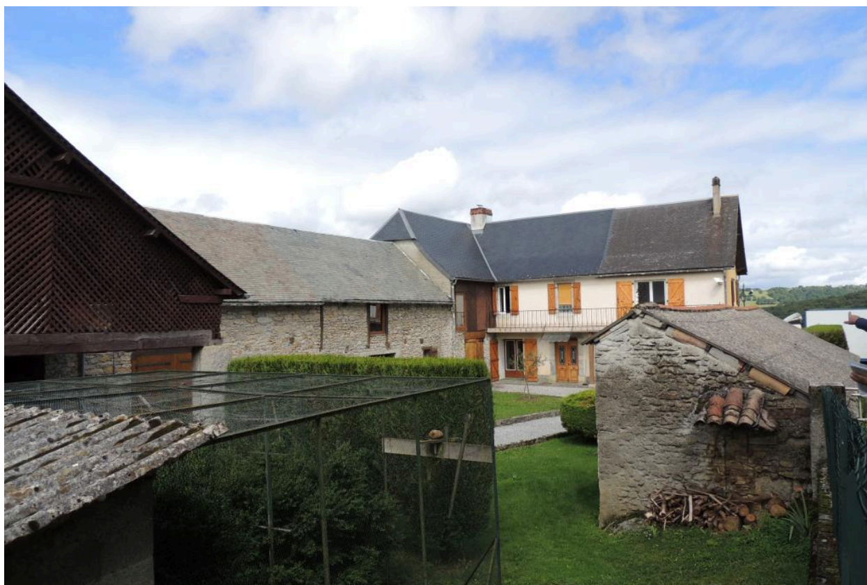
Vue depuis le sud.