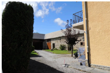
Vue générale de la cour. IVD65_20146500635NUCA