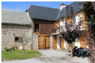
Vue de l'angle nord-ouest de la cour. IVD65_20146500637NUCA