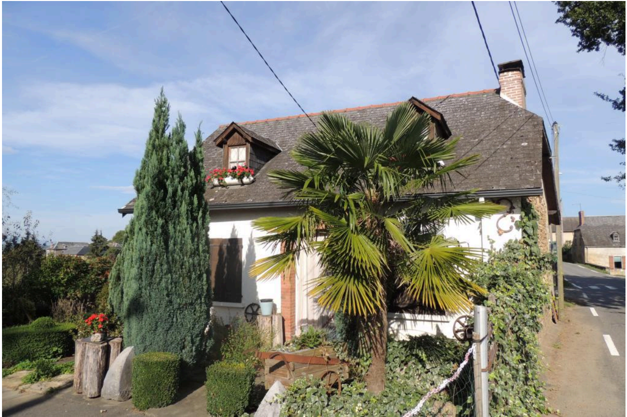
Vue de la maison depuis l'ouest.