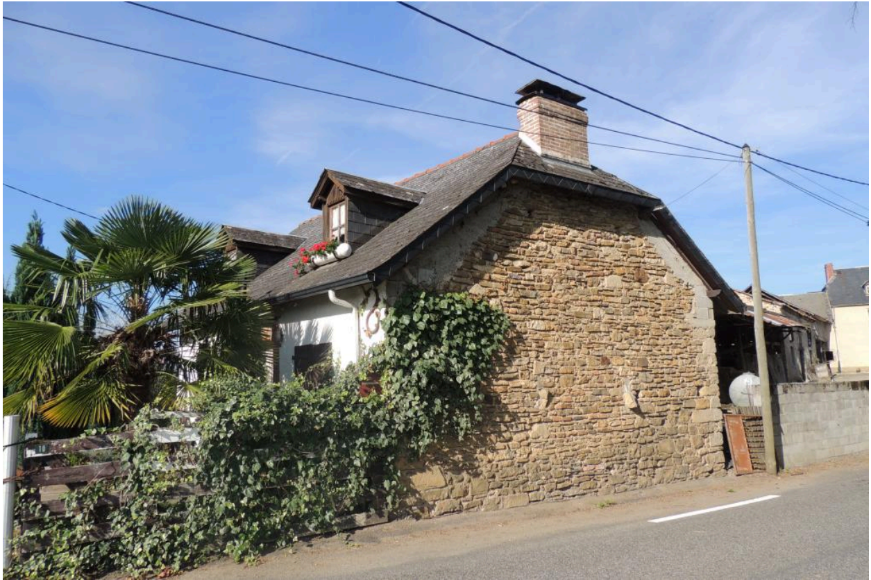
Vue de l'élévation nord.