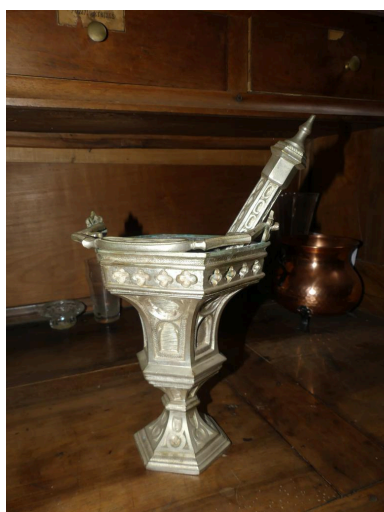
Seau à eau bénite et aspersoir. Phot. Guillaume Bernard