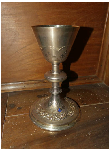
Calice.