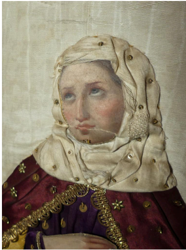
Bannière de procession, détail sainte Geneviève. IVD46_20244603967NUCA