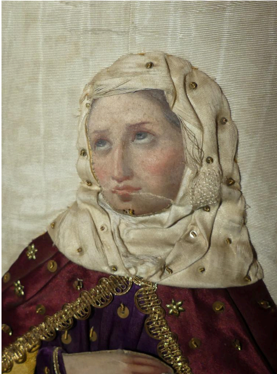
Bannière de procession, détail sainte Geneviève.