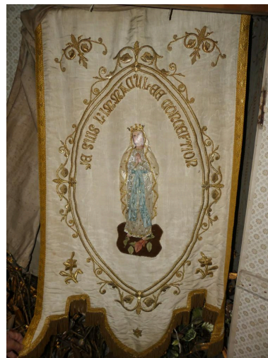
Bannière de procession, vue de face. IVD46_20244603963NUCA