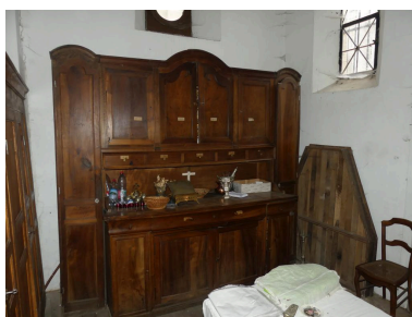
Meuble de sacristie. IVD46_20244603961NUCA