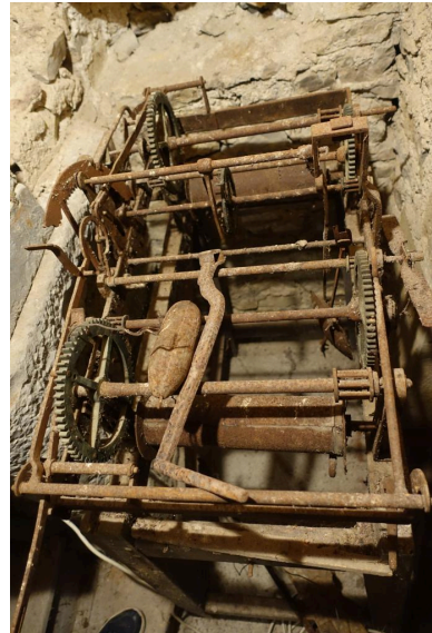
Mécanisme d'horloge.