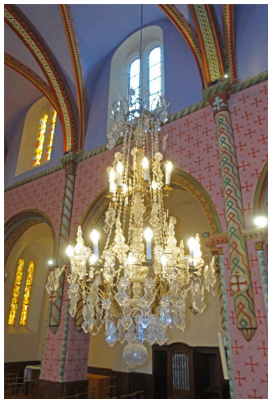
Lustre d'église.