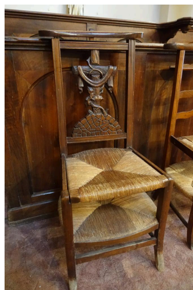
Prie-Dieu. IVD46_20244603888NUCA