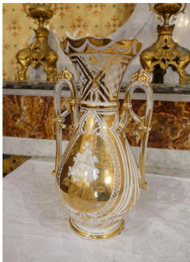
Vase d'autel. IVD46_20244603892NUCA