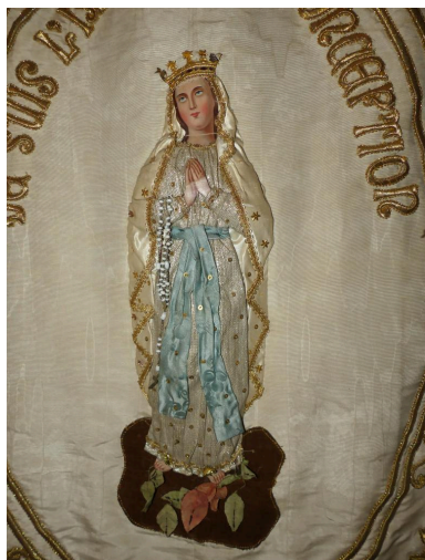
Bannière de procession, détail : ND de Lourdes.