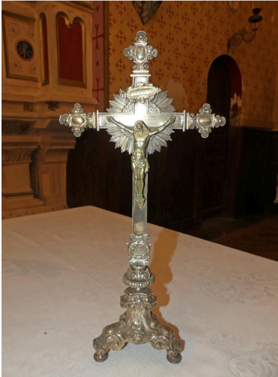
Croix d'autel n°2.