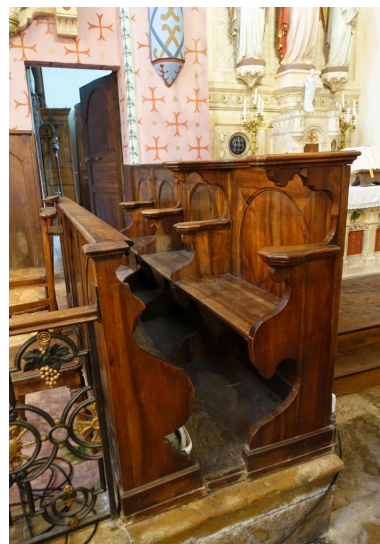
Banc du côté droit du chœur.