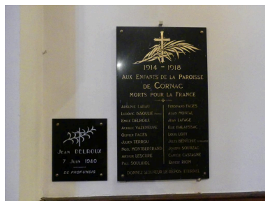
Plaques commémoratives des soldats tués au cours des deux guerres mondiales.