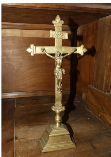
Croix d'autel n°1.