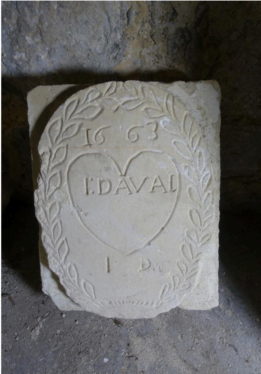
Claveau daté 1663.