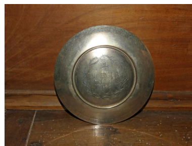
Patène. IVD46_20244603945NUCA