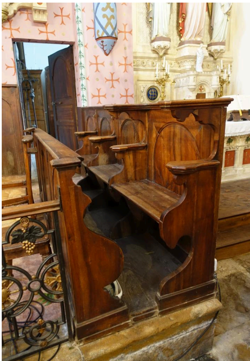
Banc du côté droit du chœur.