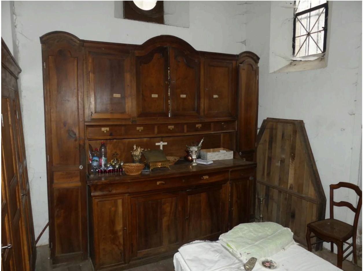
Meuble de sacristie.