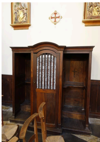
Confessionnal. IVD46_20244603908NUCA