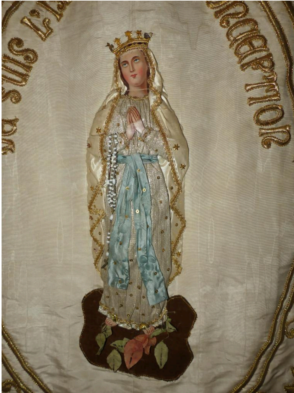
Bannière de procession, détail : ND de Lourdes.