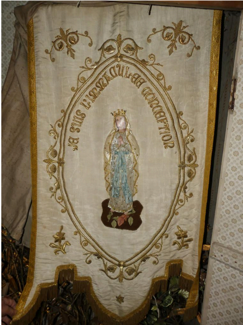
Bannière de procession, vue de face.