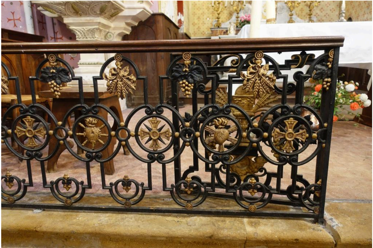
Clôture de choeur (table de communion).