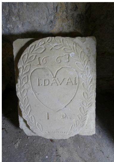
Clavau daté 1663.