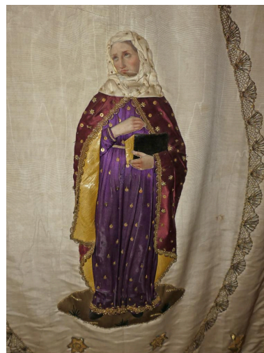
Bannière de procession, détail sainte Geneviève. IVD46_20244603966NUCA