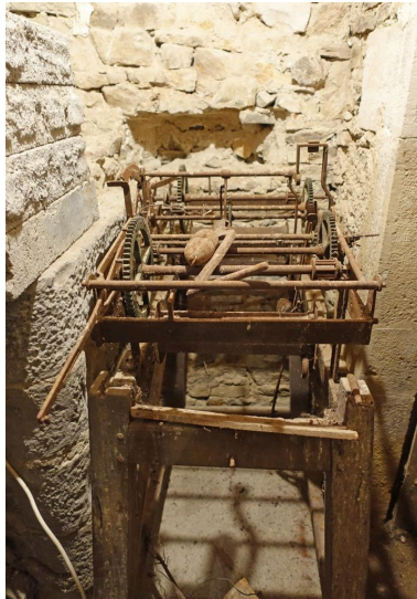
Mécanisme d'horloge. IVD46_20244603880NUCA