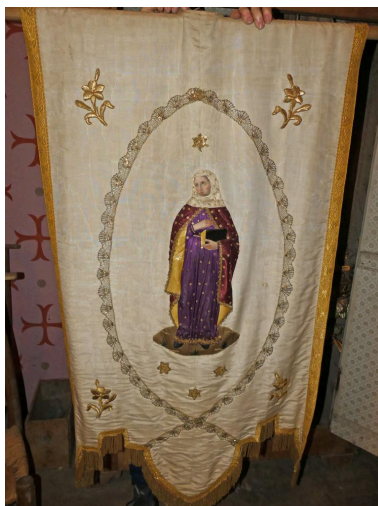
Bannière de procession, vue du dos. IVD46_20244603965NUCA