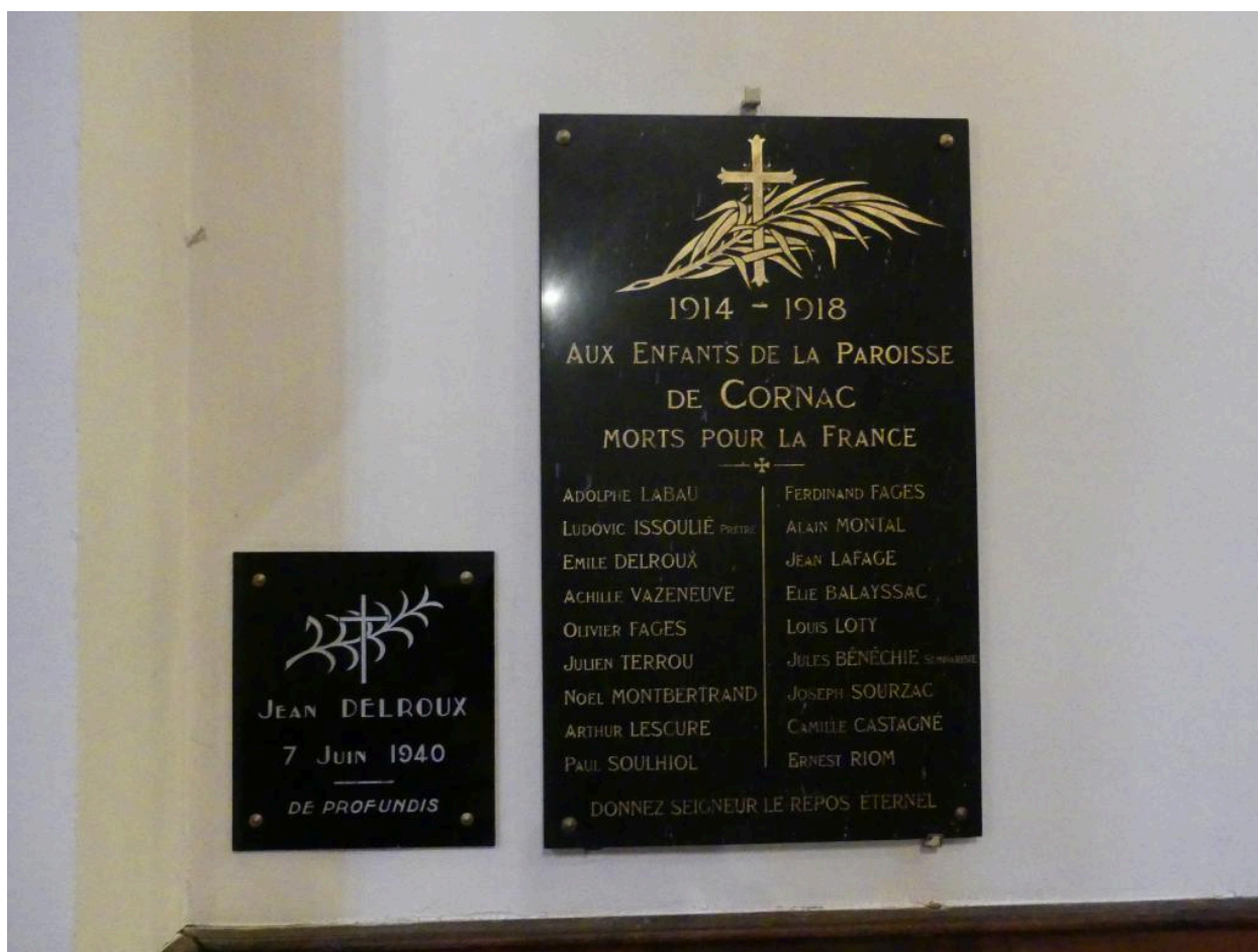
Plaques commémoratives des soldats tués au cours des deux guerres mondiales.