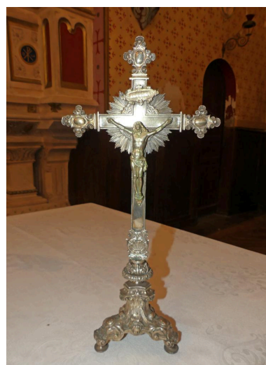
Croix d'autel n°2.