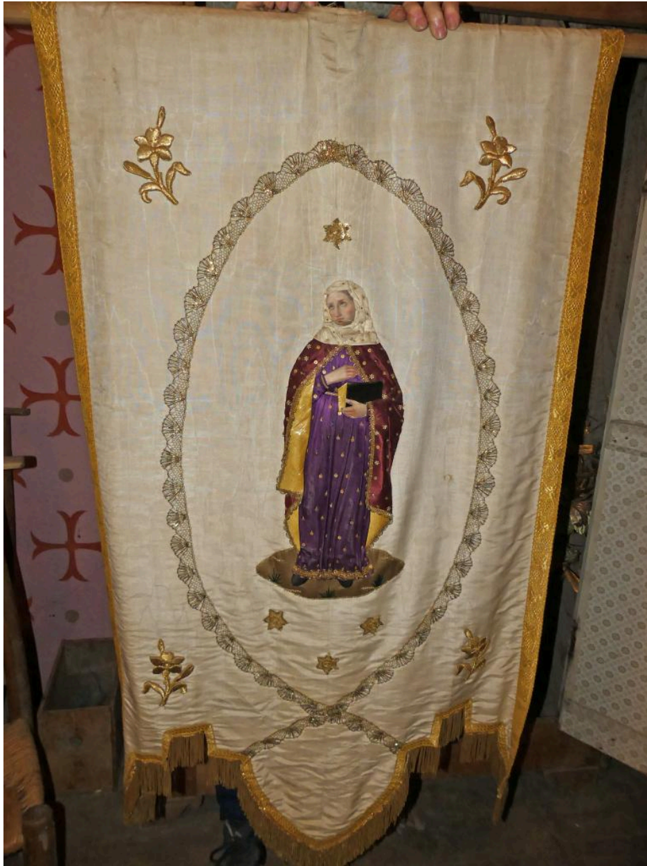
Bannière de procession, vue du dos.