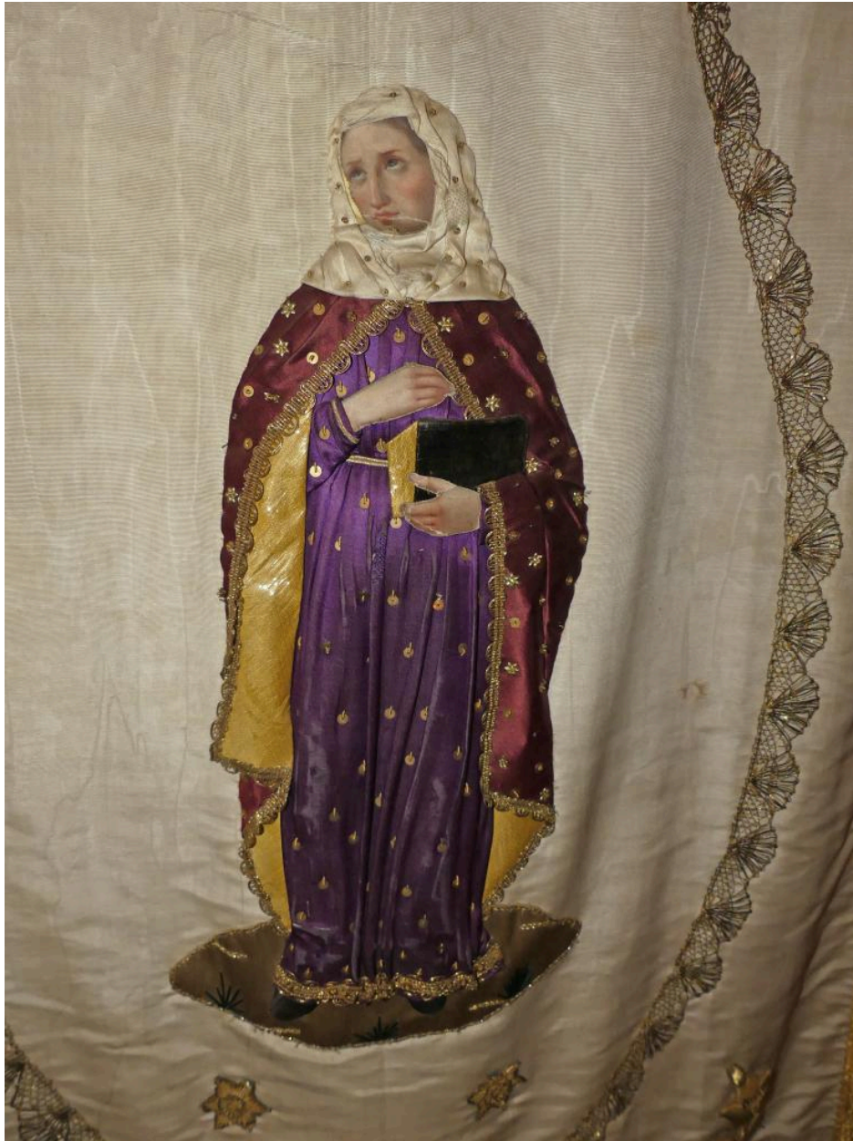
Bannière de procession, détail sainte Geneviève.