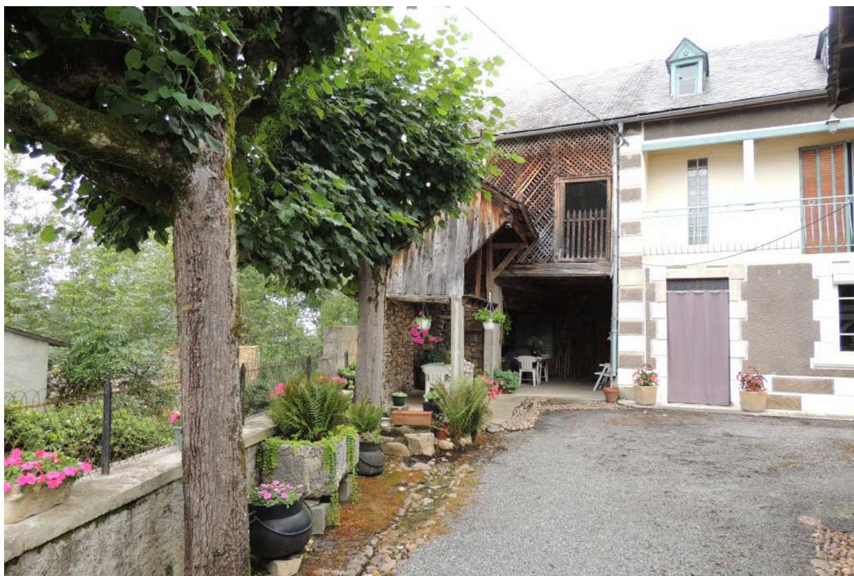
Angle sud-ouest de la cour.