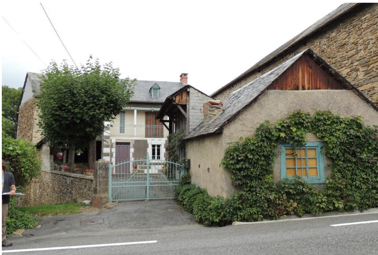
Vue prise du sud-est.