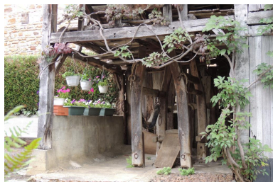
Travail à ferrer les bovins. IVD65_20146500666NUCA