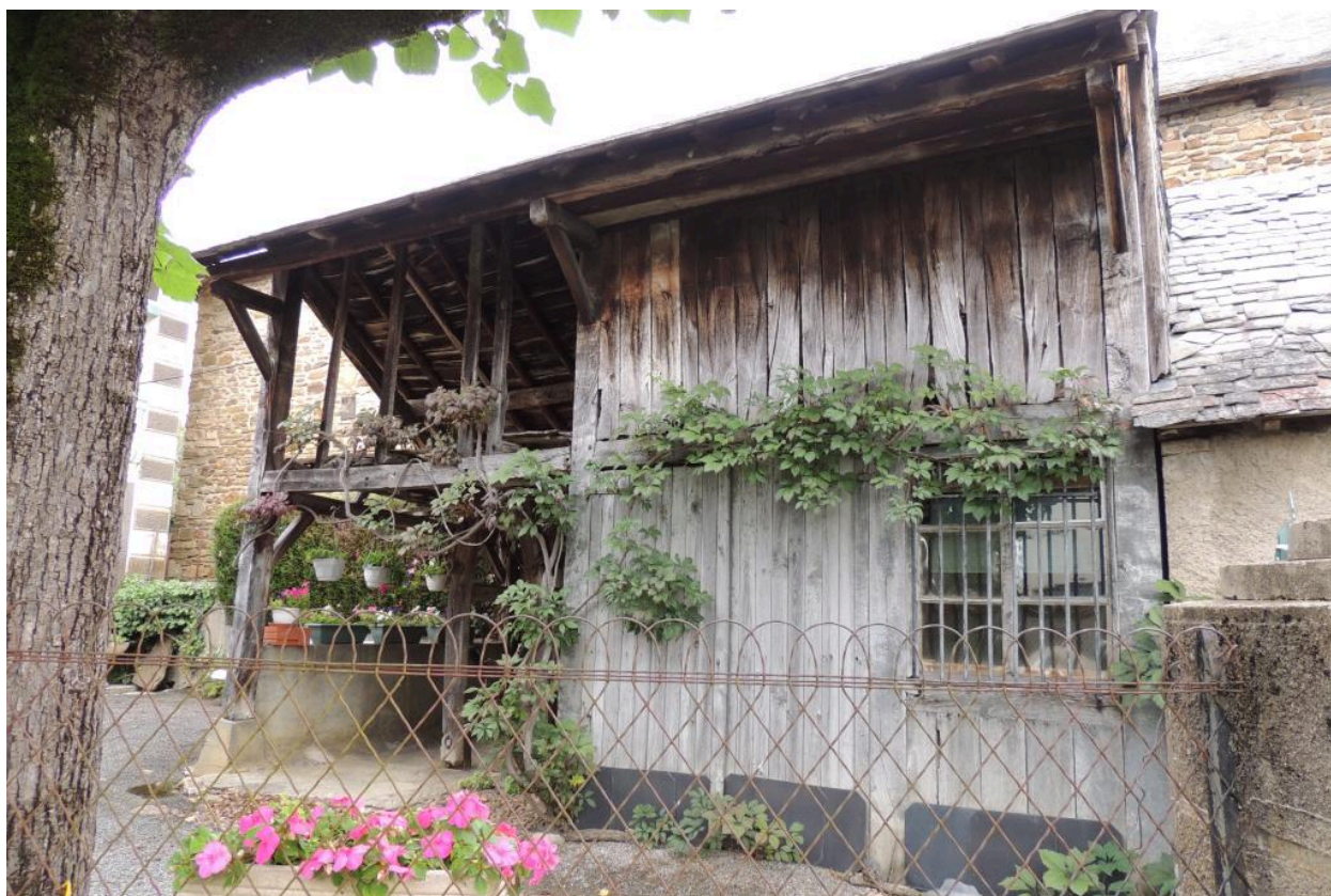
Remise et hangar en bois.