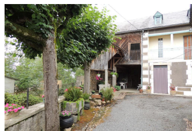
Angle sud-ouest de la cour. IVD65_20146500664NUCA