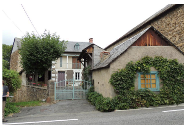
Vue prise du sud-est.