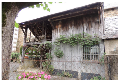
Remise et hangar en bois. IVD65_20146500665NUCA