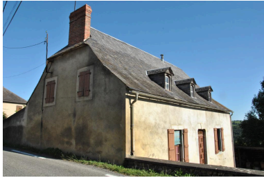
Vue du logis depuis le sud-est.