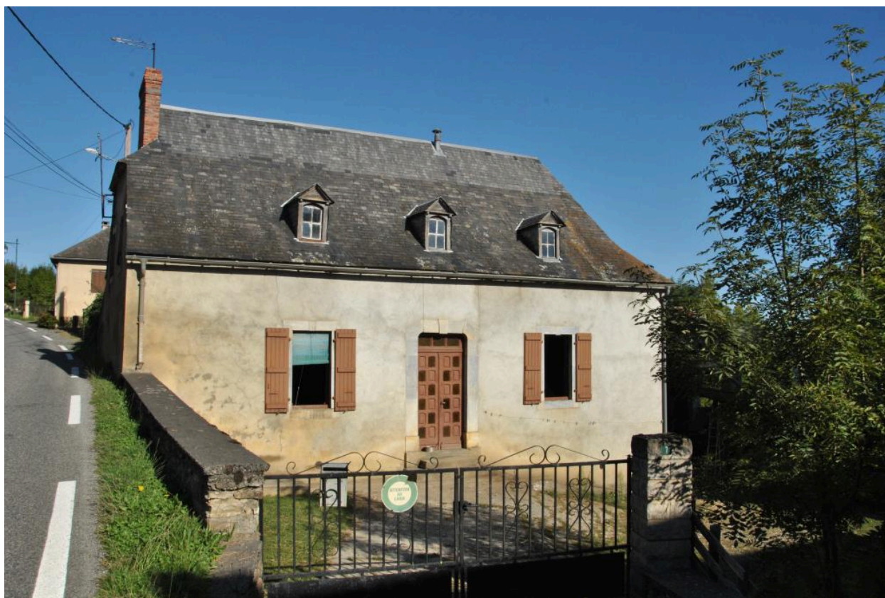
Vue de l'élévation principale depuis l'est.