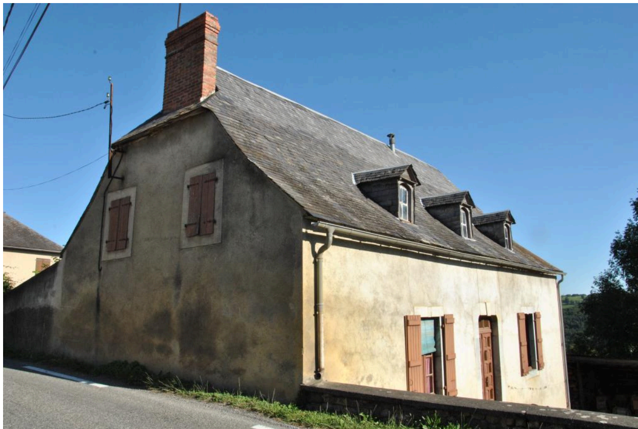
Vue du logis depuis le sud-est.