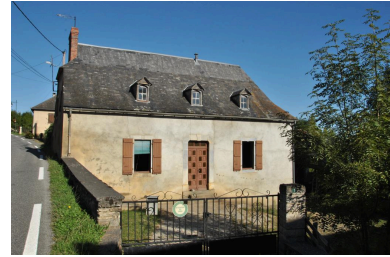
Vue de l'élévation principale depuis l'est. IVD65_20146500442NUCA