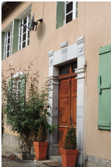
Détail de la façade : porte. IVD65_20146500632NUCA