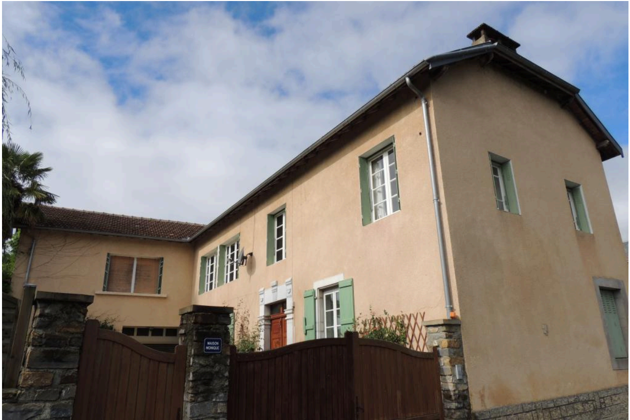
Vue depuis le sud-est.