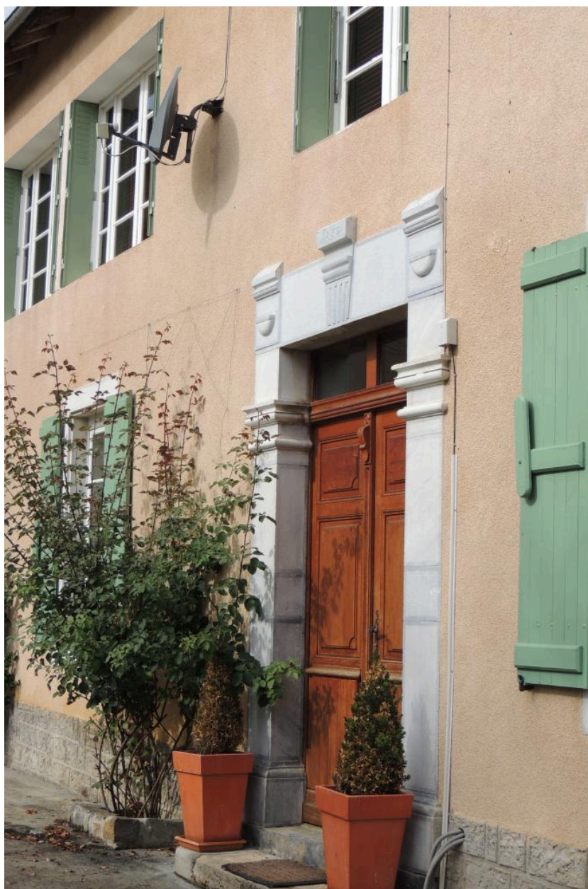
Détail de la façade : porte.