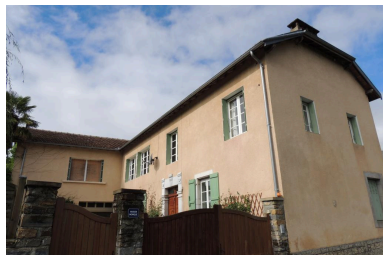
Vue depuis le sud-est. IVD65_20146500631NUCA