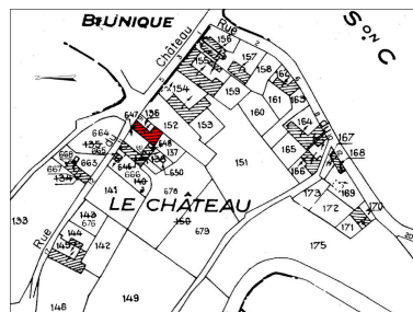
Plan de situation (cadastre 2012). IVD65_20146500677NUCA