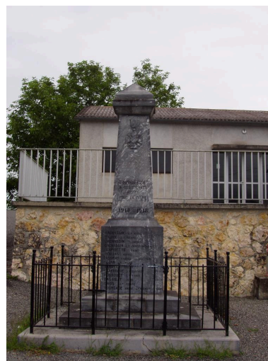
Vue d'ensemble du monument aux morts. IVD65_20116500006NUCA