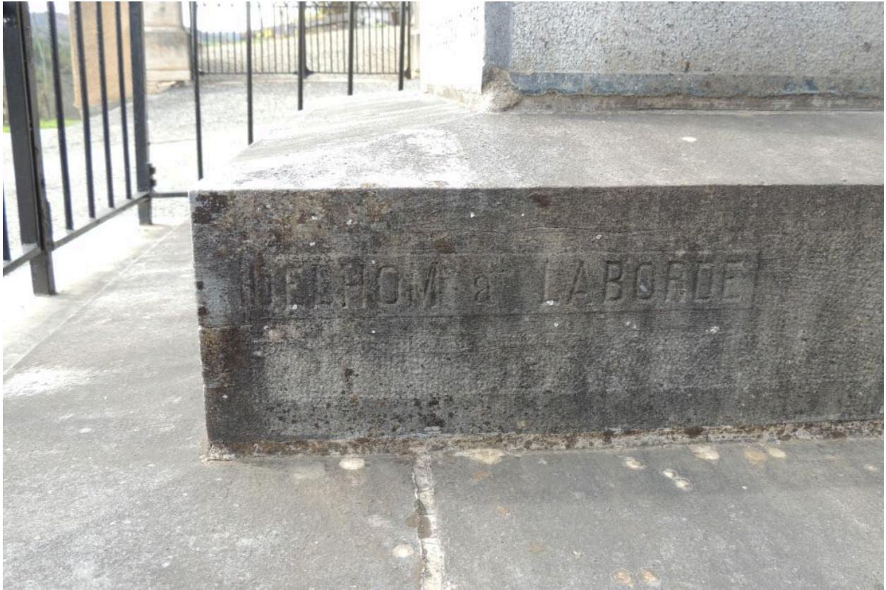
Détail de la signature.