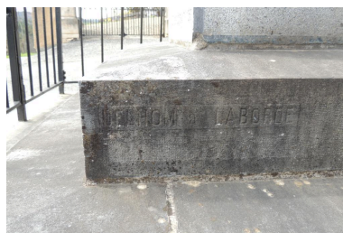
Détail de la signature. IVD65_20136500164NUCA