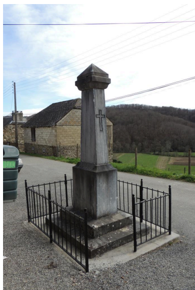
Vue du monument depuis le nord-ouest.