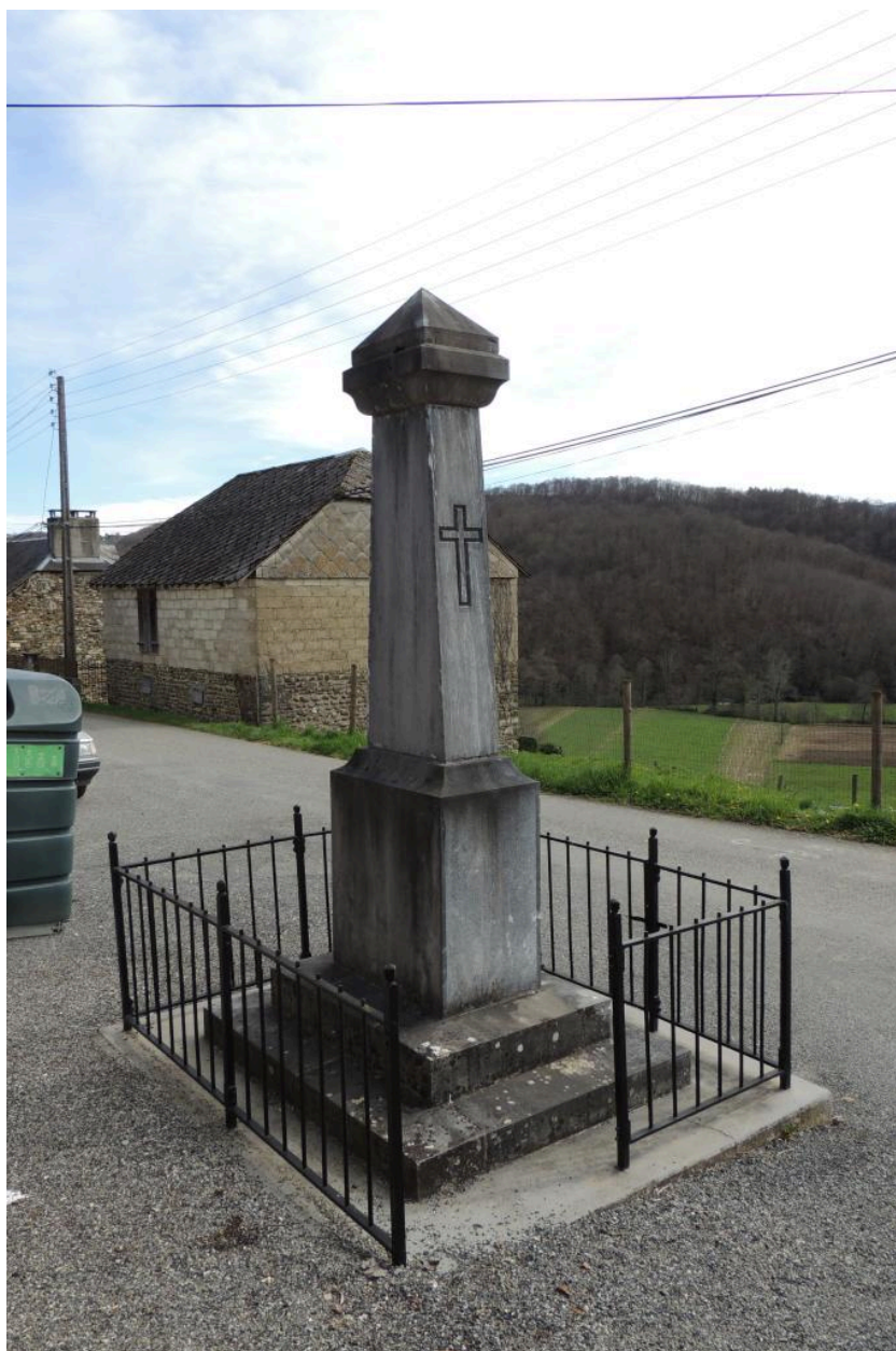
Vue du monument depuis le nord-ouest.