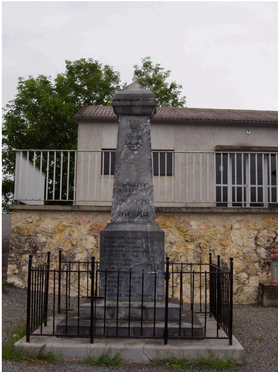
Vue d'ensemble du monument aux morts.