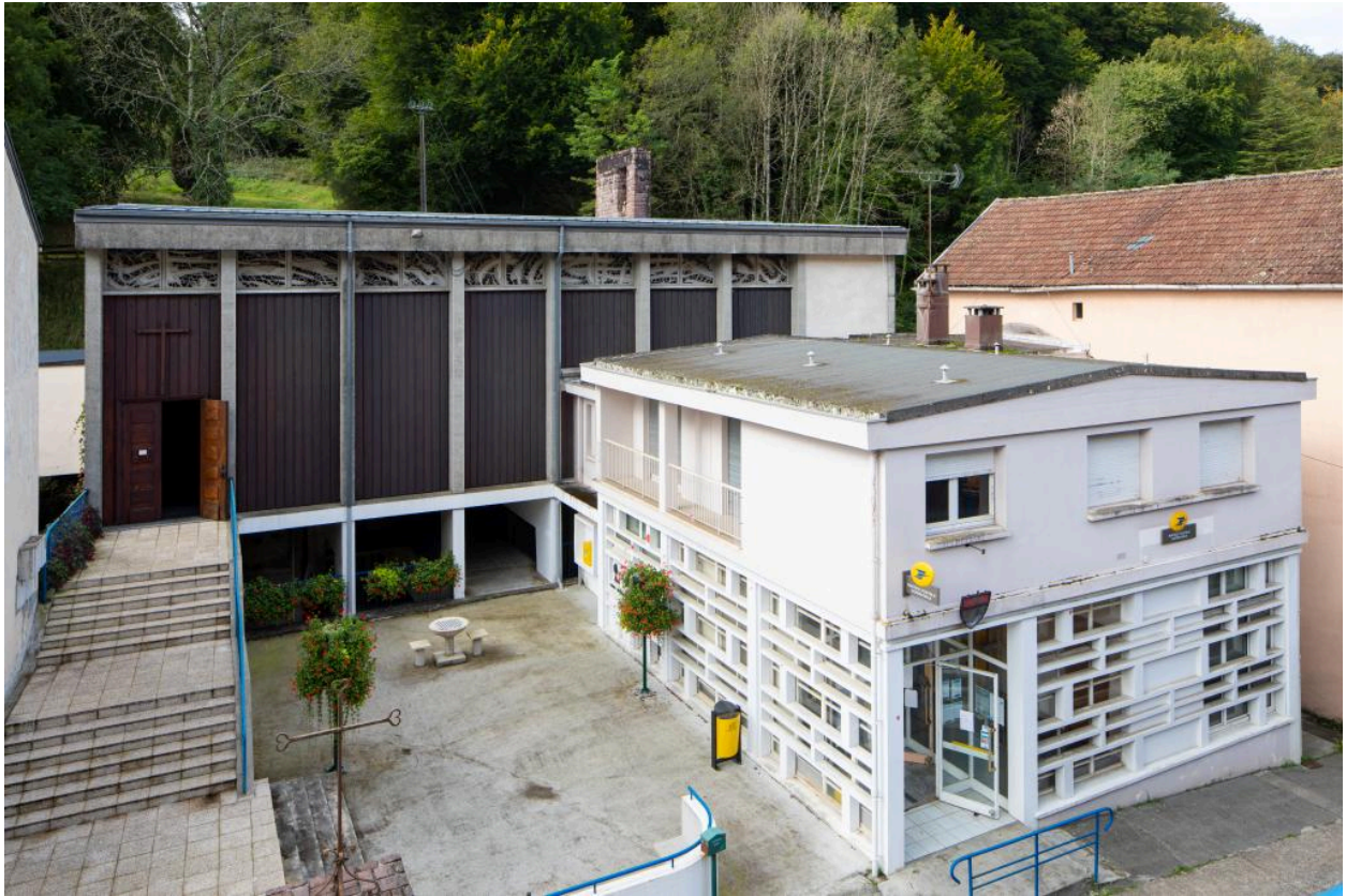
Vue d'ensemble formé par l'église et la poste.