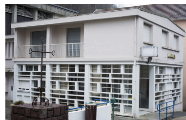
La poste. IVR76_20166550501NUCA