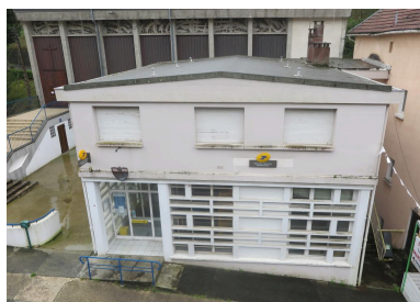
Vue de la façade de la poste depuis le boulevard des Pyrénées.