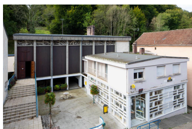
Vue d'ensemble formé par l'église et la poste. IVR76_20216550048NUCA