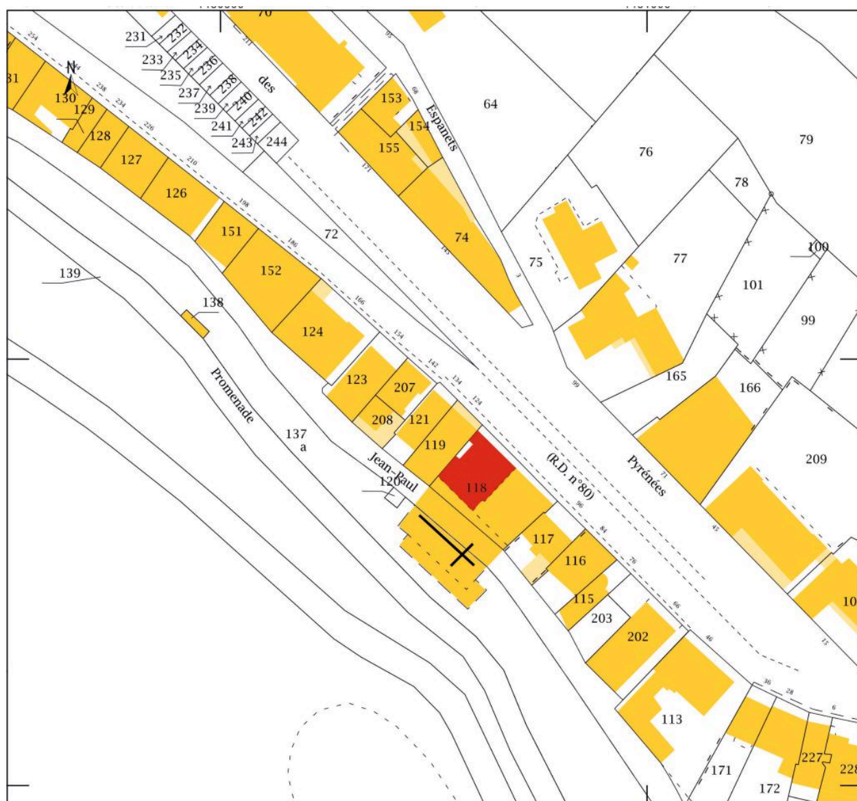
Plan de situation (cadastre 2020).