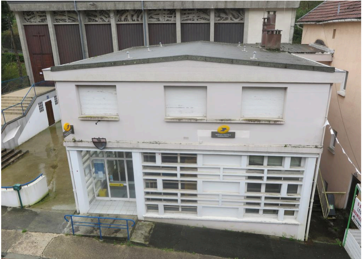
Vue de la façade de la poste depuis le boulevard des Pyrénées.