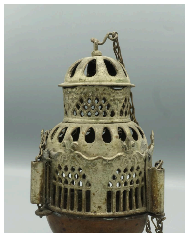
Détail de la partie supérieure.