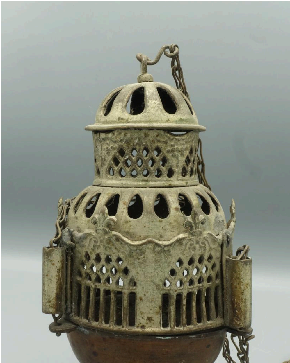
Détail de la partie supérieure.