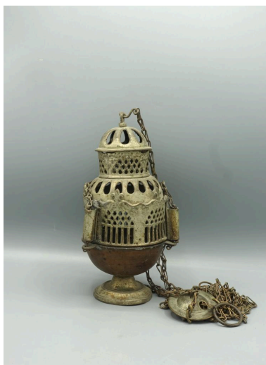
Vue générale. IVD46_20244601360NUCA