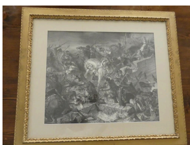
Estampe (La bataille de Taillebourg). IVR76_20243490100NUCA