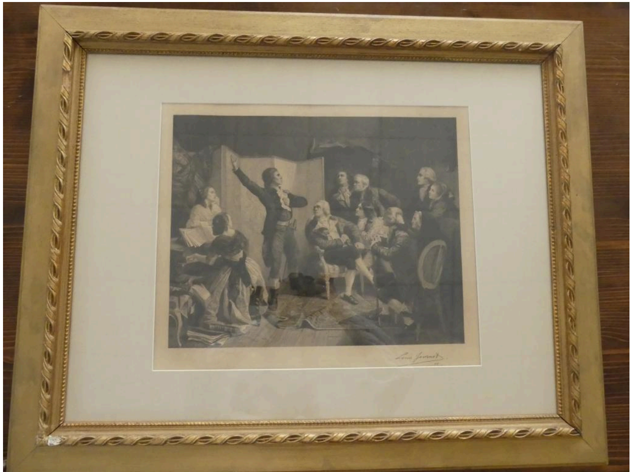
Estampe (Rouget de l'Isle chantant pour la première fois la Marseillaise chez Dietrick, maire de Strasbourg).