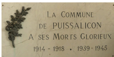
Plaque commémorative des guerres de 1918-1918 et 1939-1945.