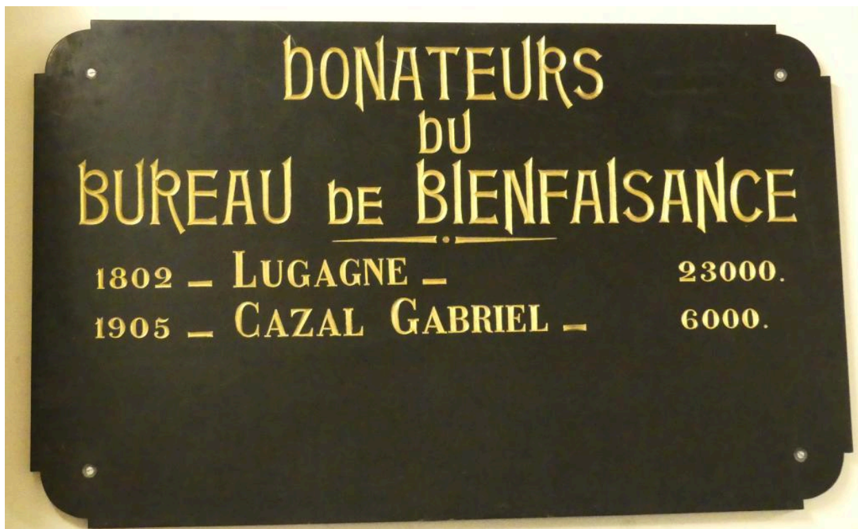
Plaque commémorative du bureau de bienfaisance.