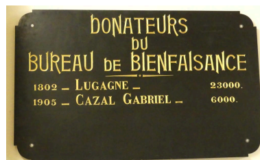
Plaque commémorative du bureau de bienfaisance.