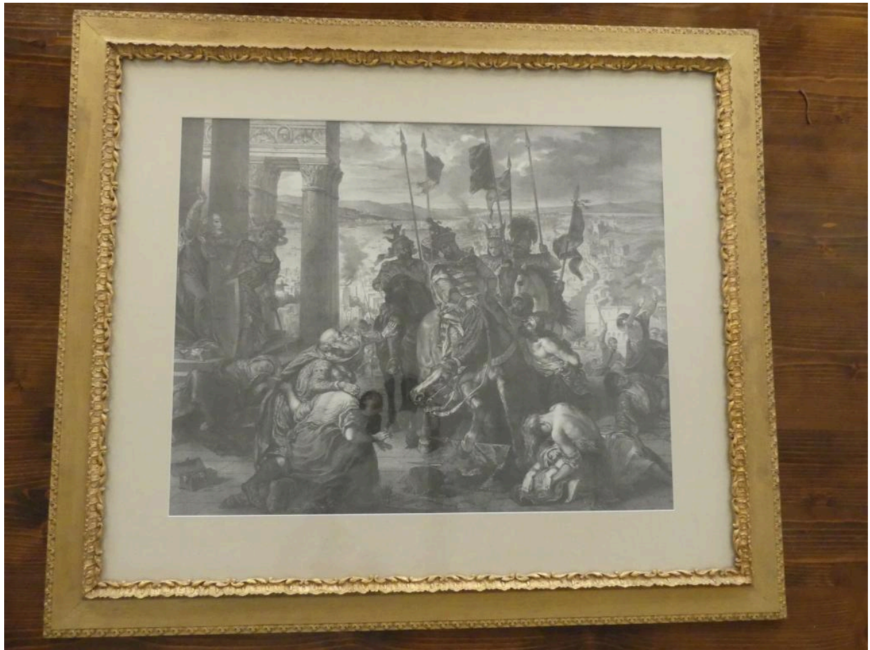
Estampe (Prise de Constantinople par les Croisés).