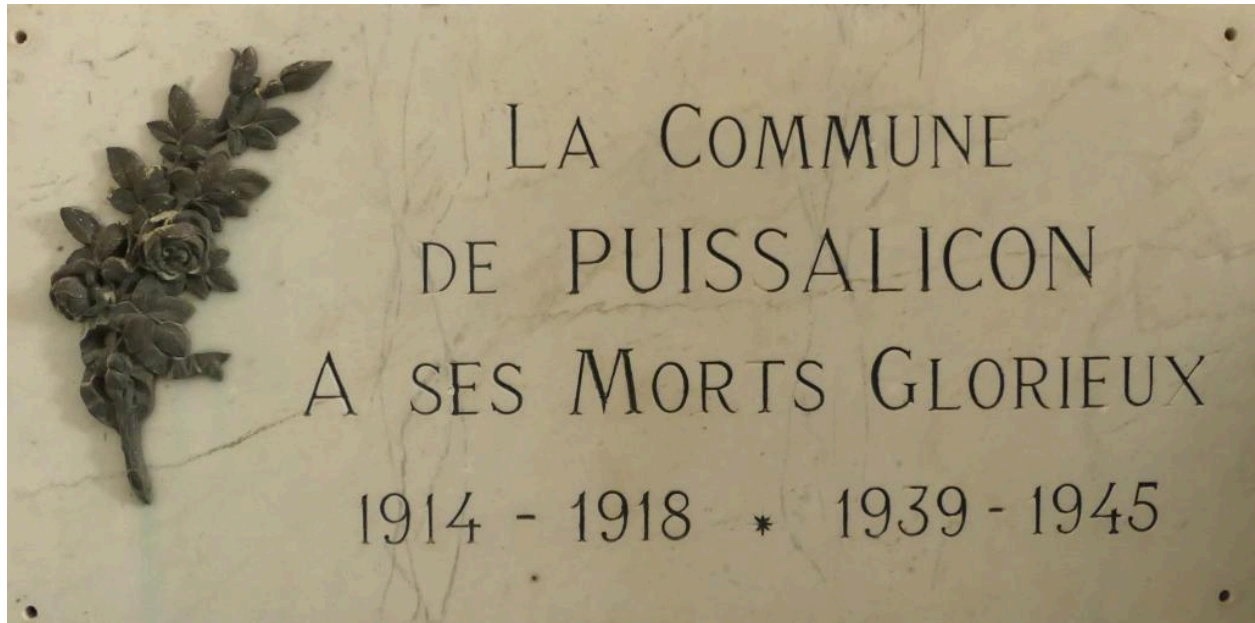
Plaque commémorative des guerres de 1914-1918 et 1939-1945.