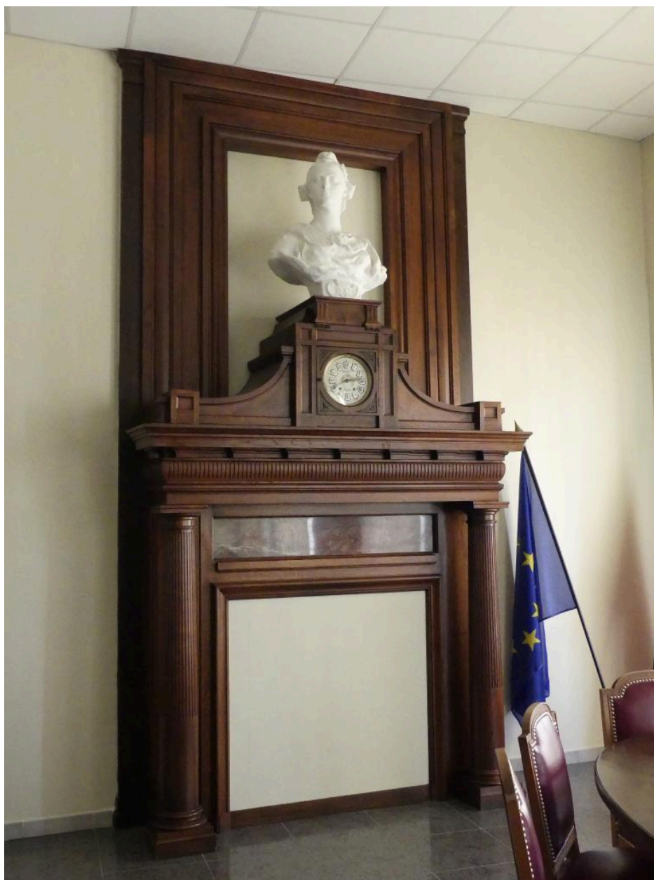
Manteau et trumeau de cheminée.