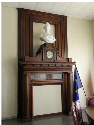
Manteau et trumeau de cheminée. IVR76_20243490105NUCA