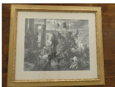
Estampe (Prise de Constantinople par les Croisés).