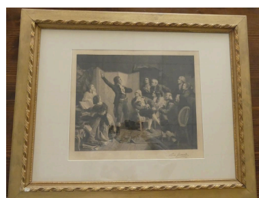
Estampe (Rouget de l'Isle chantant pour la première fois la Marseillaise chez Dietrick, maire de Strasbourg).