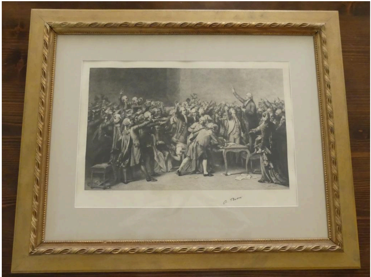
Estampe (Le Serment du Jeu de Paume).