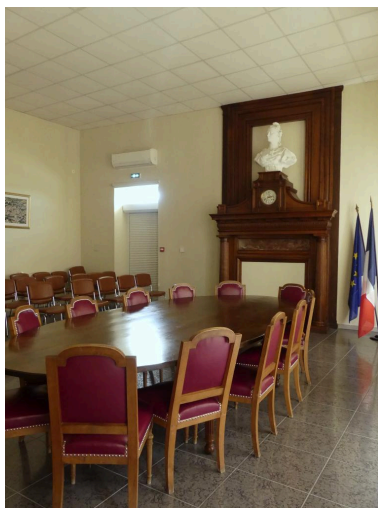
Vue d'ensemble. IVR76_20243490106NUCA