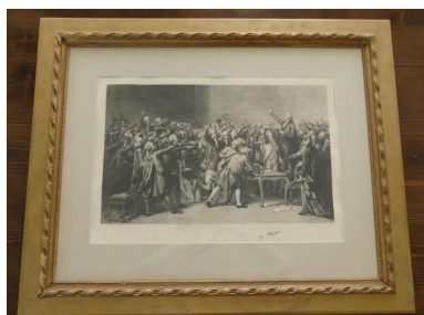
Estampe (Le Serment du Jeu de Paume). IVR76_20243490102NUCA