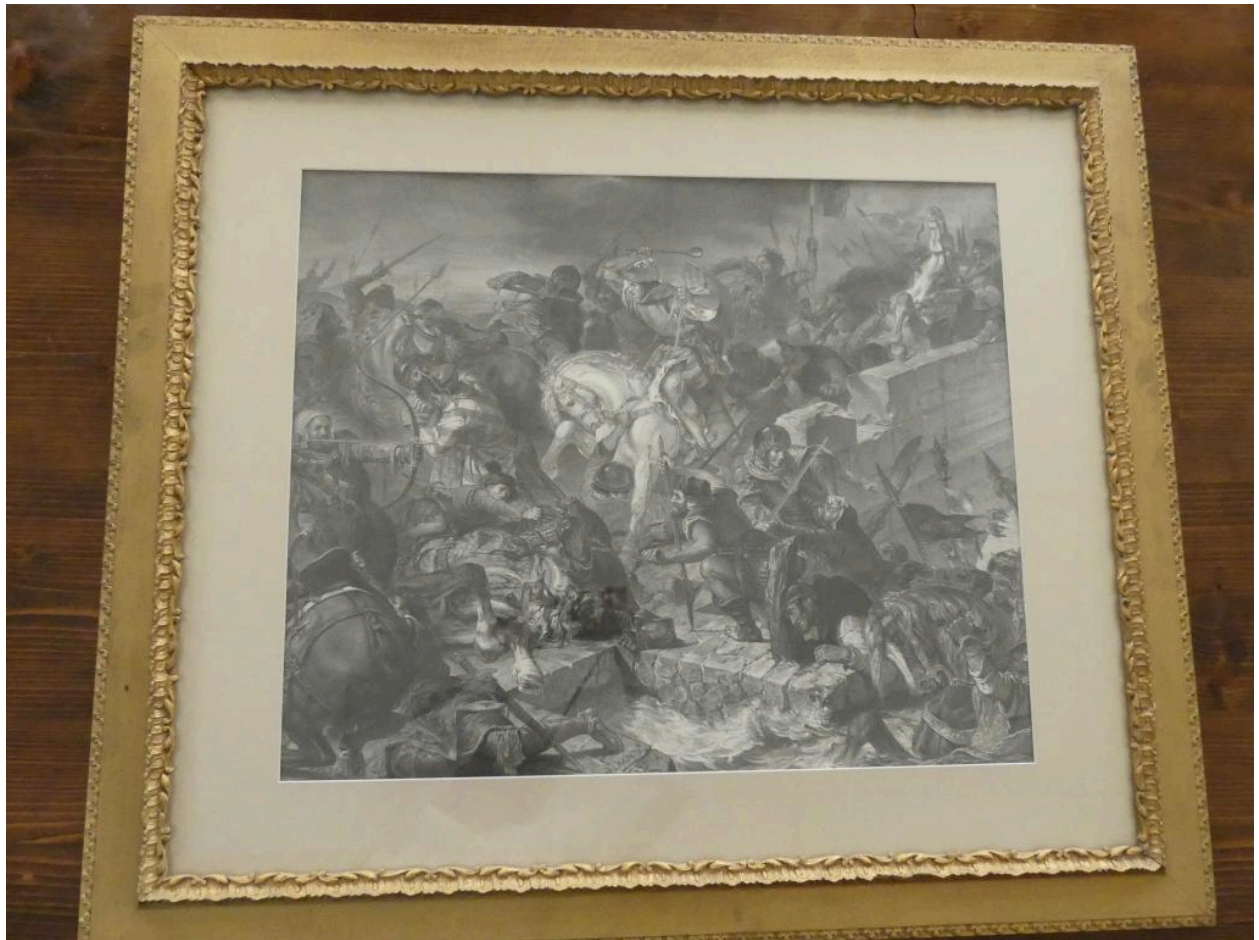
Estampe (La bataille de Taillebourg).