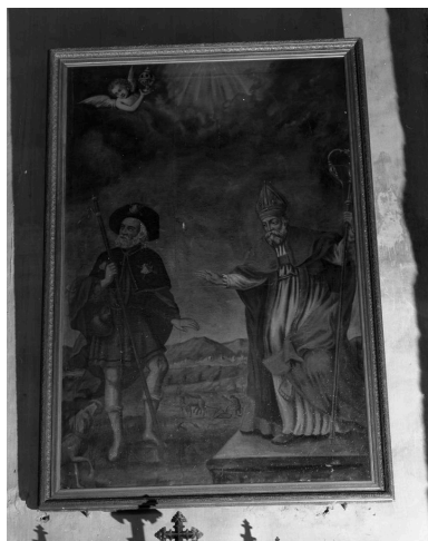
Peinture : Saint- Jacques et Saint évêque. IVR91_19691101134X