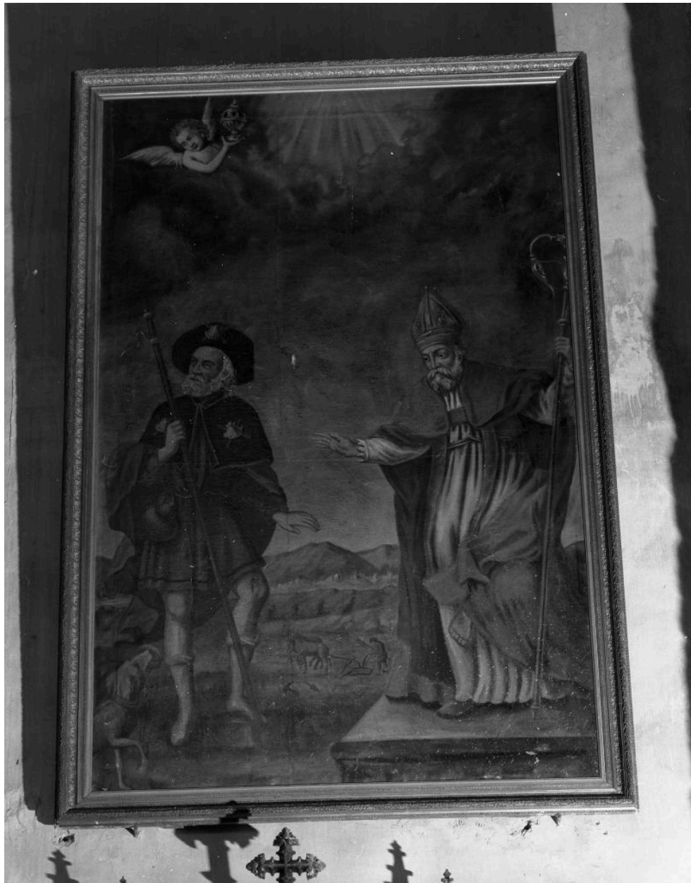
Peinture : Saint-Jacques et Saint évêque.