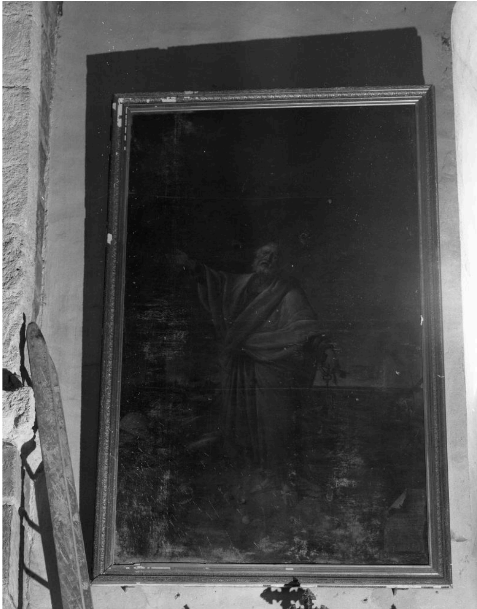
Tableau : saint Pierre.