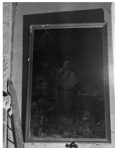
Tableau : saint Pierre.