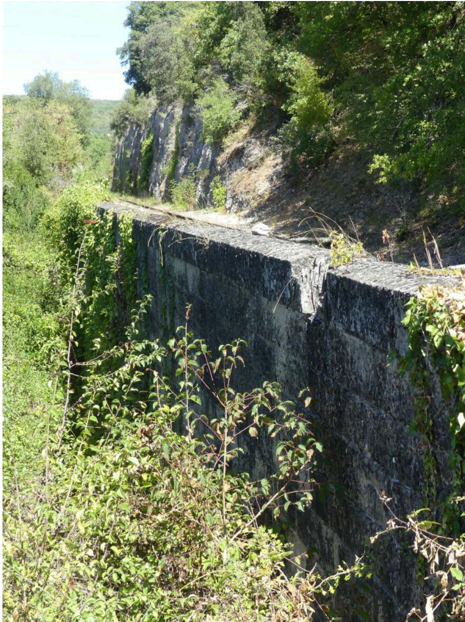
Mur de soutènement (M12).