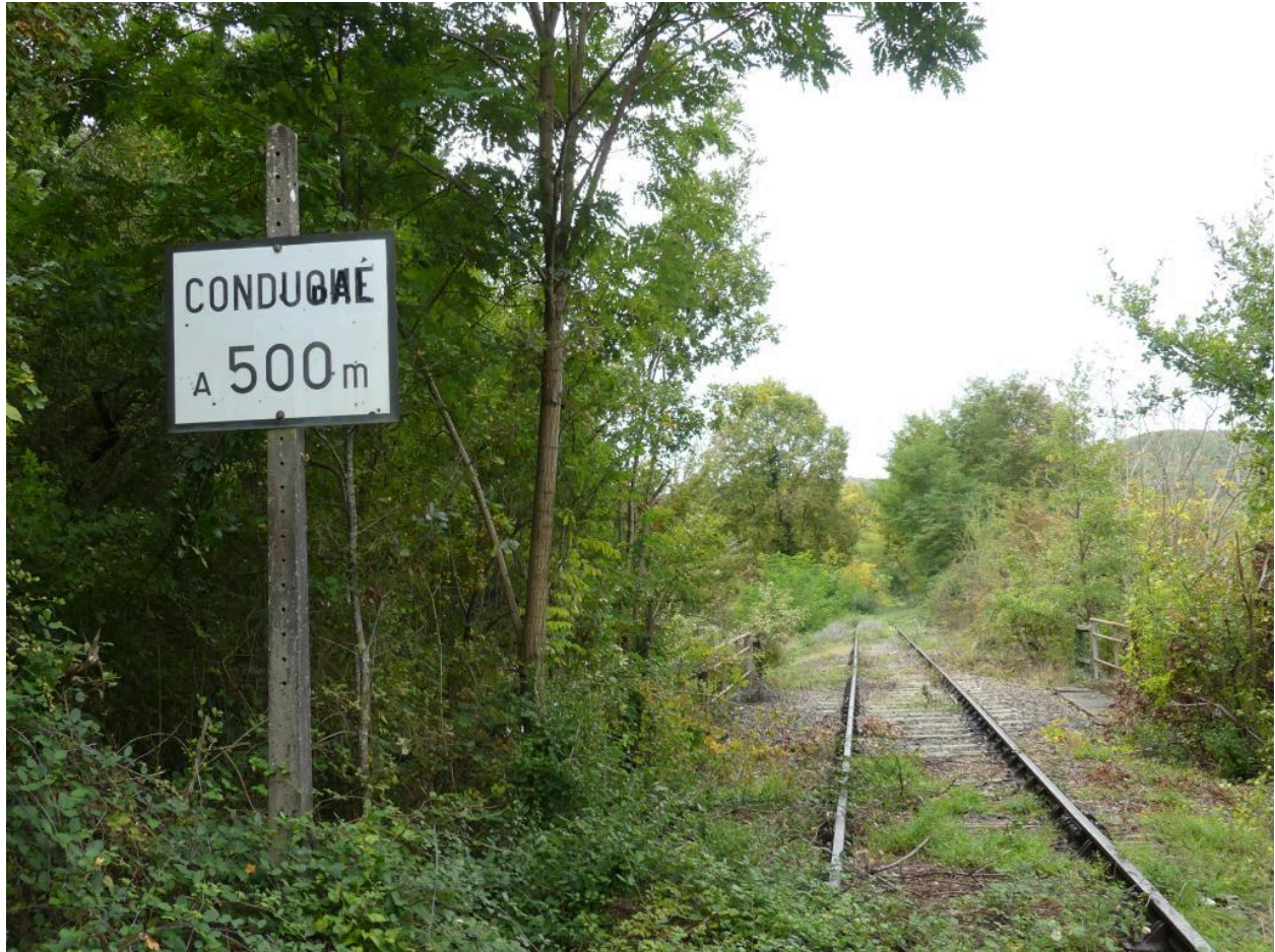
Panneau de signalisation, à 500 m de la gare de Conduché.