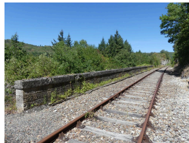
Mur de soutènement (M12).