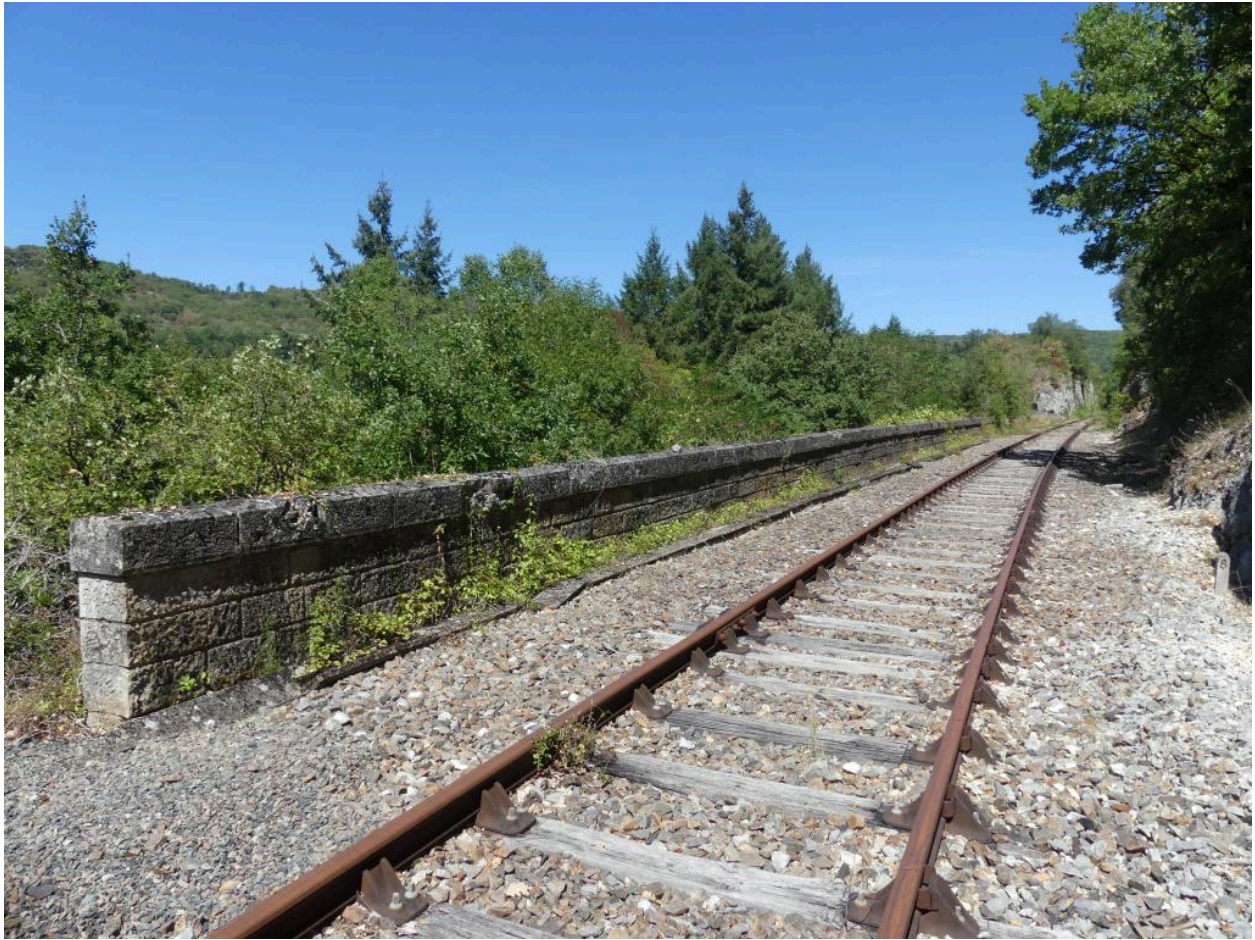
Mur de soutènement (M12).