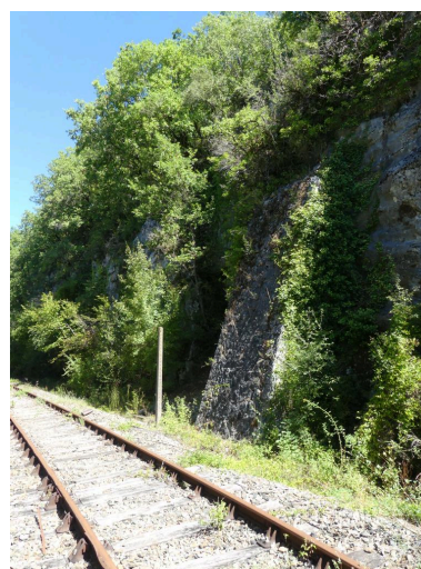
Contrefort. IVD46_20244600076NUCA