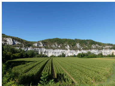
Vue depuis le PN 413.