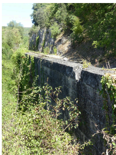
Mur de soutènement (M12). IVD46_20244600074NUCA