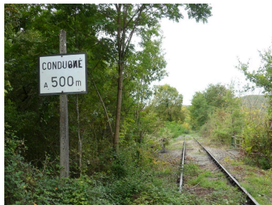
Panneau de signalisation, à 500 m de la gare de Conduché. IVD46_20244600067NUCA