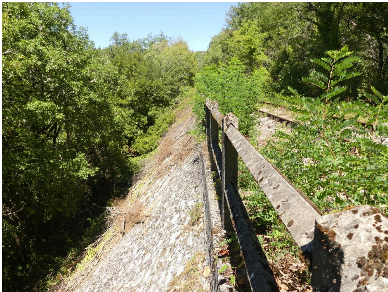
Mur de soutènement (M13).