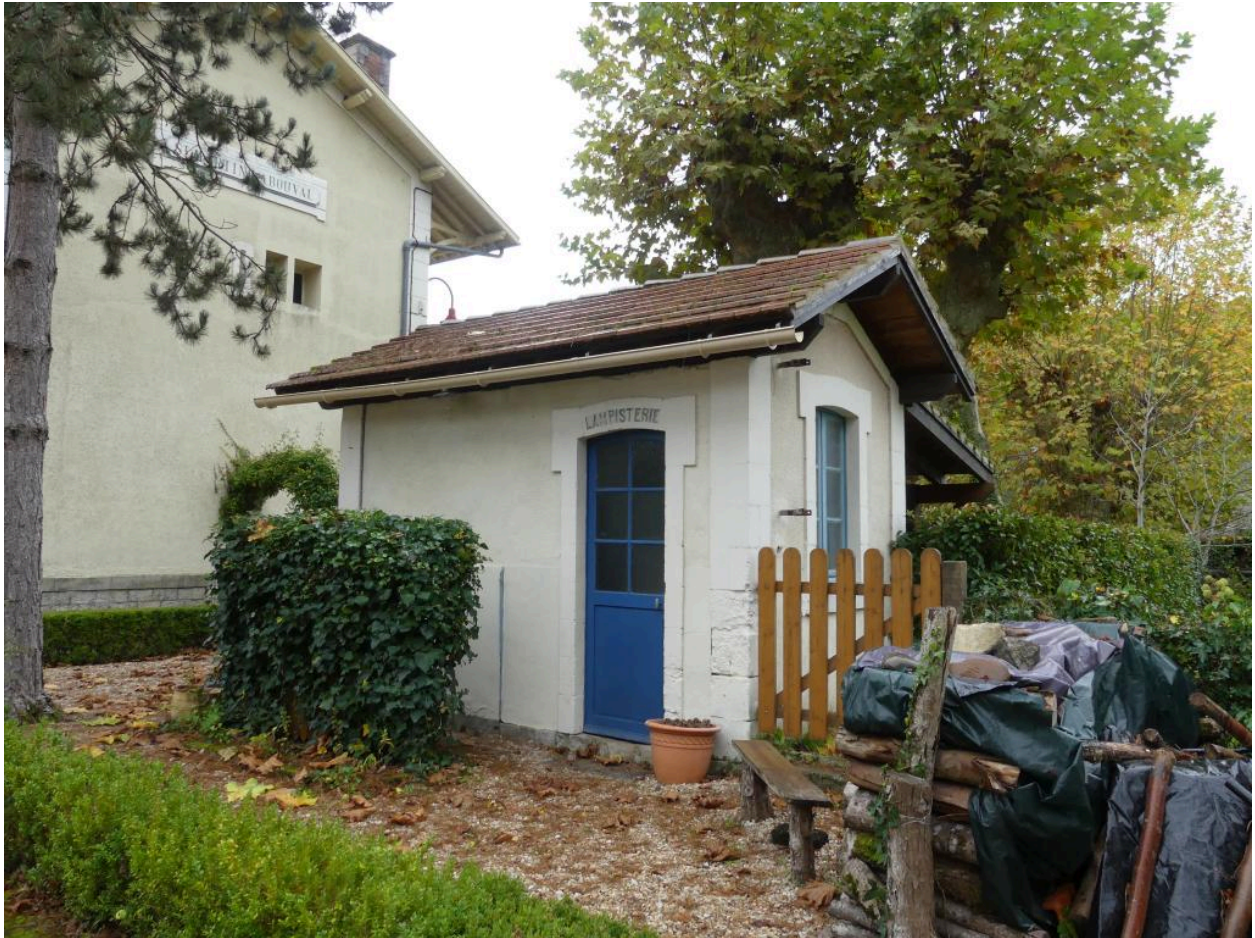
Toilettes et lampisterie, vue depuis le nord.