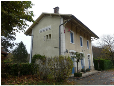
Bâtiment des voyageurs, vue depuis l'ouest.