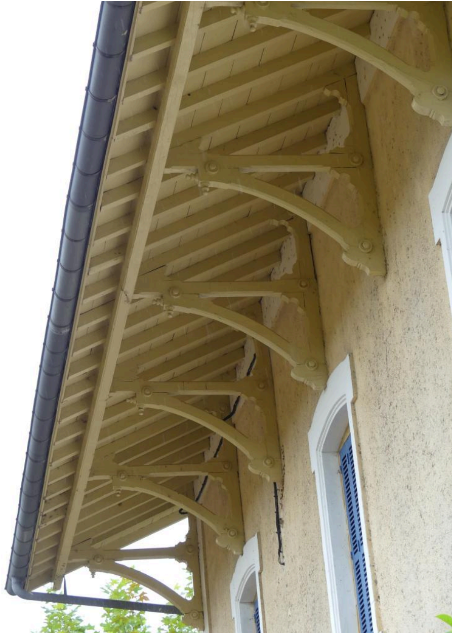
Bâtiment des voyageurs, élévation sud-ouest : aisseliers.