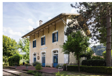
Elévation sur la voie.