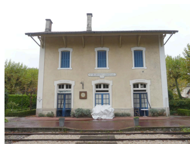
Bâtiment des voyageurs, élévation nord-est.