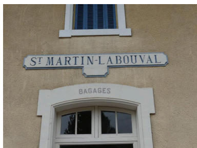
Bâtiment des voyageurs, élévation nord-est : cartouche contenant le nom de la station. IVD46_20214605022NUCA