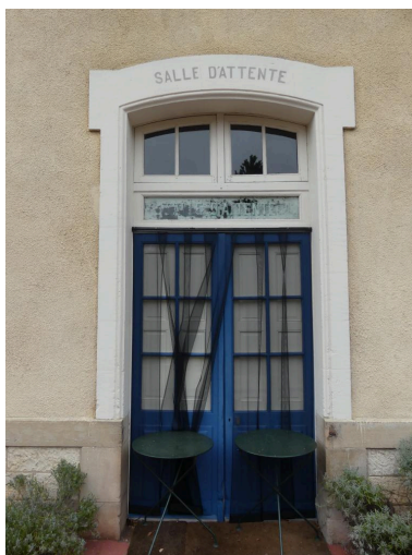
Bâtiment des voyageurs, élévation nord-est : entrée de la salle d'attente. IVD46_20214605005NUCA