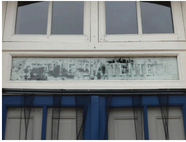
Bâtiment des voyageurs, élévation nord-est : cartouche indiquant l'accès à la salle d'attente. IVD46_20214605019NUCA