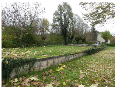
Vestiges de la rampe des halles à marchandises disparues. IVD46_20214605020NUCA