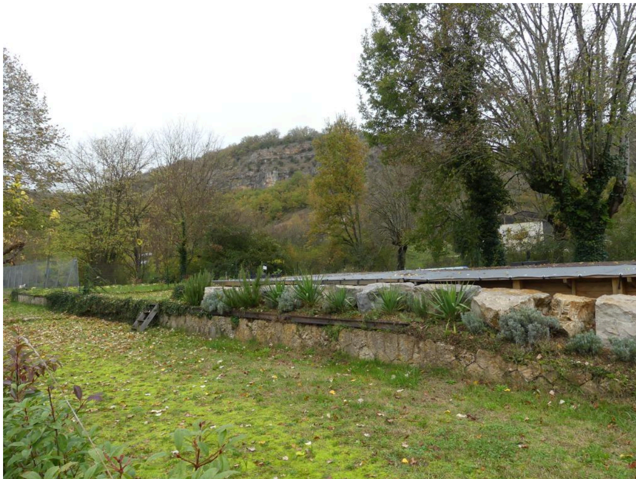
Vestiges de la rampe des halles à marchandises disparues.