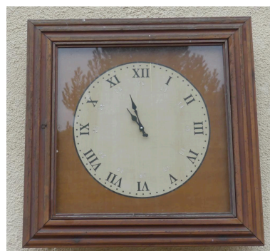
Bâtiment des voyageurs, élévation nord-est : horloge murale. IVD46_20214605011NUCA