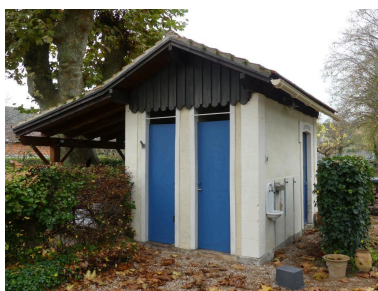
Toilettes et lampisterie, pignon sud-est : porte des toilettes. IVD46_20214605007NUCA