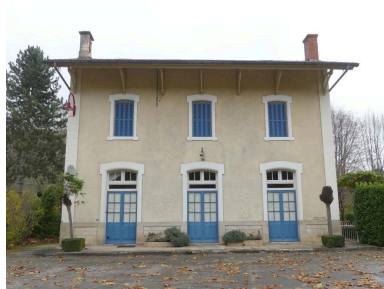
Bâtiment des voyageurs, élévation sud-ouest. IVD46_20214605017NUCA