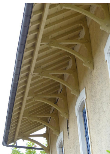
Bâtiment des voyageurs, élévation sud-ouest : aisseillers. IVD46_20214605003NUCA