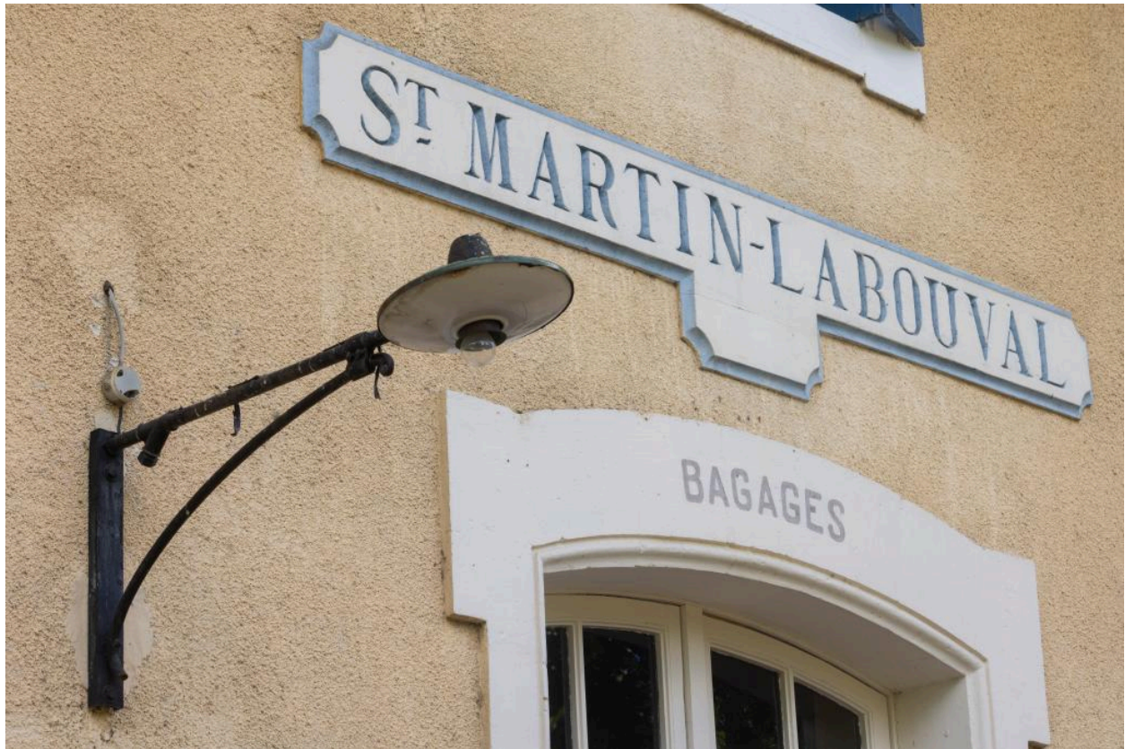
Elévation sur la voie : cartouche contenant le nom de la gare.