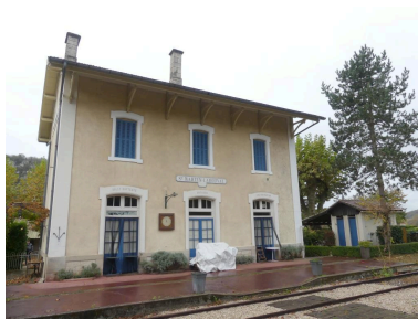
Bâtiment des voyageurs, élévation nord-est. IVD46_20214605013NUCA