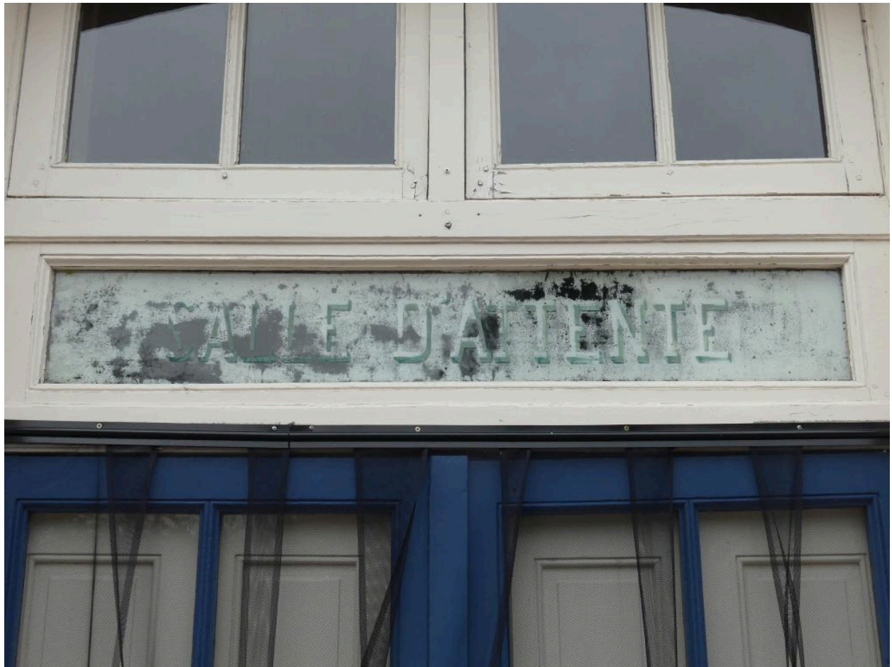
Bâtiment des voyageurs, élévation nord-est : cartouche indiquant l'accès à la salle d'attente.