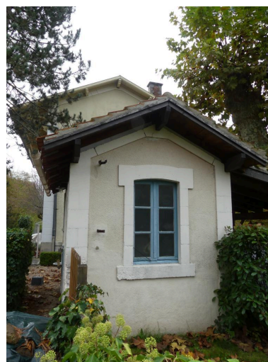
Toilettes et lampisterie, élévation nord-ouest. IVD46_20214605018NUCA