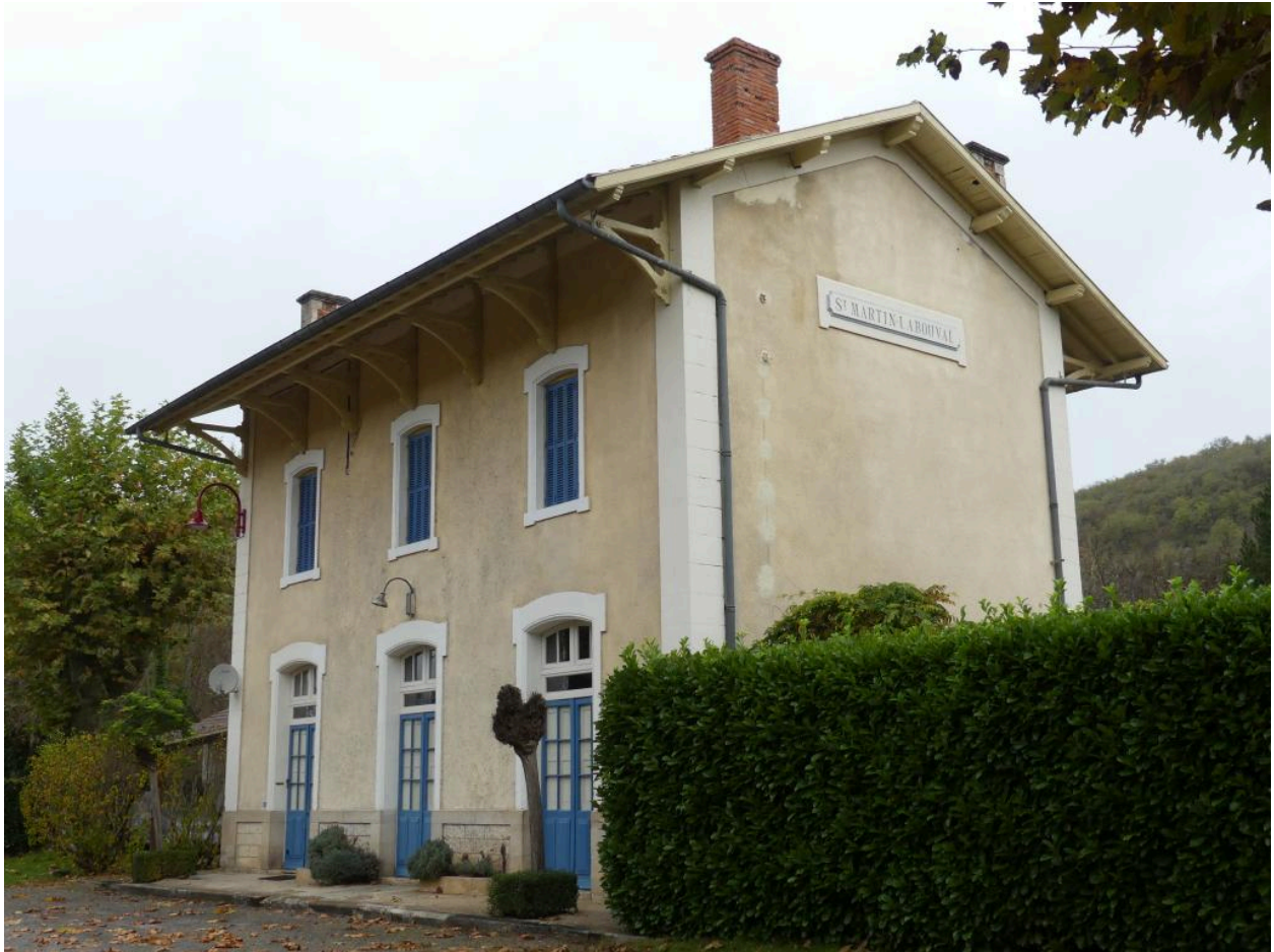
Bâtiment des voyageurs, vue depuis le sud-est.