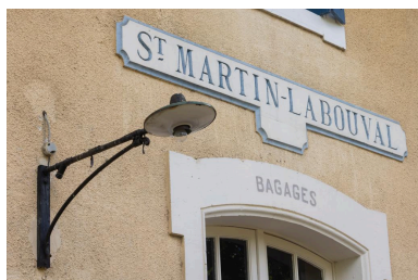
Elévation sur la voie : cartouche contenant le nom de la gare. IVR76_20244650189NUCA