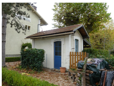
Toilettes et lampisterie, vue depuis le nord.