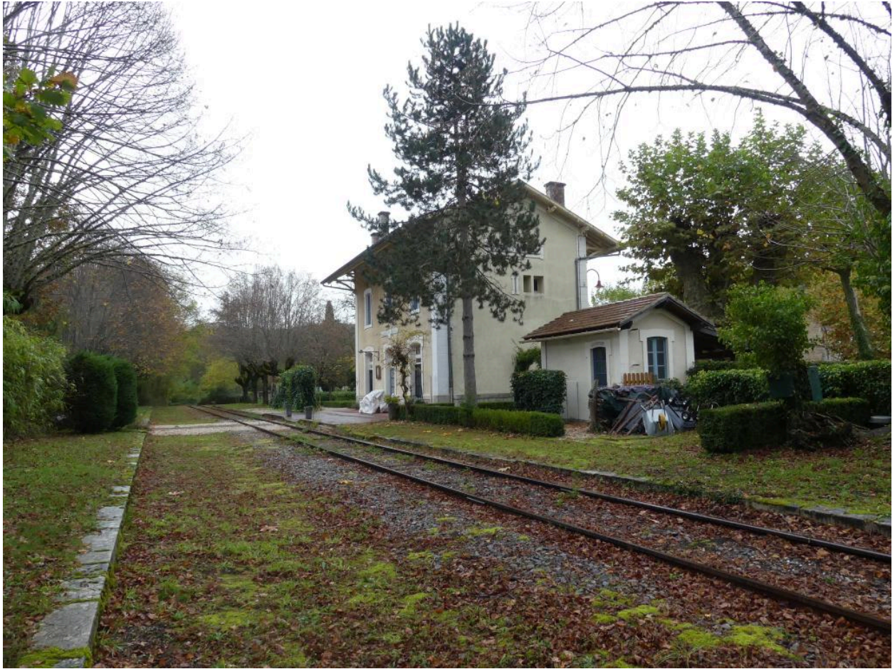
Vue depuis le nord-ouest.