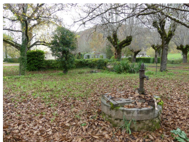
Jardin avec puits. IVD46_20214605001NUCA

IVD46_20214605002NUCA