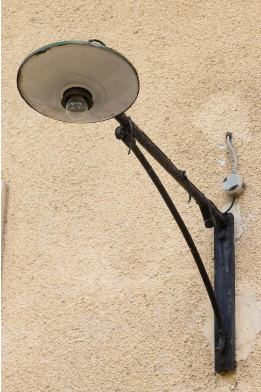
Elévation sur la voie : lampe extérieure.