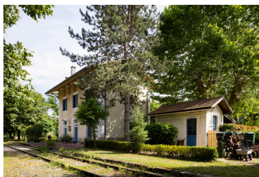
Elévation sur la voie.