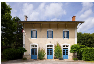
Elévation sur cour. IVR76_20244650184NUCA