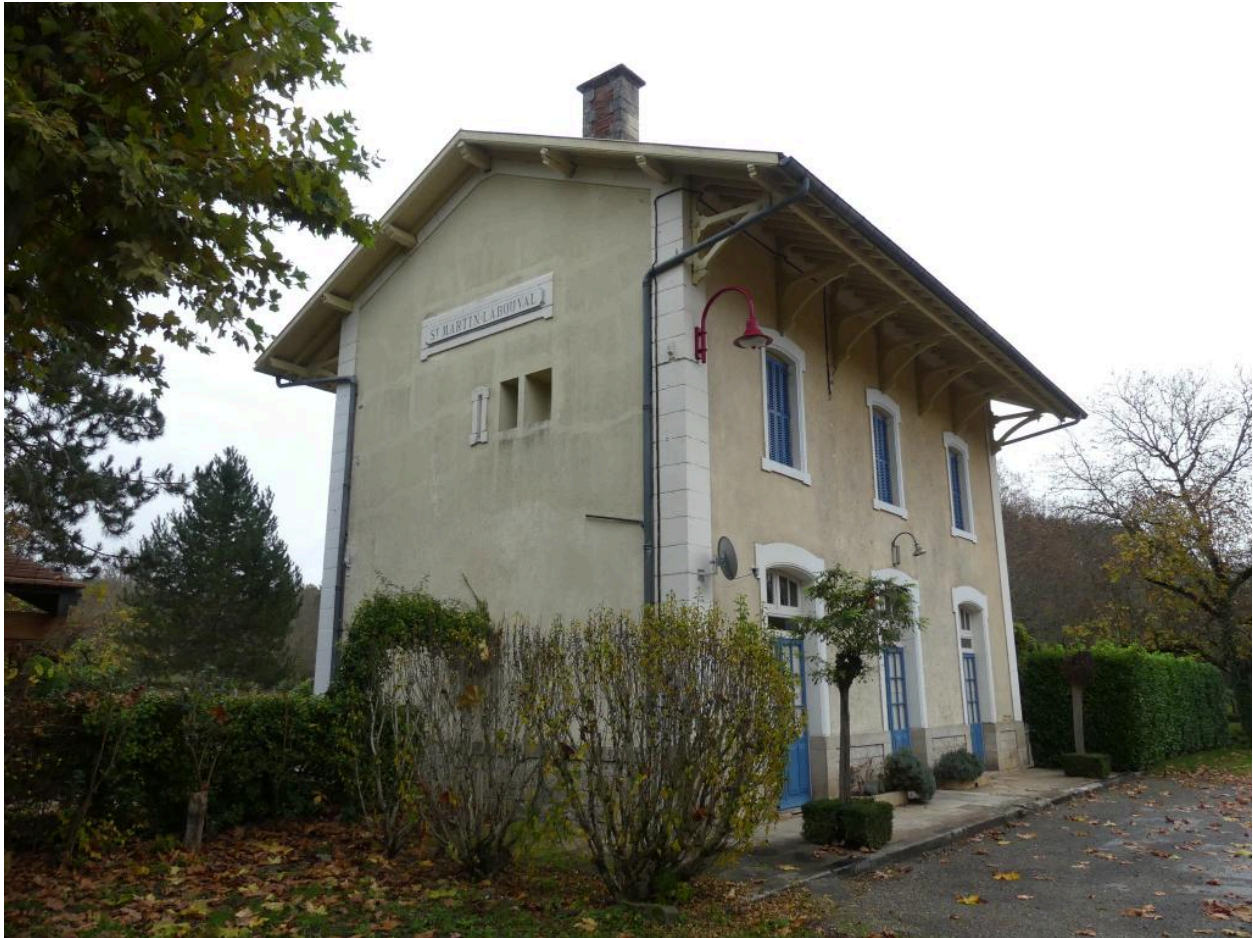
Bâtiment des voyageurs, vue depuis l'ouest.