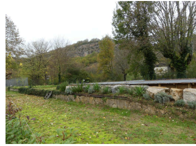
Vestiges de la rampe des halles à marchandises disparues.