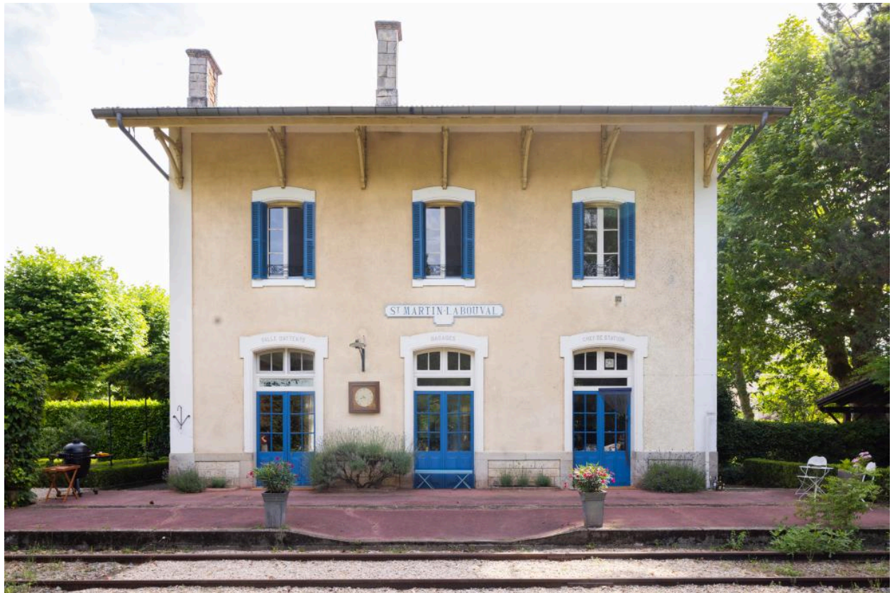
Elévation sur la voie.