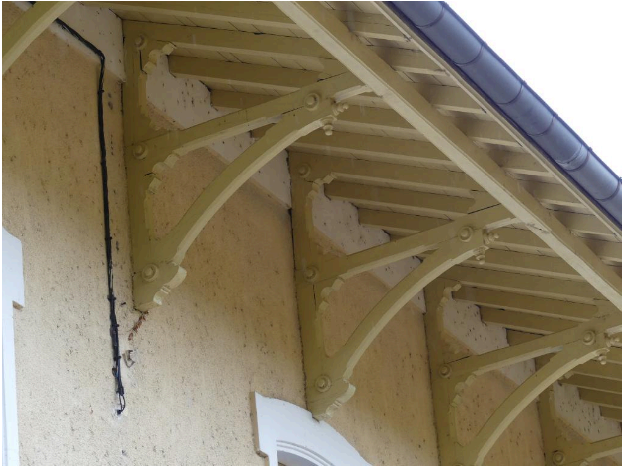
Bâtiment des voyageurs, élévation sud-ouest : aisseliers.