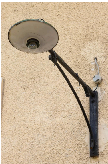
Elévation sur la voie : lampe extérieure. IVR76_20244650190NUCA