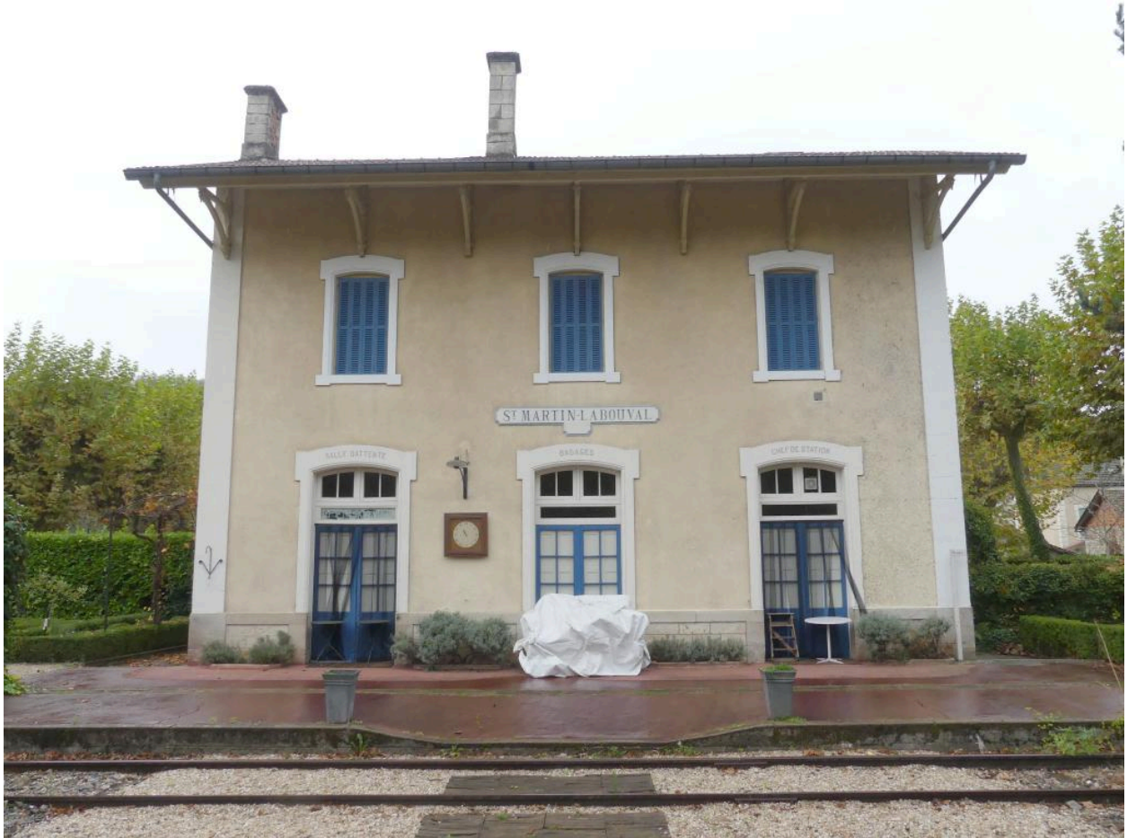
Bâtiment des voyageurs, élévation nord-est.