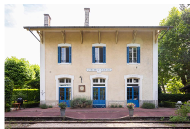
Elévation sur la voie.