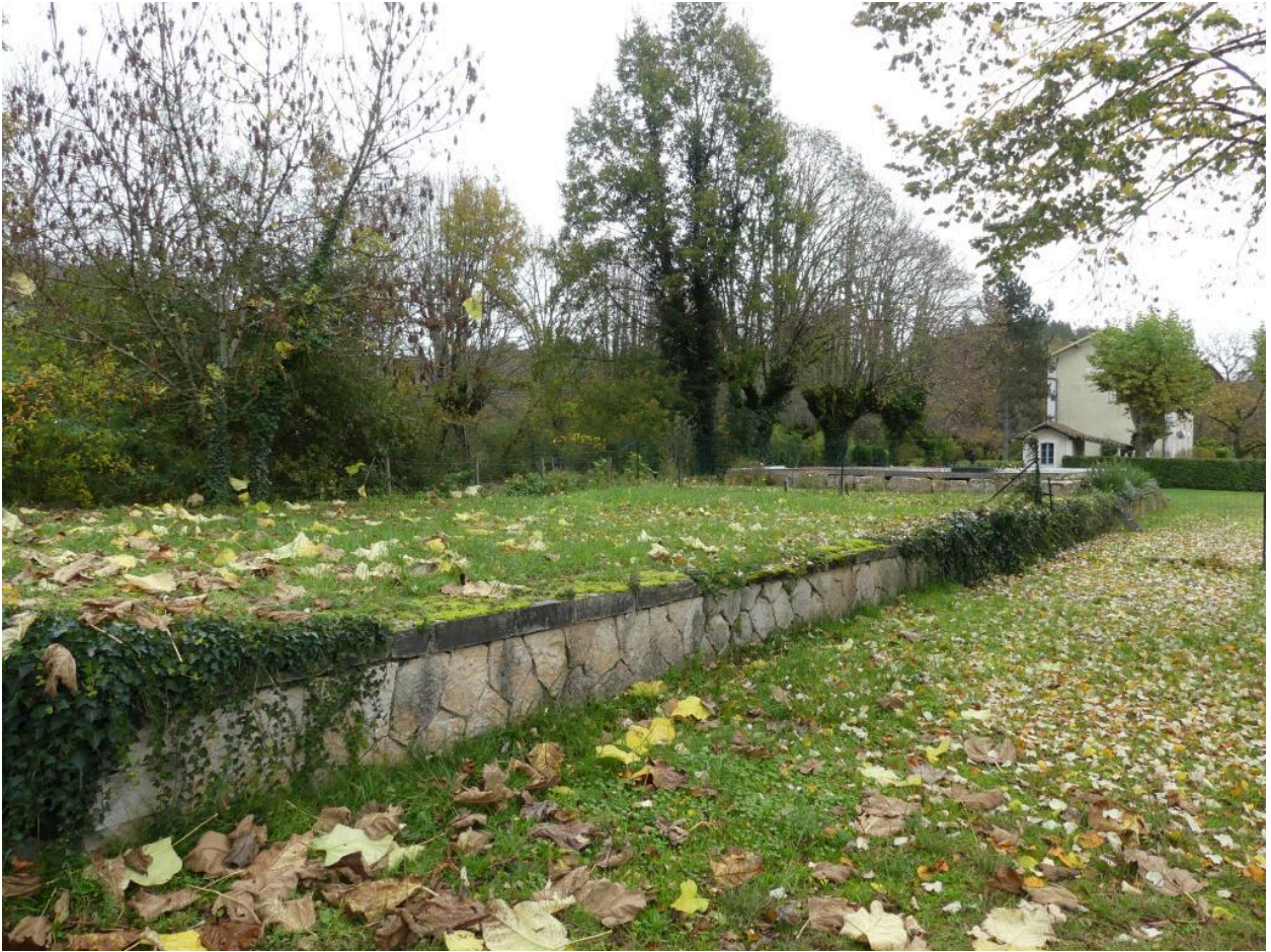
Vestiges de la rampe des halles à marchandises disparues.