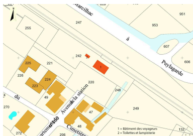
Extrait du plan cadastral de 2019. IVD46_20214605023NUCA