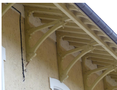
Bâtiment des voyageurs, élévation sud-ouest : aisseillers.