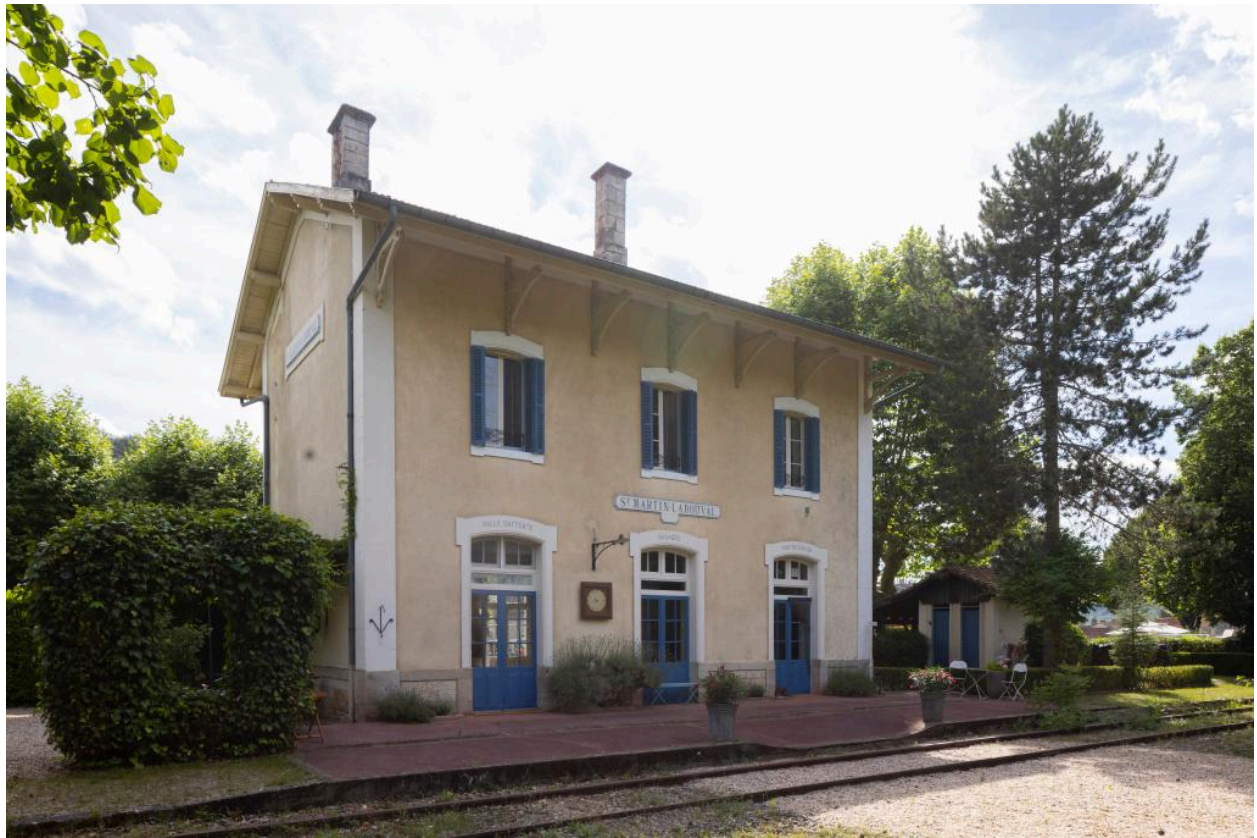
Elévation sur la voie.