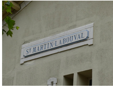
Bâtiment des voyageurs, élévation nord-ouest : cartouche contenant le nom de la station. IVD46_20214605009NUCA