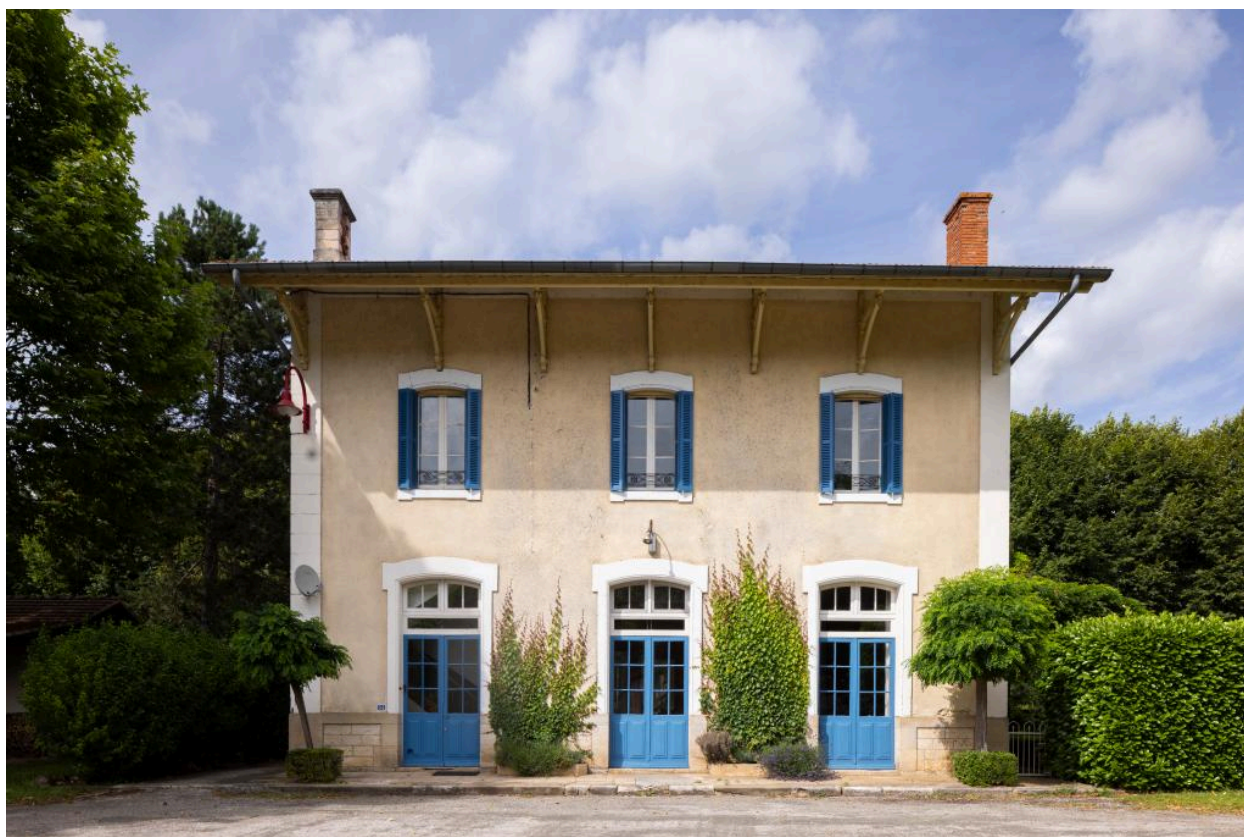
Elévation sur cour.