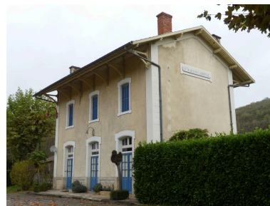
Bâtiment des voyageurs, vue depuis le sud-est.