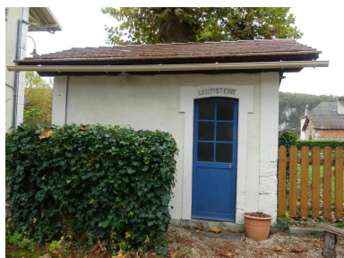
Toilettes et lampisterie, élévation nord-est.