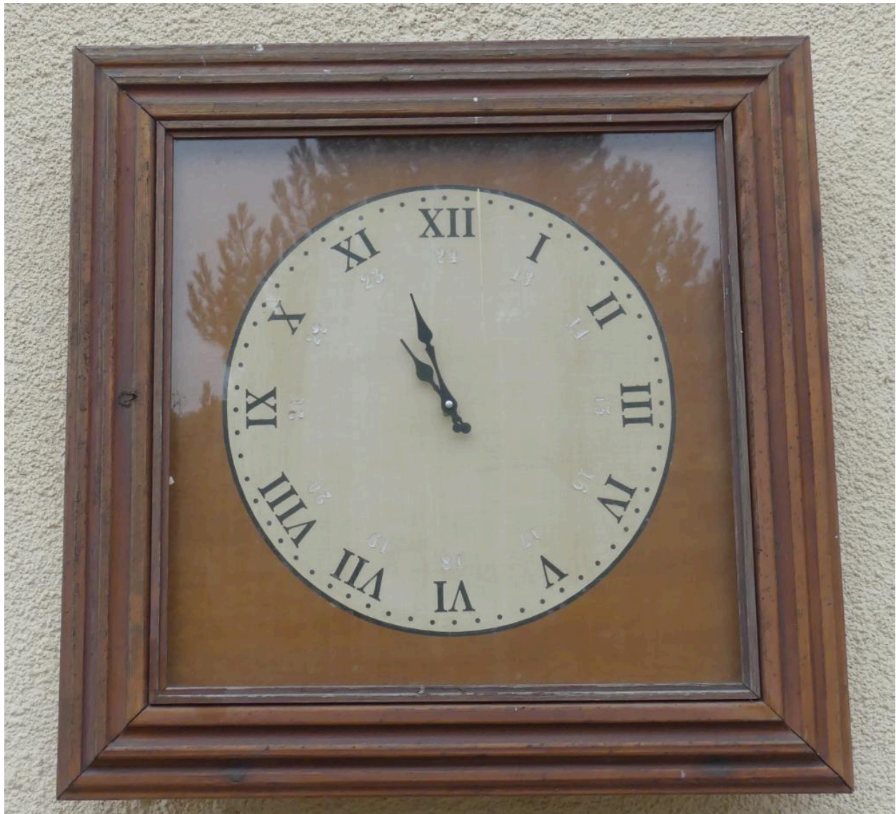
Bâtiment des voyageurs, élévation nord-est : horloge murale.