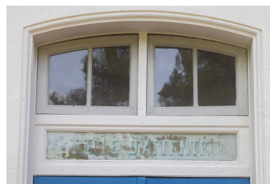
Elévation sur la voie : imposte d'une porte. IVR76_20244650191NUCA