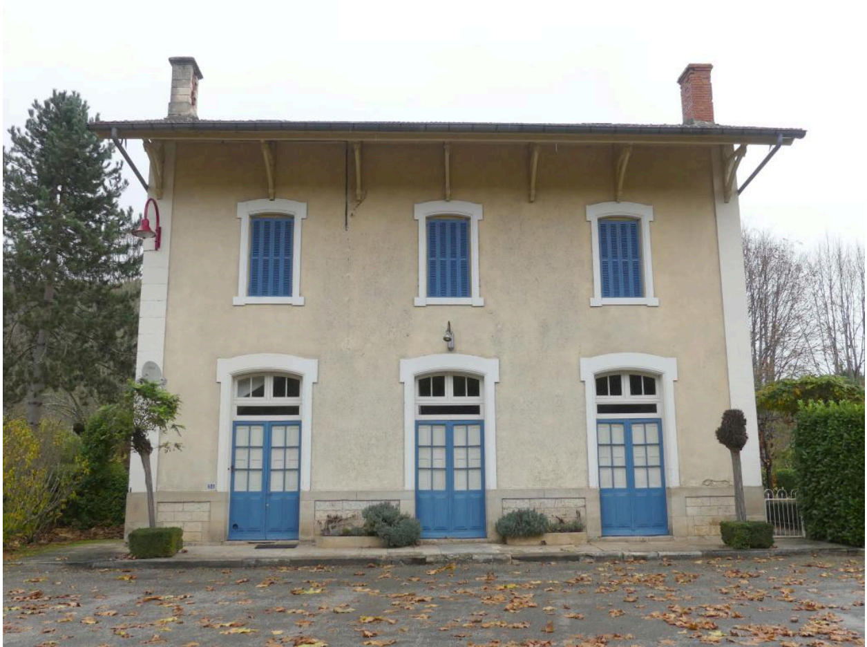
Bâtiment des voyageurs, élévation sud-ouest.