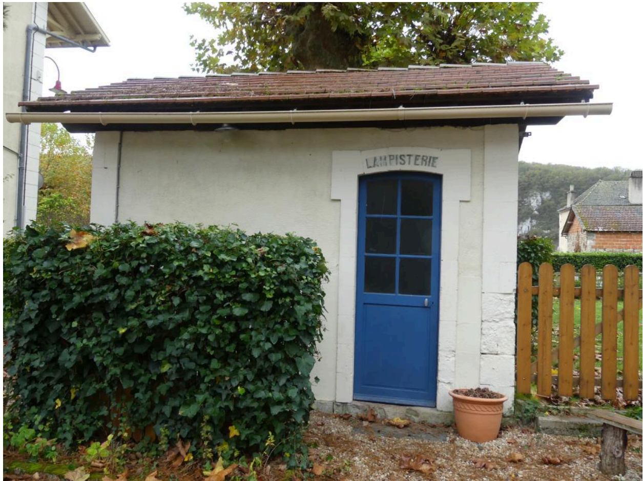
Toilettes et lampisterie, élévation nord-est.