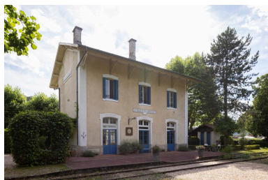
Elévation sur la voie.