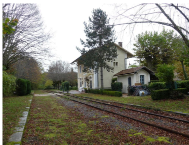
Vue depuis le nord-ouest. IVD46_20214605021NUCA