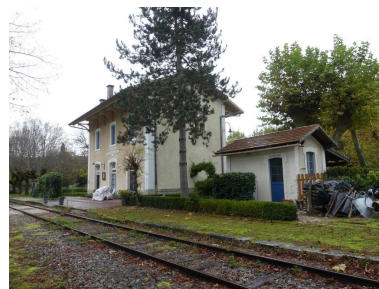
Vue depuis le nord-ouest. IVD46_20214605016NUCA