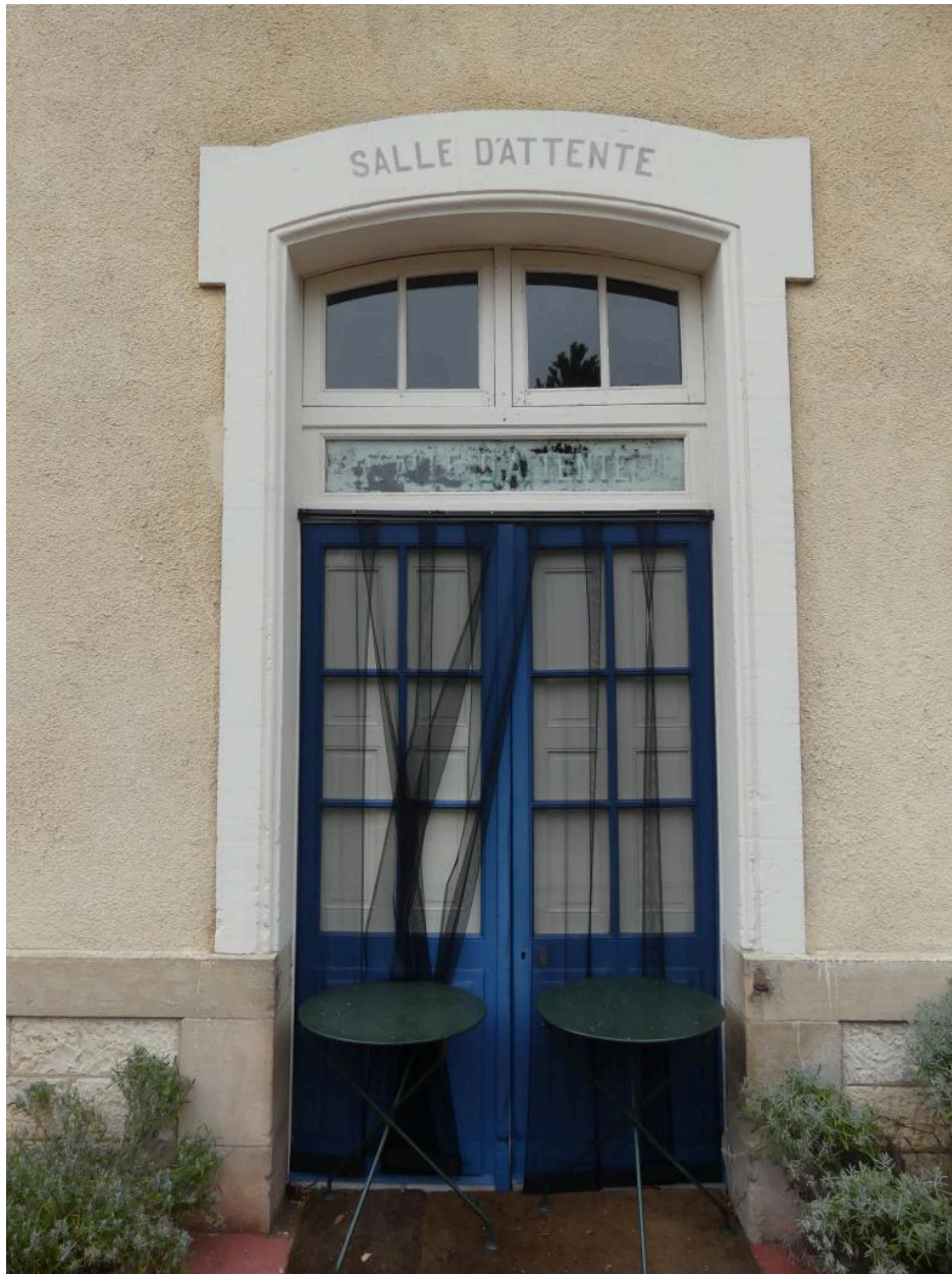
Bâtiment des voyageurs, élévation nord-est : entrée de la salle d'attente.