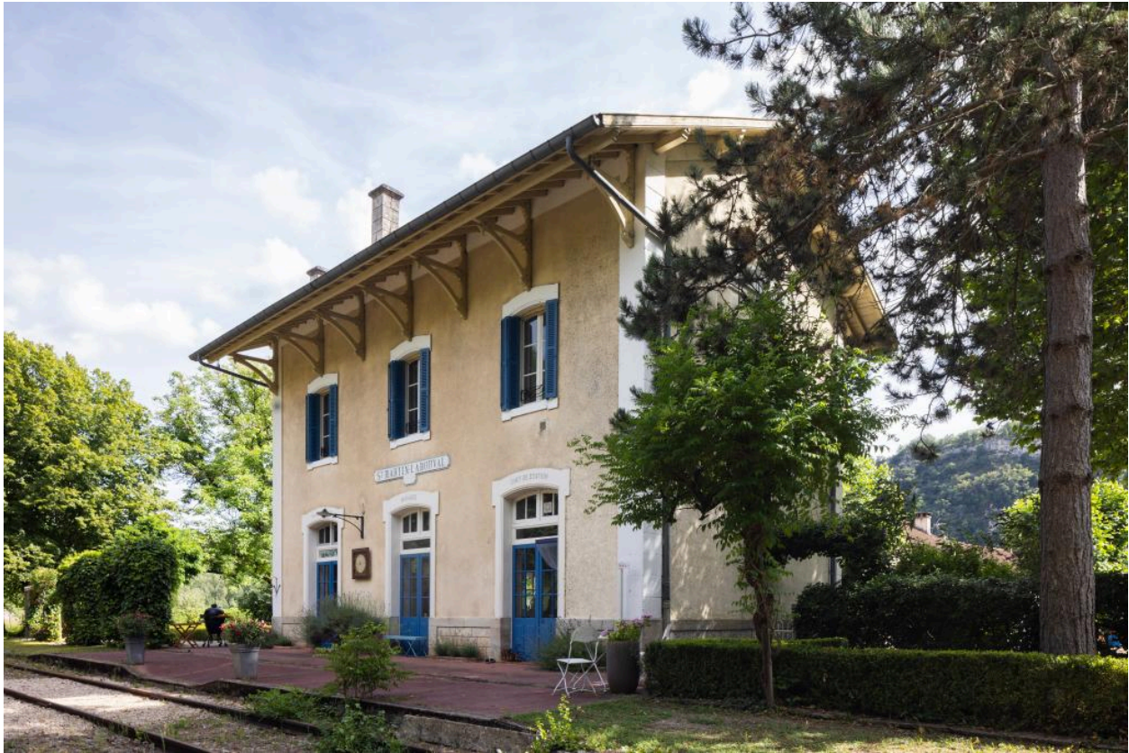
Elévation sur la voie.