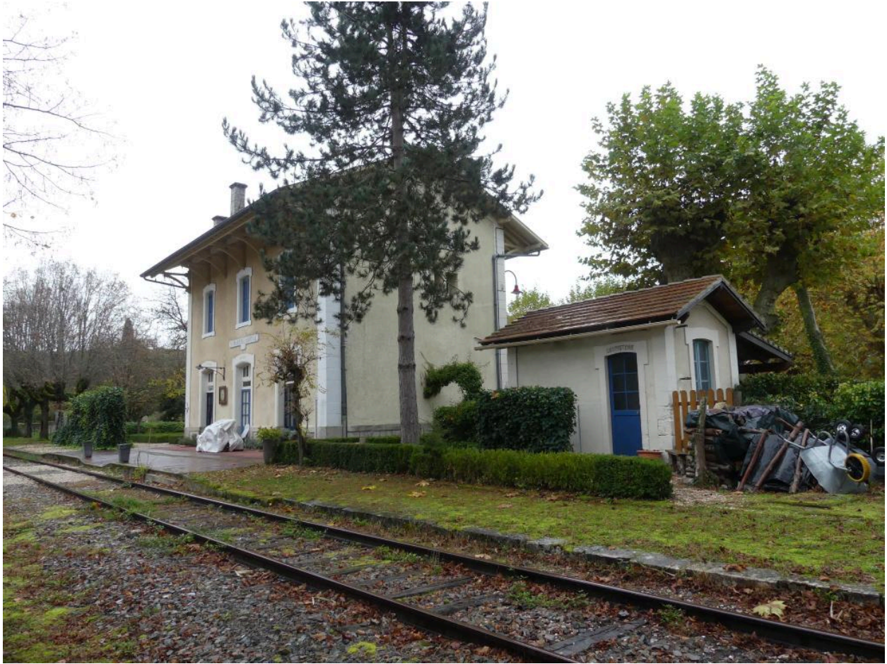
Vue depuis le nord-ouest.