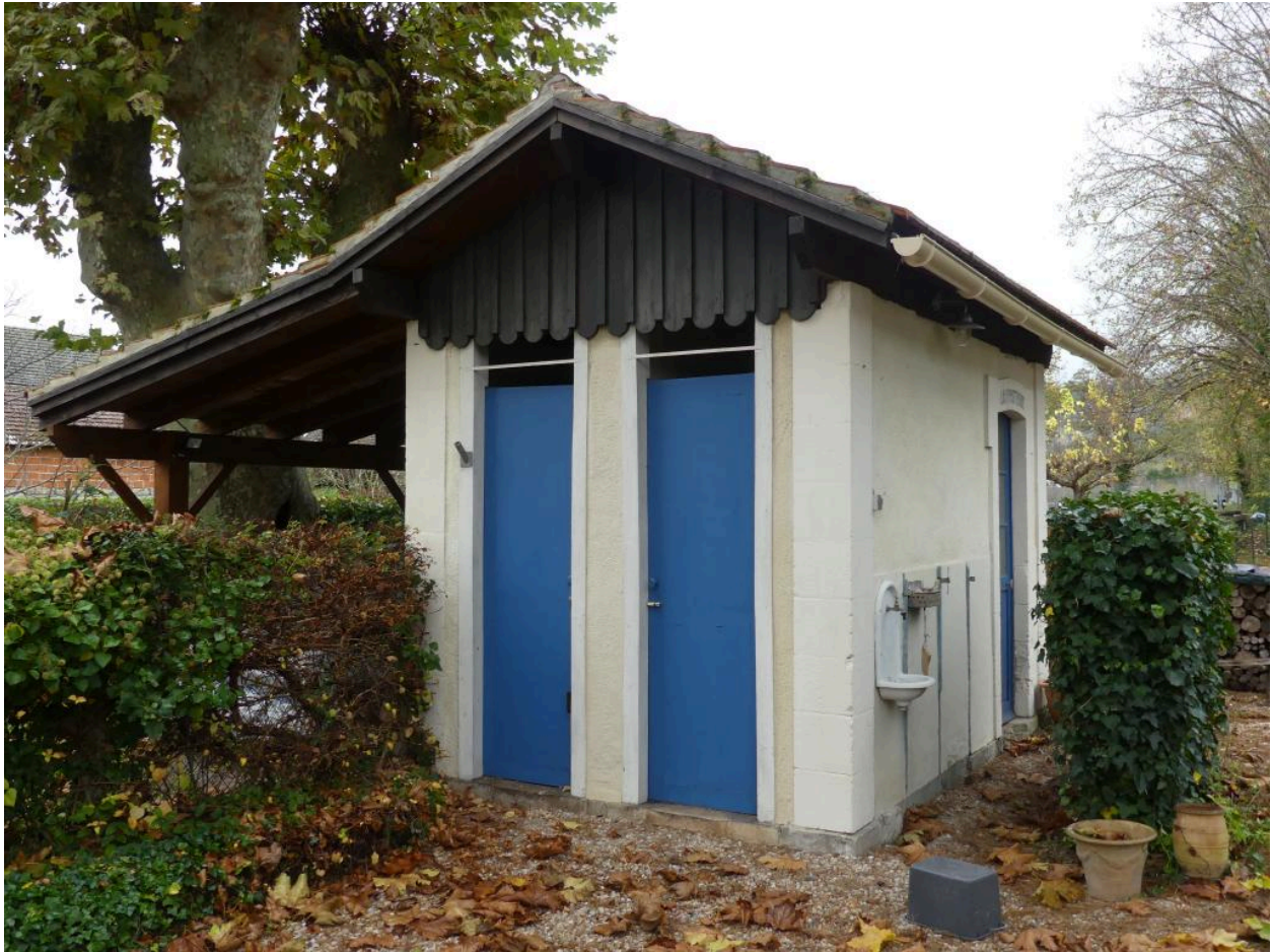
Toilettes et lampisterie, pignon sud-est : porte des toilettes.