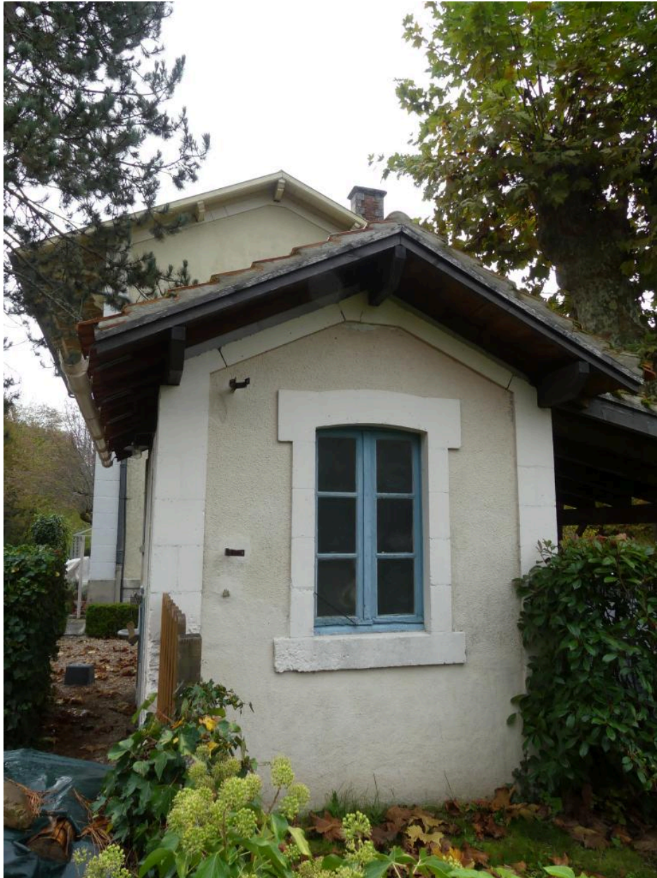
Toilettes et lampisterie, élévation nord-ouest.