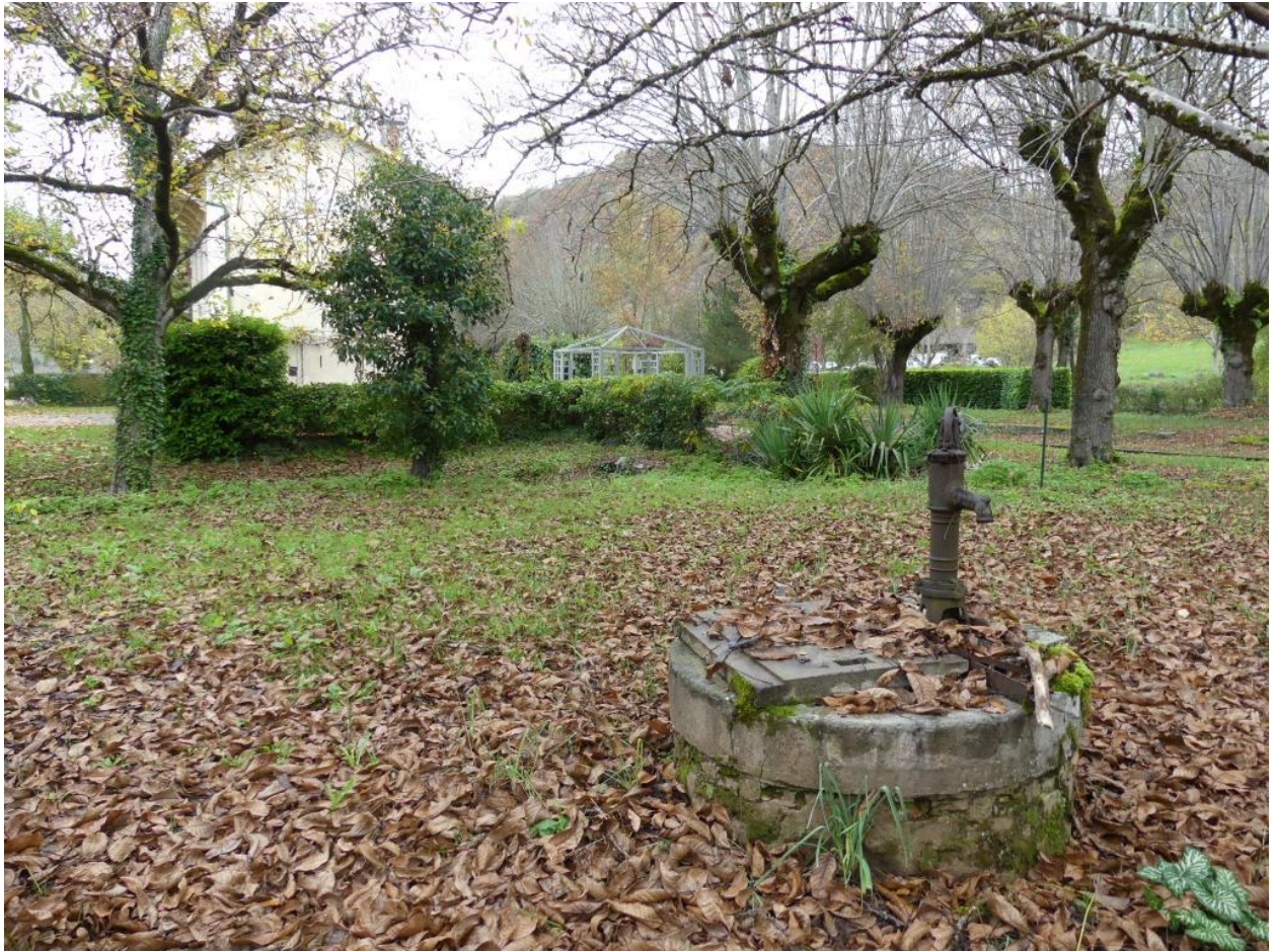
Jardin avec puits.