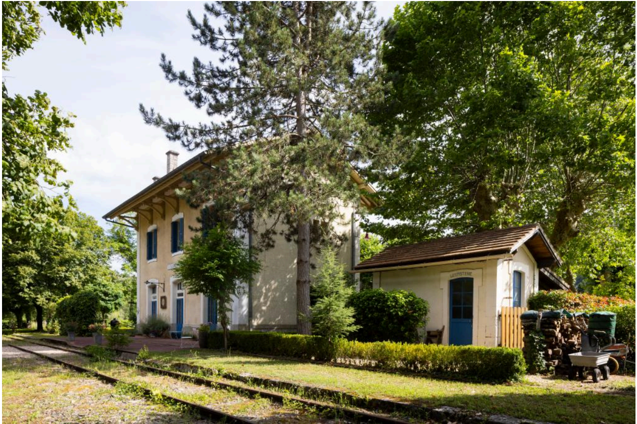
Elévation sur la voie.