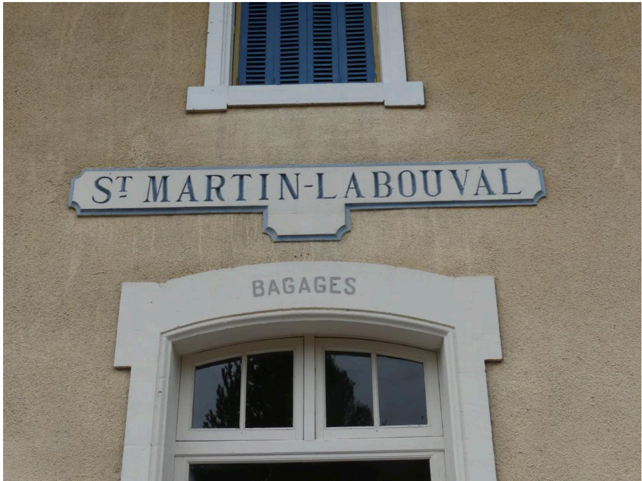
Bâtiment des voyageurs, élévation nord-est : cartouche contenant le nom de la station.