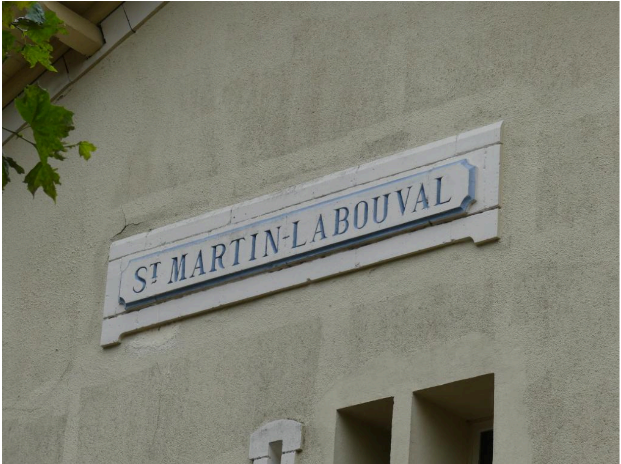
Bâtiment des voyageurs, élévation nord-ouest : cartouche contenant le nom de la station.