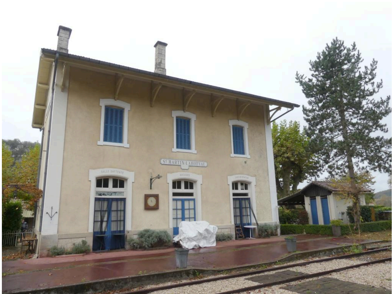
Bâtiment des voyageurs, élévation nord-est.