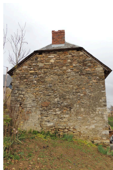
Elevation sud. IVD65_20146500460NUCA