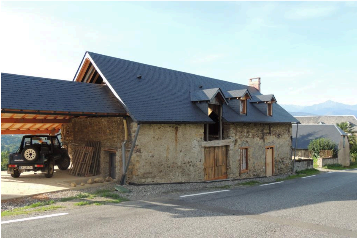
Vue de la ferme en cours de réhabilitation.