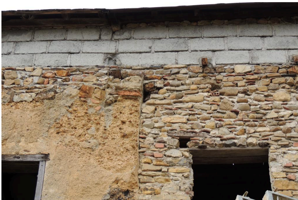
Détail de l'élévation est.