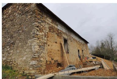
Elévation est. IVD65_20146500461NUCA