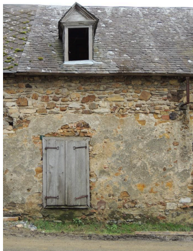
Détail de la façade sur rue (fenêtre et lucarne).