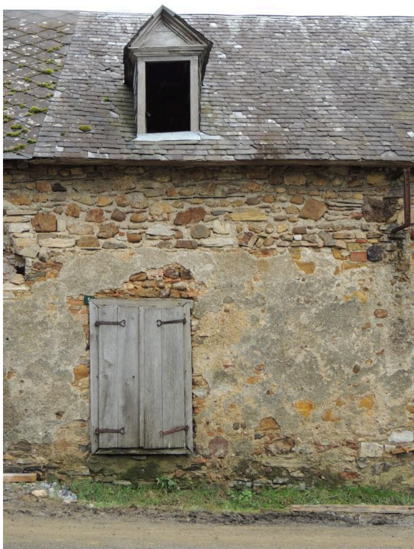
Détail de la façade sur rue (fenêtre et lucarne).