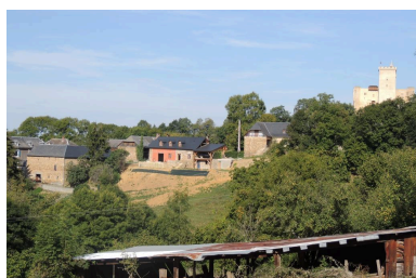
Vue de la ferme et des alentours depuis l'ouest.