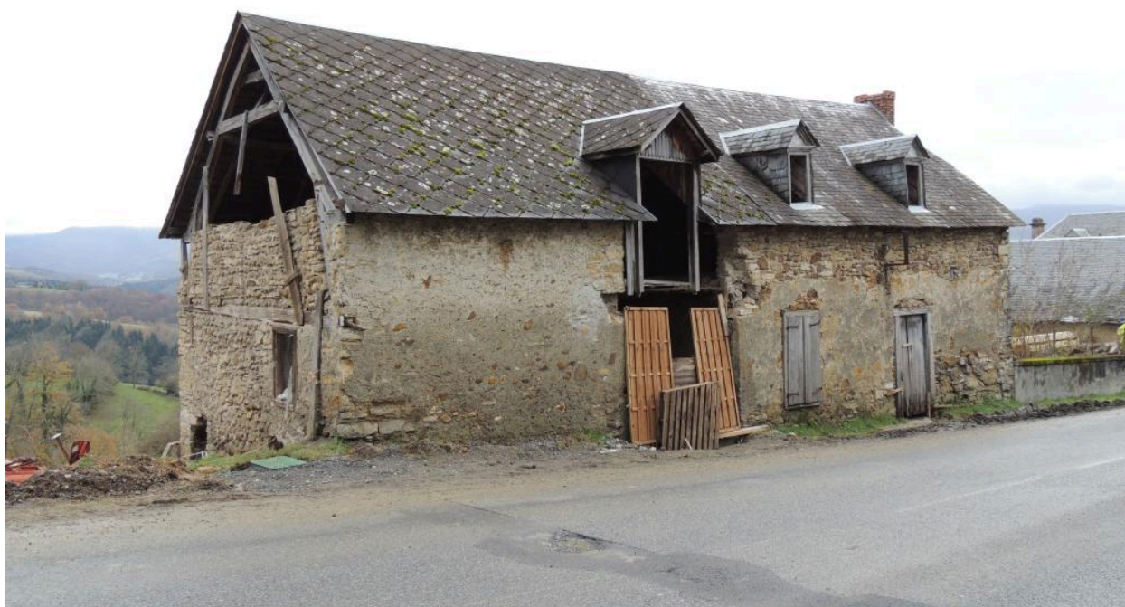
Vue de la ferme depuis l'ouest.