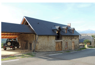
Vue de la ferme en cours de réhabilitation.