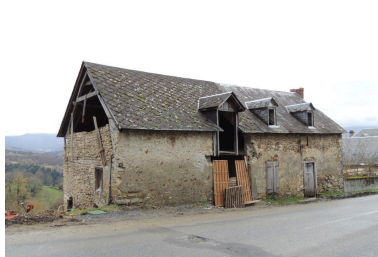
Vue de la ferme depuis l'ouest. IVD65_20146500458NUCA