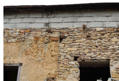
Détail de l'élévation est. IVD65_20146500462NUCA