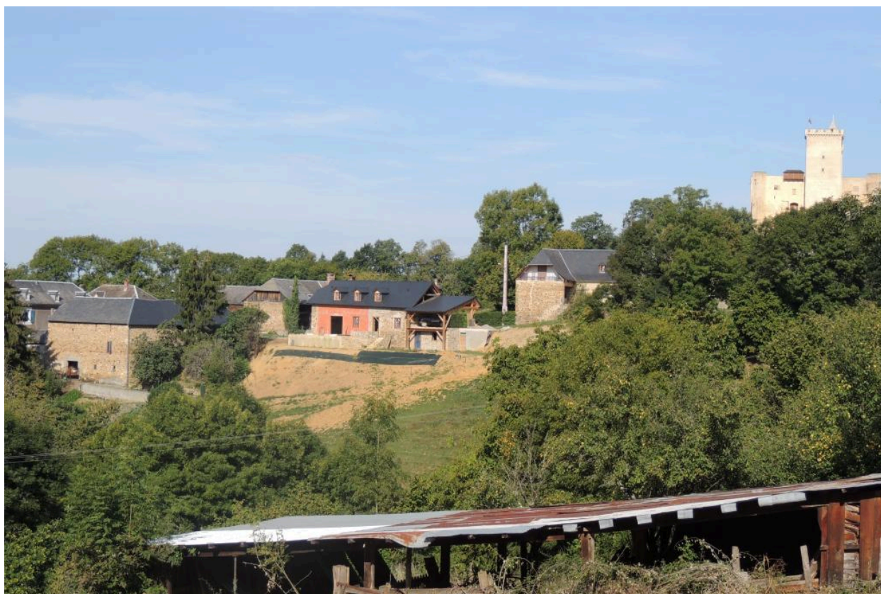
Vue de la ferme et des alentours depuis l'ouest.