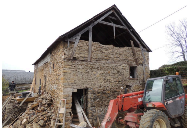
Elévation nord. IVD65_20146500463NUCA